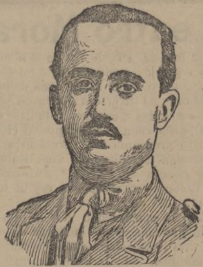
Don Francisco Franco Baamonde, jefe del Tercio Extranjero que acaba de ser premiado con el ascenso a General de Brigada.