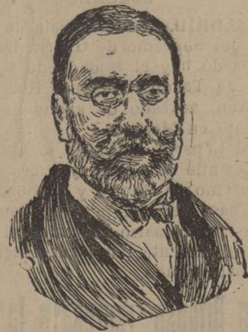
Don Benigno de la Vega Inclán y Elgueta, ilustre escritor que ha sido elegido Académico de la de la Historia