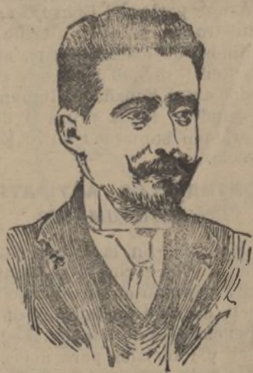
El ilustre político portugués Alfonso Costa, que ha sido elegido presidente de la Sociedad de Naciones.