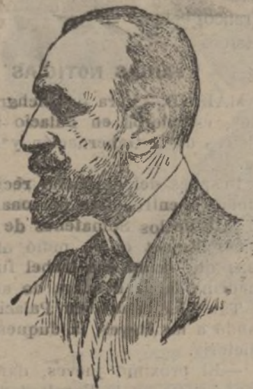
El gran explorador francés Juan Charcot que ha sido elegido miembro de la Academia de Ciencias de París