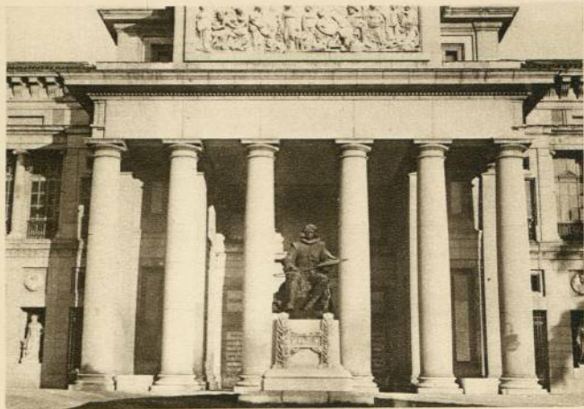
ESTATUA DE VELÁZQUEZ (Madrid)

Delante de la entrada principal del Museo del Prado, esa magnífica columnata que es uno de los más bellos ornatos arquitectónicos de Madrid, se alza la estatua del pintor D. Diego Velázquez de Silva.