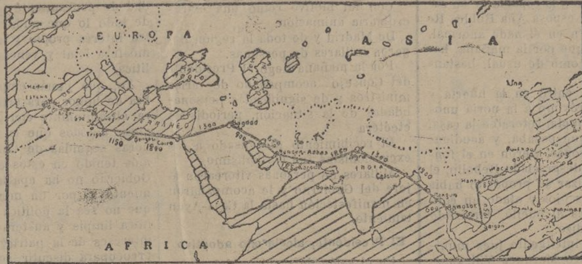
El trazo indica los lugares donde harán escala los aviadores Loriga y Gallarza