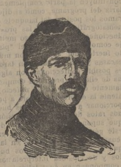
El teniente coronel de Ingenieros don Alfredo Kindelan que ha sido nombrado jefe de la aviación militar