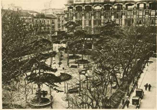
PLAZA DE SANTA ANA Y ESTATUA DE CALDERÓN (Madrid)

Al ser derribado durante la ocupación francesa el convento de Santa Ana, quedó formada esta plaza, a la que se dió el nombre del monasterio desaparecido y con el cual se la conoce generalmente, a pesar de que su denominación oficial es la del Príncipe Alfonso, por el hijo de Isabel II, más tarde Alfonso XII. Durante la revolución esta plaza fué llamada de Topete.