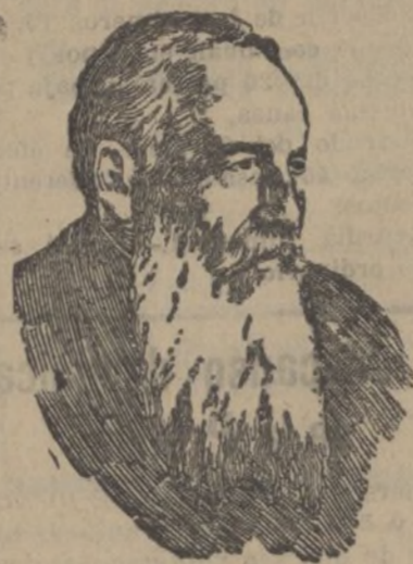
Mr. Nicolás Patchich, expresidente del Consejo de ministros de Servia, que ha fallecido en Belgrado.