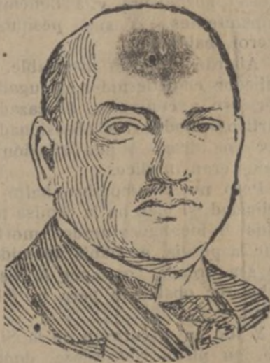
Stresemann, político alemán al que se ha concedido el Premio Nobel de la Paz de 1926.