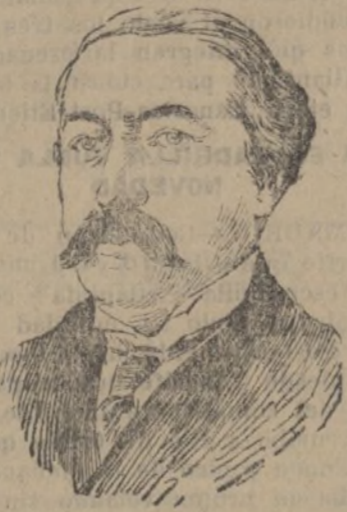
Aristides Briand, expresidente del Consejo de ministros francés, agraciado con el Premio Nobel de la Paz en 1926.