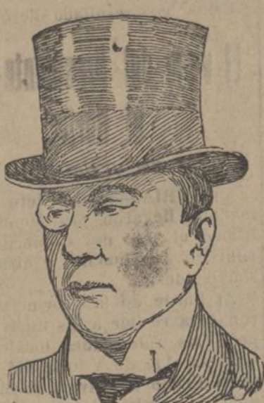
Mr. Chamberlain ministro inglés al que se le ha concedido el Premio Nobel de la Paz de 1925