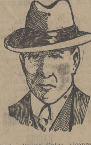
Charles Dawes, vicepresidente de Norteamérica al que se le ha concedido el Premio Nobel de la Paz de 1925