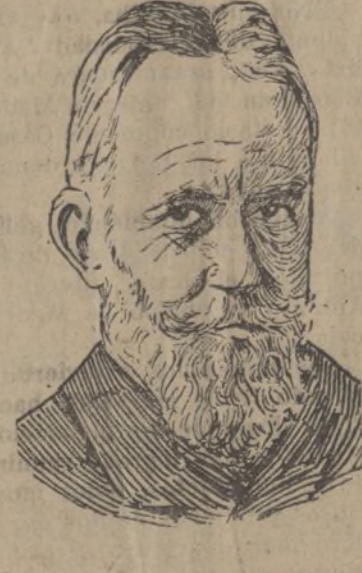
El ilustre y famoso dramaturgo inglés Bernard Shaw al que se le ha otorgado el Premio Nobel de Literatura correspondiente al año 1925