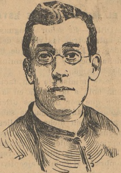
El ilustre filólogo catedrático don Julio Cejador, que ha fallecido en Madrid