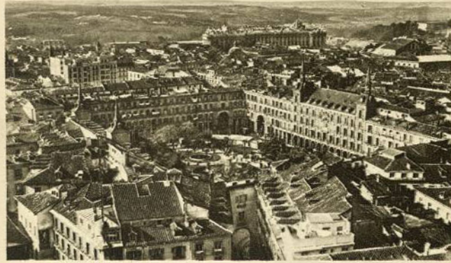
VISTA OCCIDENTAL DE MADRID

Una parte venerable de la capital de España es la que se descubre en este panorama, en que se destaca la Plaza Mayor como centro y motivo principal de la fotografía, y en el límite que separa a Madrid del campo en esa parte de Poniente, la elegante silueta del Palacio Real.