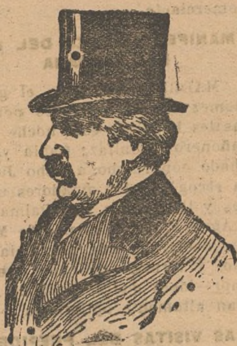
FIGURAS DEL DÍA

El expresidente del Consejo francés Sr. Briand que espera en Ginebra la llegada del presidente de Checoslovaquia señor Masarik para cumplimentarle en nombre del Gobierno francés y personalmente.