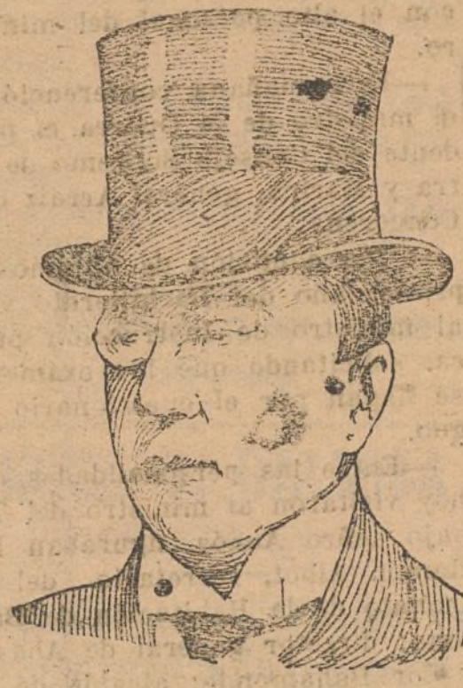
FIGURAS DEL DÍA

Sir Austin Chamberlain, ministro inglés que ha dicho en Ginebra, donde encuentra estos días la sesión actual del Consejo de Naciones, no será tan movida como otras anteriores, pero no será por eso menos interesante, pues los asuntos de Rumania y Hungría, reclaman un examen atento.