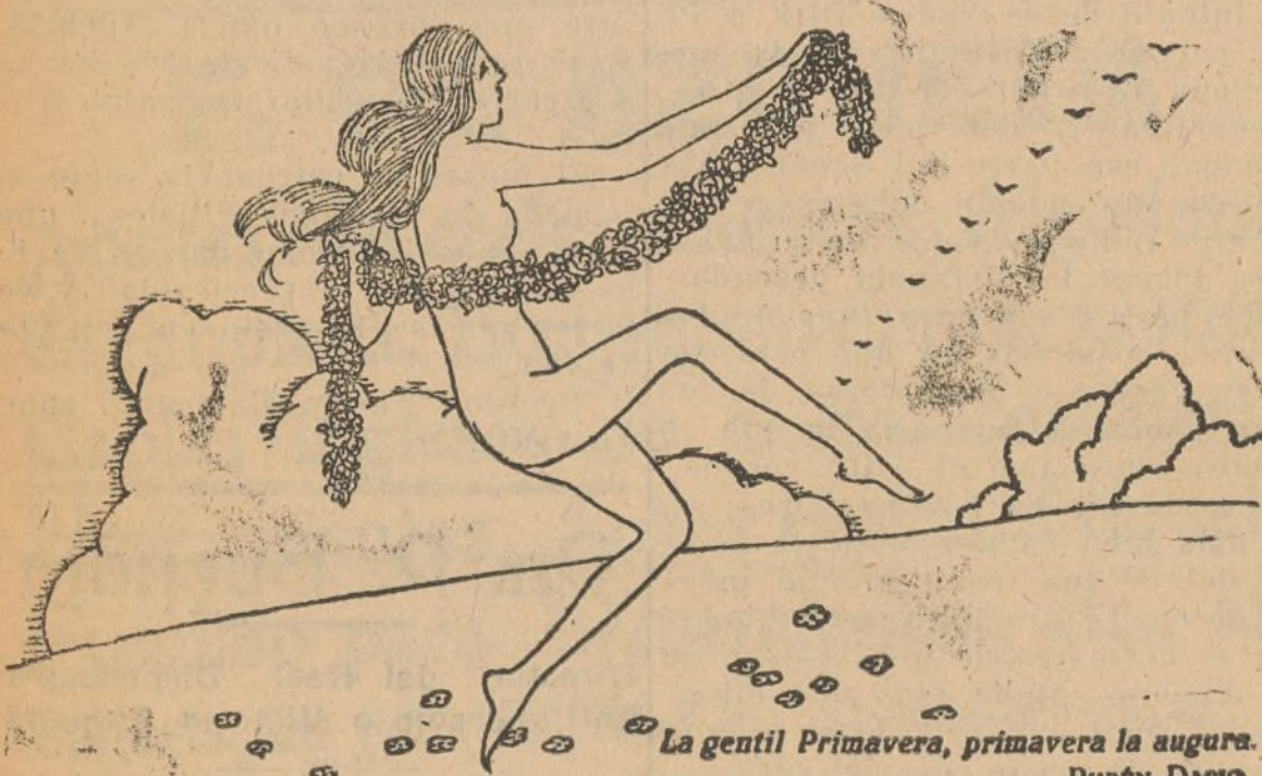
La gentil Primavera, primavera la angustia. RUSIN DAMO

La Fábrica de Gaseosas LA FORTUNA comunica a su innumerable clientela ha establecido el reparto por docenas al precio de cajas completas, al igual que el de los productos de su fabricación, de la famosa Cerveza EL AGUILA de Madrid, de cuya tan acreditada marca es Depositaria.