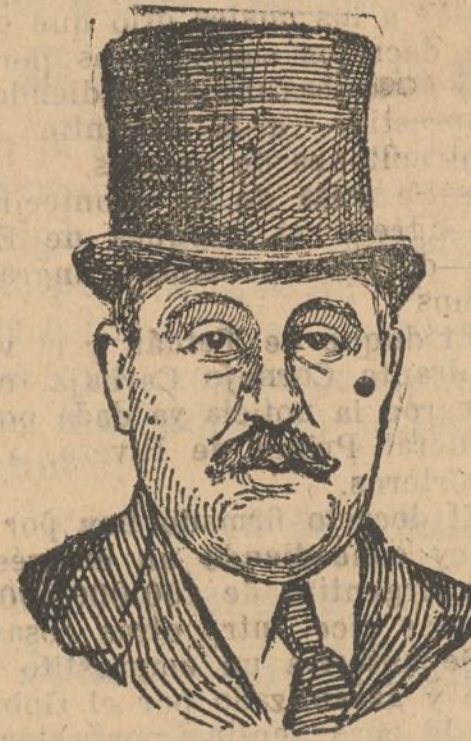
Don Gabriel Maura, que ha cerrado el ciclo de conferencias celebradas en la Academia de Jurisprudencia, con motivo del centenario del Rey Felipe II