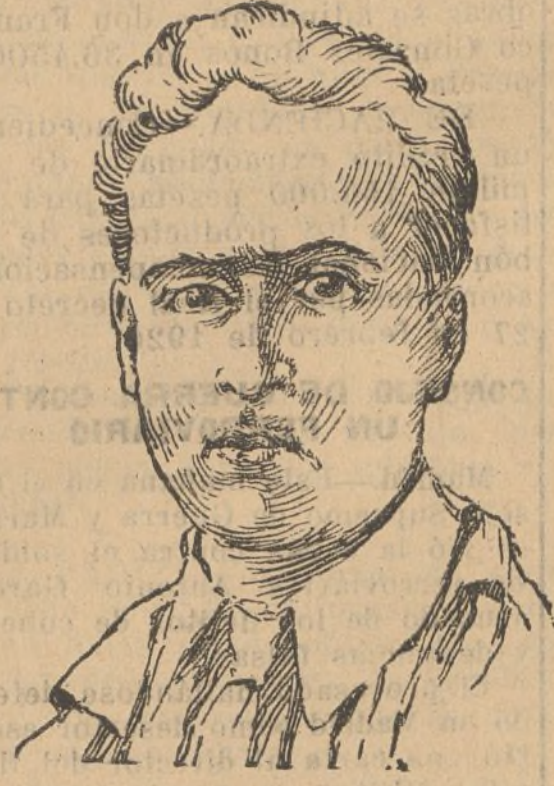
Don Daniel Vazquez Diaz distinguido pintor norteno, que ha inaugurado una exposición de sus obras en el Circulo de Bellas Artes de Madrid