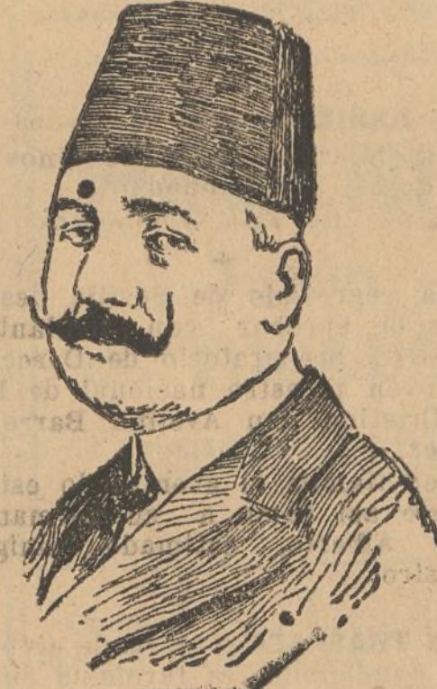
Fuad Pachá I, bey de Egipto, que ha resuelto la tirantez de relaciones con Inglaterra.