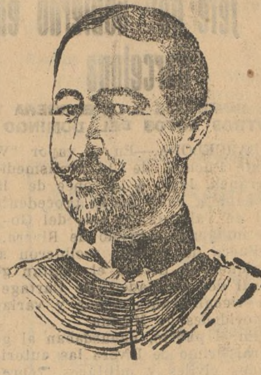
El general Averesco, Presidente del Consejo de ministros de Rusia, que ha presentado la dimisión del Gobierno en pleno.