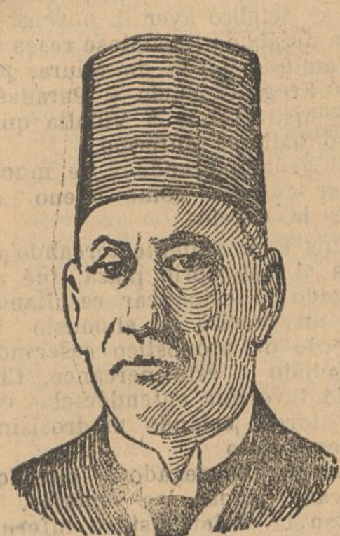
Sawat Pachá, primer ministro de Egipto, que provocó una seria tirantez de relaciones con Inglaterra.