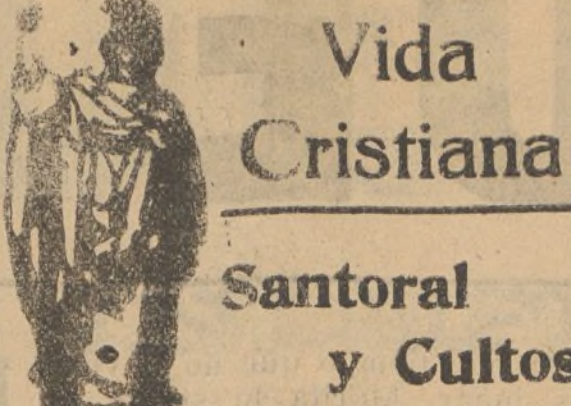
Santos de hoy

NOTA.—Esta magnífica Canoa hará viajes particulares al que lo solicite a precios económicos.