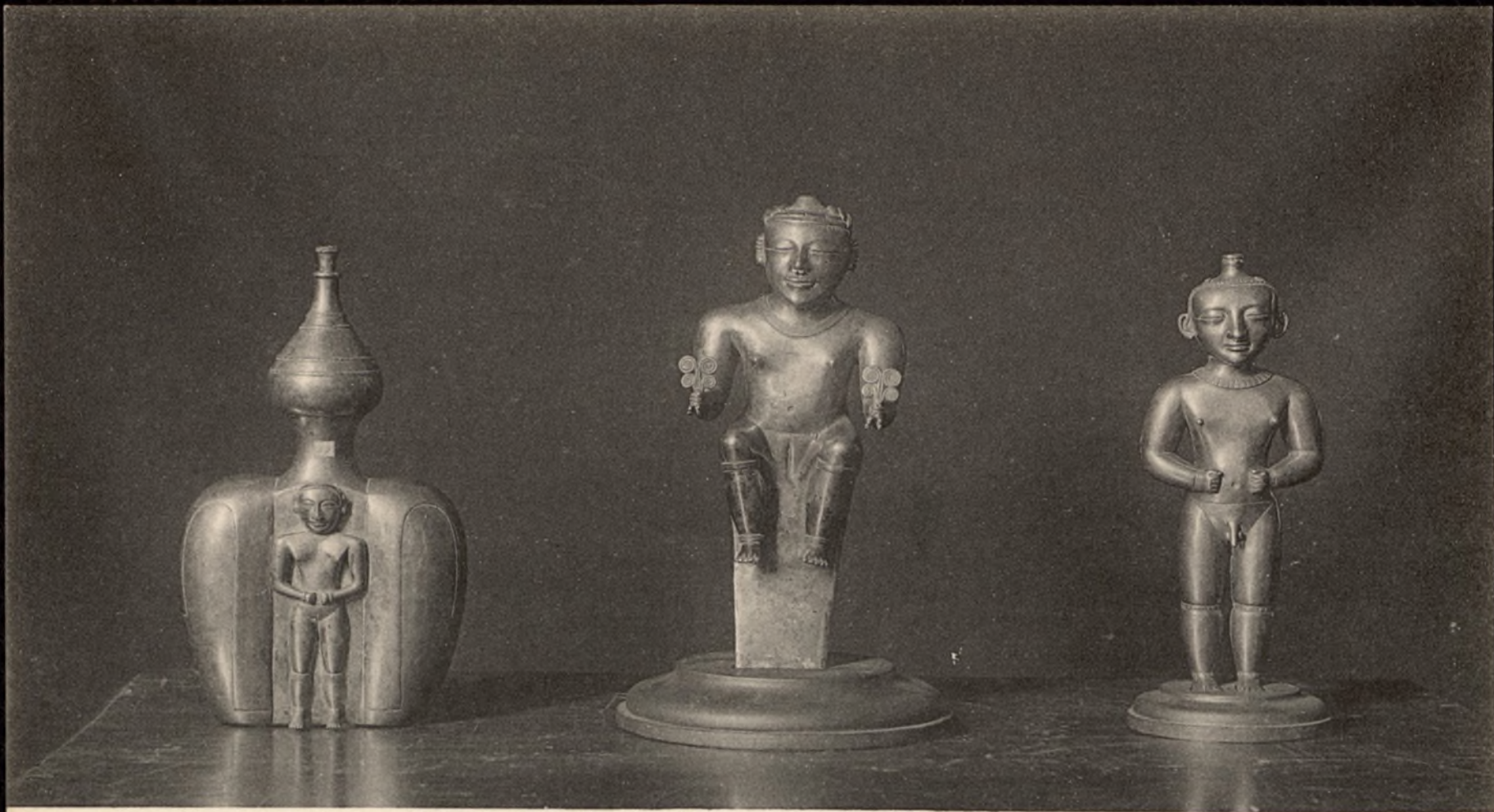
MUSEO ARQUEOLÓGICO NACIONAL DE MADRID Ayuntamiento de Madrid