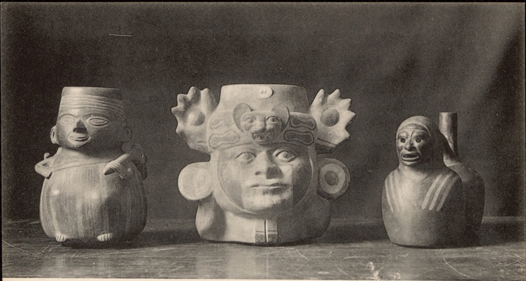
MUSEO ARQUEOLÓGICO NACIONAL DE MADRID Ayuntamiento de Madrid