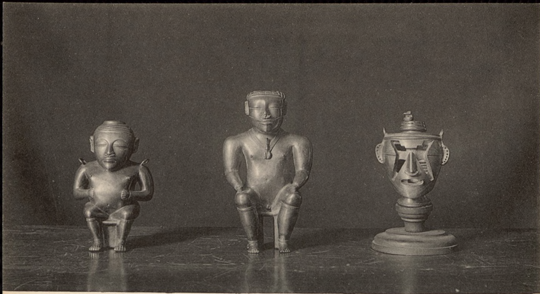
MUSEO ARQUEOLÓGICO NACIONAL DE MADRID Ayuntamiento de Madrid