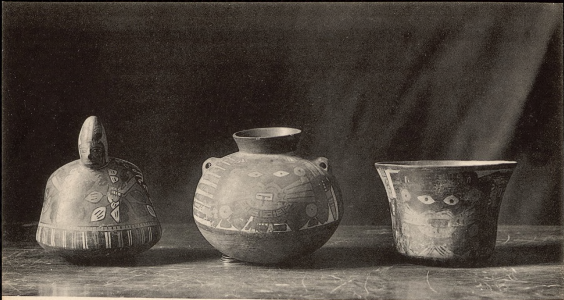
MUSEO ARQUEOLÓGICO NACIONAL DE MADRID Ayuntamiento de Madrid