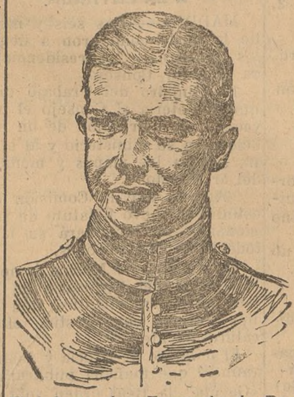
El infante don Fernando de Baviera, y Borbón, que ha ascendido a general de división