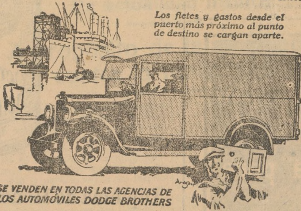
Los fletes y gastos desde el puerto más próximo al punto de destino se cargan aparte.

Chassis de 1 ª toneladas. Ptas. 13.000 Chassis de 2 ª toneladas. Ptas. 15.000