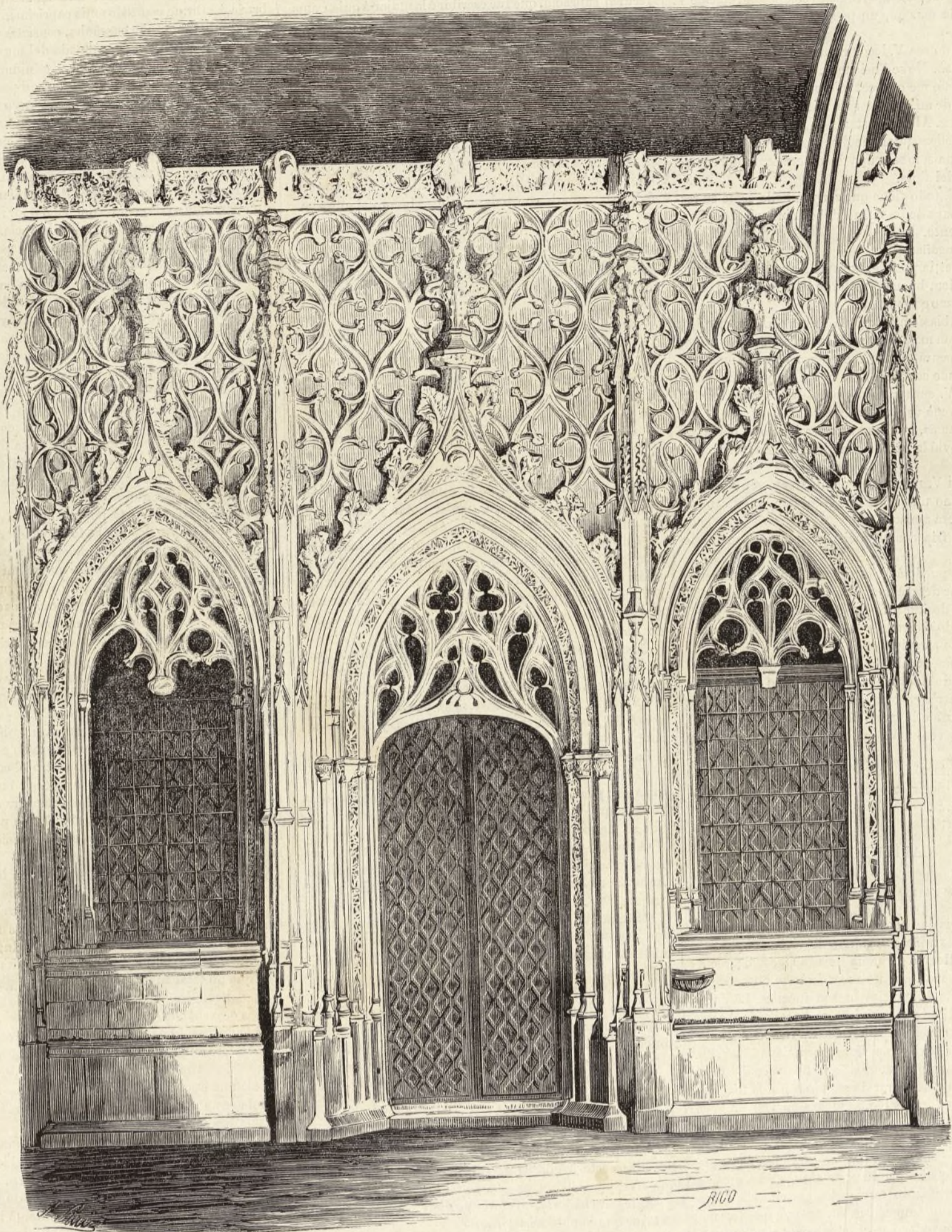
PORTADA DE LA CAPILLA DE SAN JORGE EN LA AUDIENCIA DE BARCELONA.

Augusto con voz resuelta. Me dispensará usted si no la hablo con la elegancia y la delicadeza de uno de esos dandys del gran mundo, que de nada se ocupan más que de la galantería, y que como la mariposa vagan de flor en flor, sin detenerse en ninguna. Señora, yo me eduqué en el ejército desde la edad de 12 años, que empecé mi carrera de cadete, hasta la de 35 que tengo hoy y en que la bondad de S. M. me hizo su "mariscal de campo." Mis galanteos fueron las armas, mis bailes y sociedades el combate; no soy más que un buen soldado lleno de verdad y franqueza, ruda tal vez. Hasta que la conocí á V., todo mi cariño lo poseyó mi familia, hoy de ella solo me queda una hermana á la que amo