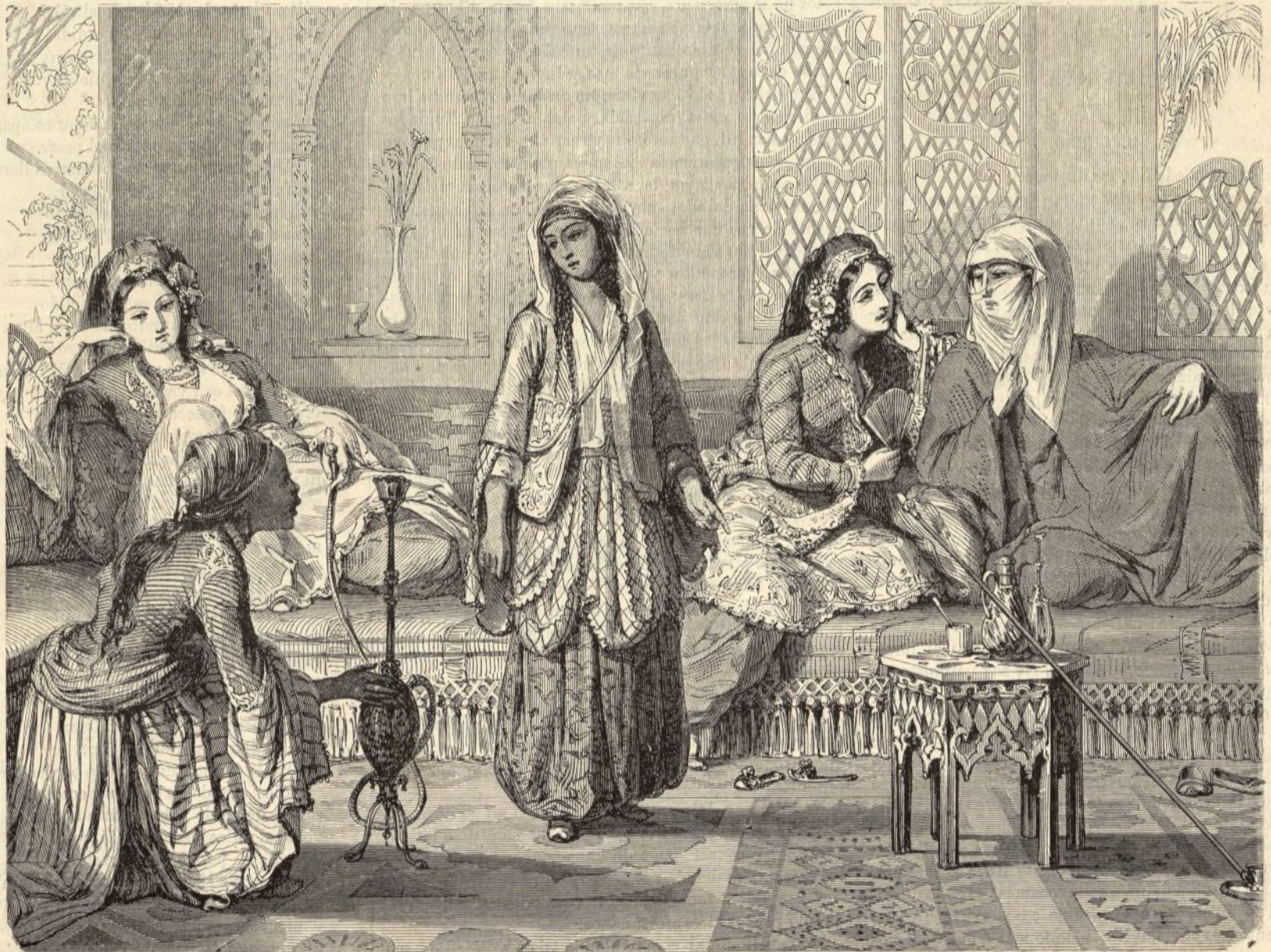
LAS MUJERES DEL SERRALLO. Ayuntamiento de Madrid

Fijemos un momento nuestra consideracion sobre una Hermana de la Caridad. En la flor de sus dias, en la pri-