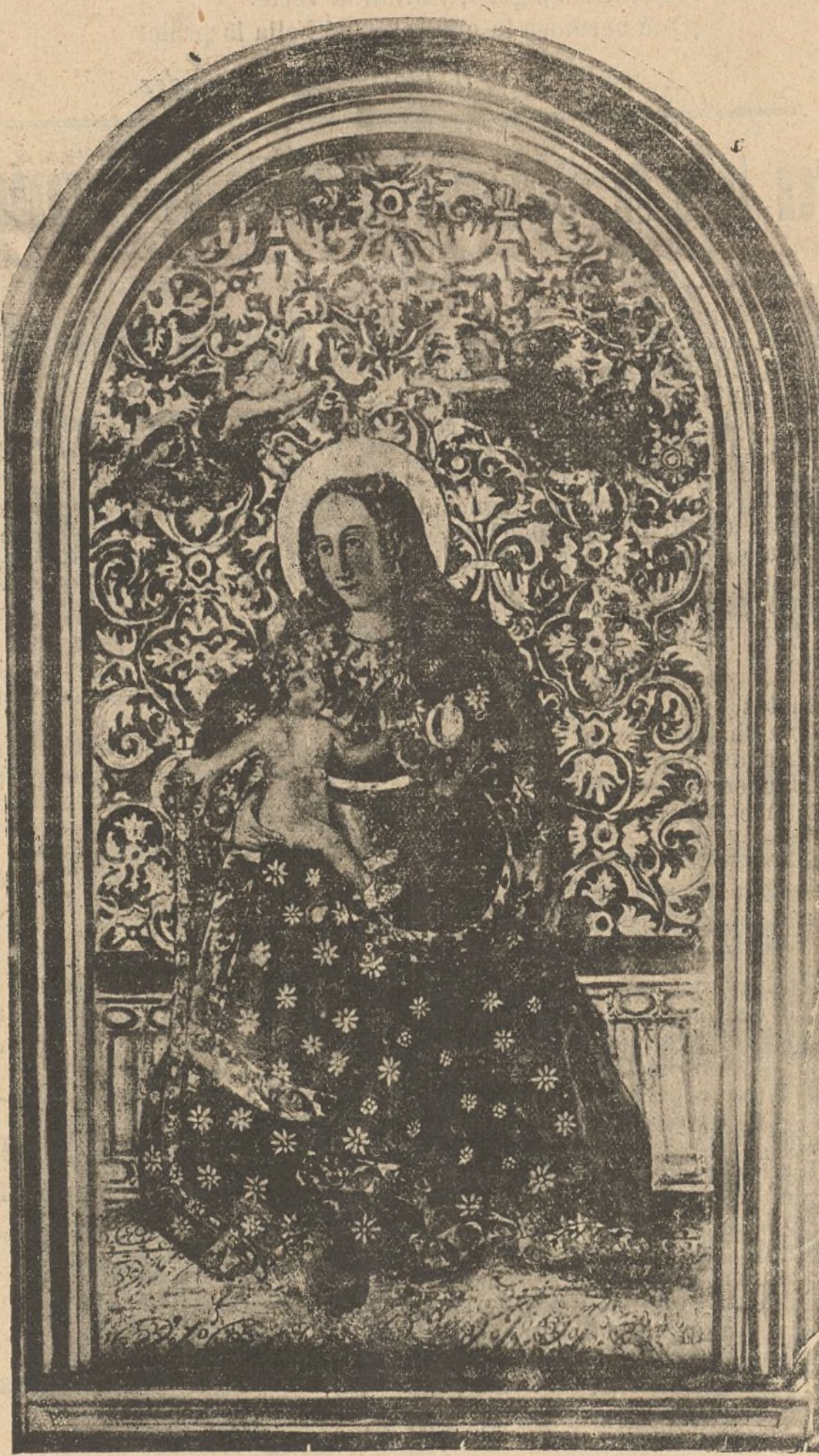
Nuestra Sra. de la Cinta, Patrona de Huelva

Una faena de las monumentales que todavía, a pesar de los diez años transcurridos la recuerdan los aficionados.