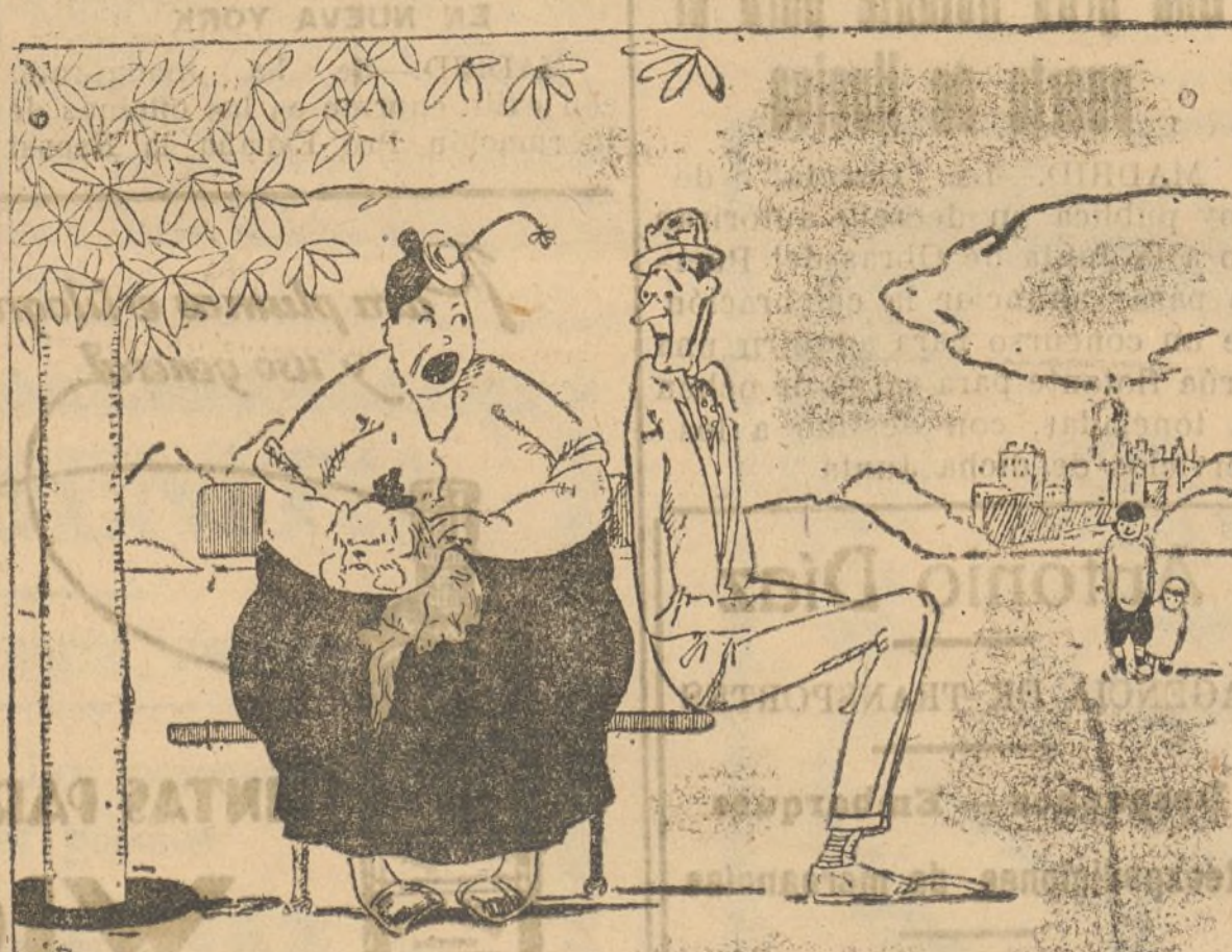
Ponelo... vote un poco más allá, que ocupas todo el asiento.

Estuches de compases GRAN SURTIDO. PRECIOS BARATISIMOS PAPELERIA DEL DIARIO ALCALDE MORA CLAROS, 5