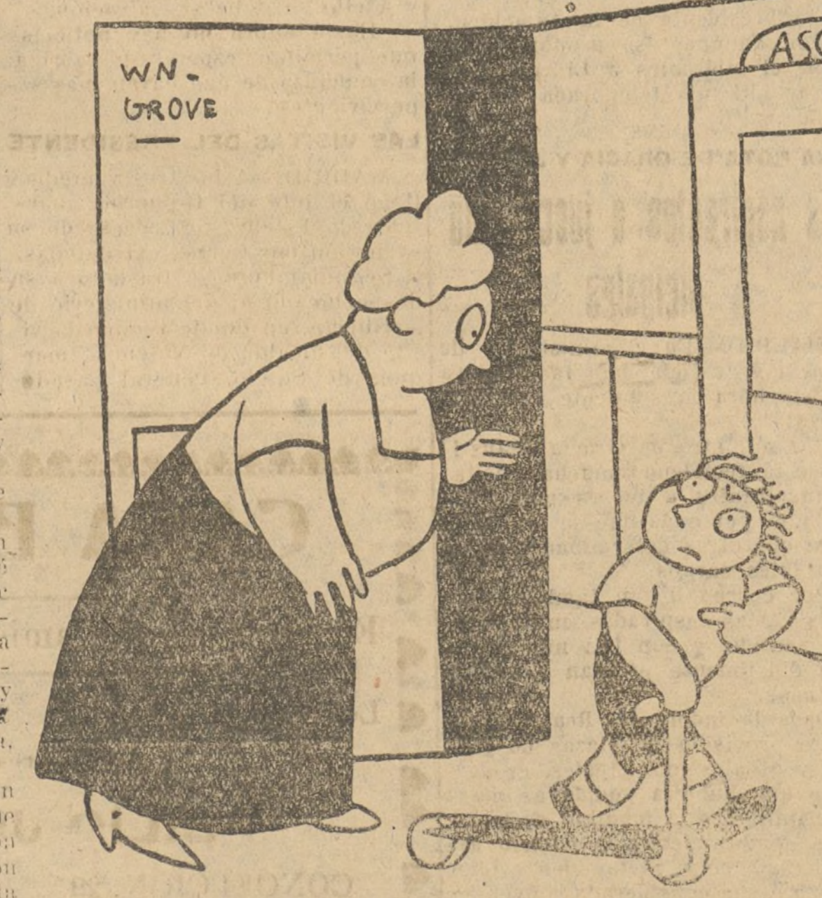
—¿Dónde va, Pepito? —A sacar el Ayuntamiento de Madrid