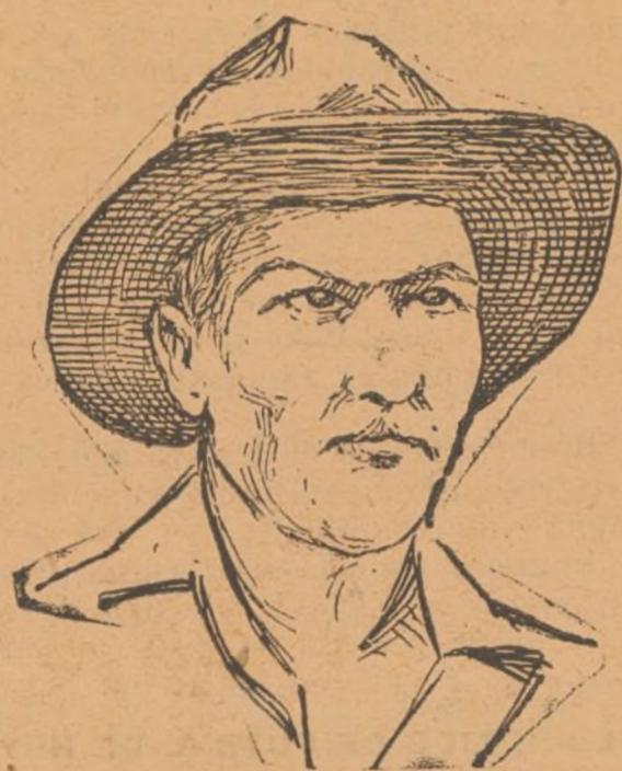
El general César Augusto Sandino, jefe de los rebeldes de Nicaragua, que se dio a conocer en la frontera de Honduras gravemente herido.