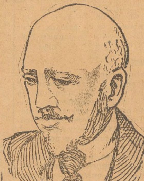
Gabriel D'Annunzio, ilustre poeta italiano que se encuentra gravemente enfermo de una bronconeumonía