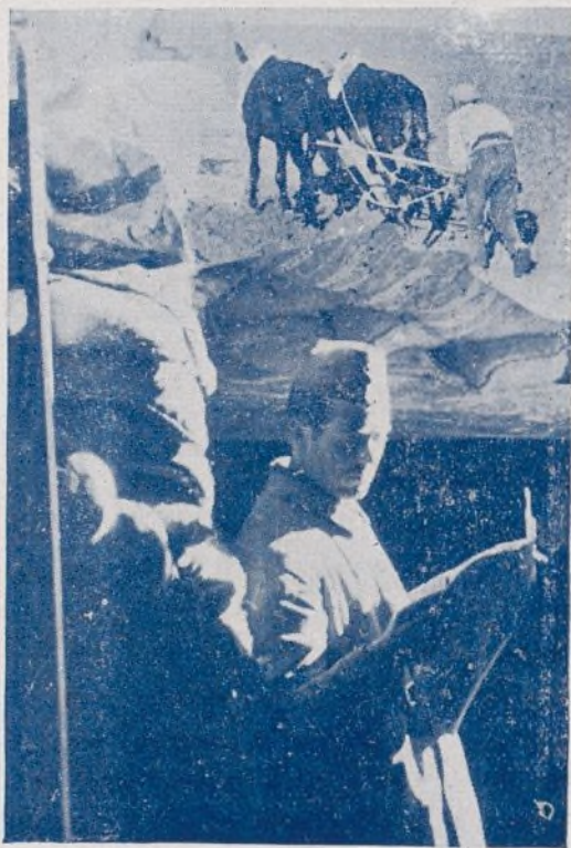
Vanguardia y retaguardia. Un solo frente para vencer al fascismo.

La unión la forjó el pueblo con su carne y con su sangre, y la emplea, en las trincheras, con brillantes resultados; allí, no hay más que obreros con un fusil en la mano, con una ametralladora, una bomba o un ca-