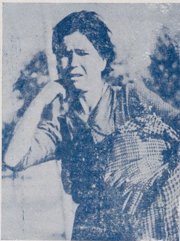
La aviación enemiga destruyó su pueblo, su hogar, la alejó de los suyos... El rostro patético grita angustia y maldición contra el invasor.

VALENCIA. Octubre.—La venta de libros ha crecido notablemente en el transcurso de este año. Todas las tiradas han aumentado. Así, por ejemplo, 50.000 ejemplares del «Romancero Gitano» de García Lorca, que constituían una de las últimas ediciones, se agotaron en 12 días. Una nueva edición de 100.000 ejemplares está en preparación.