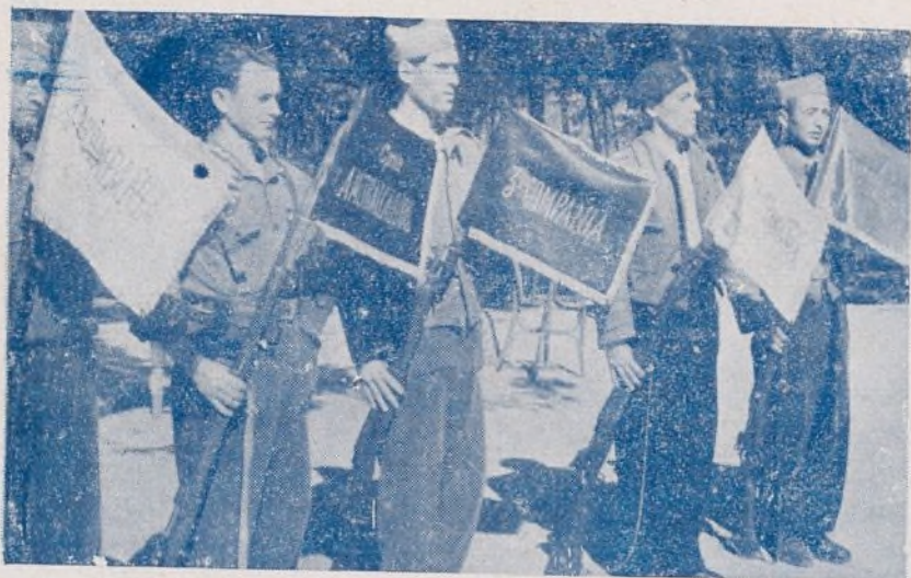
Los cinco banderines que el Grupo Barral, del Socorro Rojo, regaló a las Compañías del 167 Batallón.

El martes, 19 de octubre, se procedió a la entrega de cinco banderines, que el Grupo Barral, del S. R. I. del 167 batallón regaló a cada una de las compañías que integran la mencionada unidad.