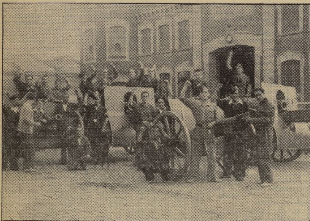
Las piezas del Parque de Artillería que tomaron parte decisiva en el asalto al cuartel de la Montaña