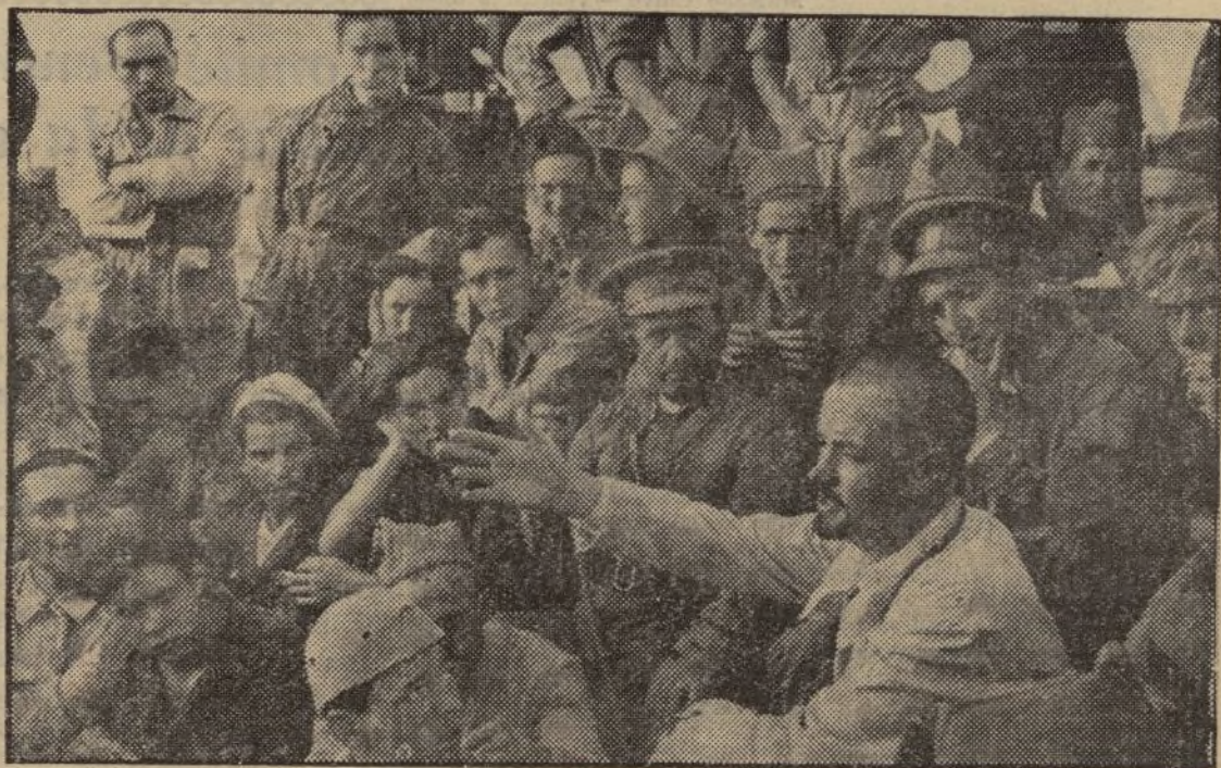
Asamblea de la 2.ª compañía del 5.º batallón de Milicias populares celebrada en Buitrago

—Aquí se vive perfectamente. El clima es magnífico; la comida, buena y abundante. El miliciano percibe, además de la comida y el tabaco, diez pesetas diarias. Reciben socorros del S. R. I. Se da el caso de haber días de ocho o nueve evacuados, casi todos ellos a causa de enfermedades contraídas en otros lugares. El Gobierno ha tenido el acierto de equiparar al soldado con el miliciano, y desde luego está en mejores condiciones que si tuviera que trabajar para mantener a su familia. Muchos de ellos remiten con frecuencia cantidades de dinero para el sostenimiento de sus padres. Los soldados nuestros, en fin, viven en condiciones enormemente superiores a los engañados por el fascismo y que se encuentran forzadamente enfrente de nosotros. Nuestros soldados perciben diez pesetas; los que están con nuestros enemigos no reciben cantidad alguna. Nuestros soldados reciben diariamente nuestra Prensa, y a veces también la del enemigo; los que luchan con el enemigo no saben nada de esto. Tienen