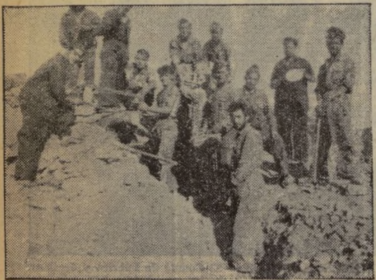
EJERCITO POPULAR. — Nuestras fuerzas en trabajos de fortificación

¡Gloria, compañero Prieto! Has muerto en el frente de batalla, luchando contra el fascismo y por la libertad de España, a la que tanto amabas.