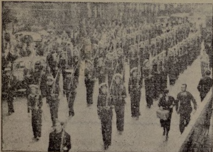
Una formación de marineros españoles. Desfilan arrogantes. Ellos simbolizan el nuevo Ejército del pueblo.