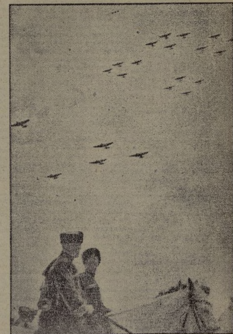
Escuadrillas de aviones, en vuelo transportan a los escuadrones de los "casco rojo" durante las maniobras efectuadas en Minsk (Rusia Blanca)

Las ametralladoras tienen adecuado empleo en la preparación, durante todo el desarrollo y después del ataque. ¡La camarada ametralladora tiene la palabra!