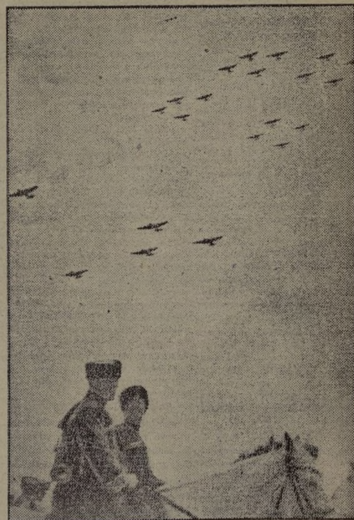
Escuadrillas de aviones en vuelo transportan a los escuadrones de los "cascos rojos" durante las maniobras efectuadas en Minsk (Rusia Blanca)

Las ametralladoras tienen adecuado empleo en la preparación, durante todo el desarrollo y después del ataque. ¡La camarada ametralladora tiene la palabra!