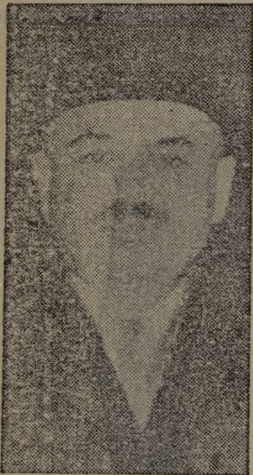
Malsky, embajador de la Unión Soviética en Londres, que tan acertadamente ha desenmascarado la obra criminal del fascismo y la farsa sangrienta de la "no intervención" en los acontecimientos de España.

Se ha advertido en estos últimos días cómo los Estados fascistas se esfuerzan para que continúe la farsa del Comité de no intervención. La bancarrota del imperialismo ha sufrido un gran desengaño con motivo de haberse retirado del pacto de no injerencia la Unión Soviética. Los fascismos alemán e italiano chillan pidiendo explicaciones, como igualmente el representante de la minúscula Portugal, delirando, ha afirmado que Portugal no presta ayuda a los generales rebeldes españoles. He aquí la diplomacia del fascismo internacional. Su mentalidad llega a decir que ellos no han violado el pacto y que sí, por el contrario, luchan por que éste se mantenga.