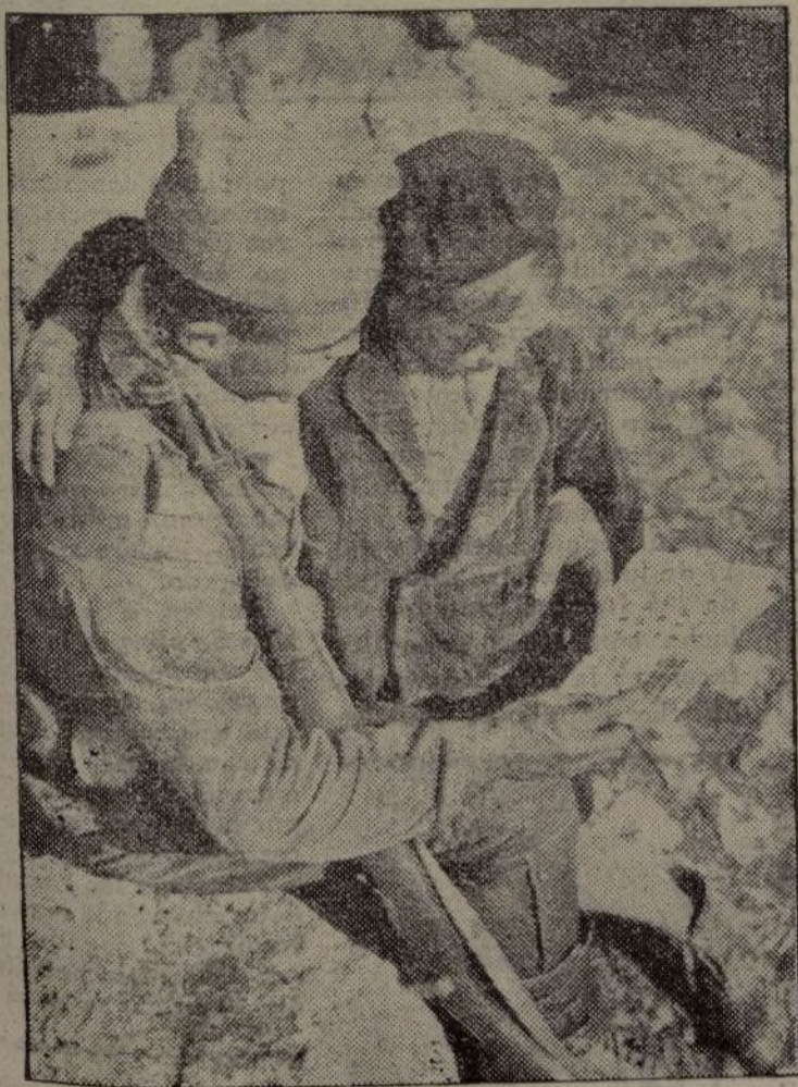
Los hombres que luchan contra el fascismo no les educan en el odio, sólo les dan cultura