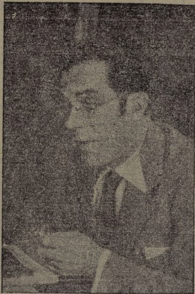
El camarada Jesús Hernández, miembro del Comité Central del Partido Comunista y ministro de Instrucción pública.

El pensamiento único de nuestros combatientes ha de ser éste: Hay que vencer o morir en la lucha. Porque si no se está dispuesto a este sacrificio, lo que vendrá después será la muerte ignominiosa, a manos del verdugo fascista, en el pelotón de ejecución, adonde de seguro conduce la cobardía. Si todos llevan al combate la moral elevada que entreve la victoria, el Ejército del pueblo vencerá. Y se habrá salvado España. La España republicana y antifascista. La España de la libertad y de la democracia. La España republicana y antifascista. La España de la libertad y de la democracia, punto de partida para dar satis-