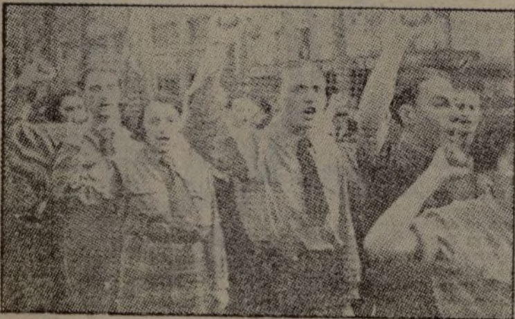
Una manifestación del Frente Popular francés de adhesión a los combatientes españoles