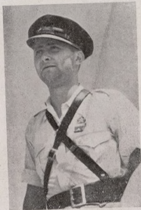
El jefe de la 111 Brigada, gran antifascista, luchador incansable, en el que los soldados tienen depositada toda su confianza y cariño