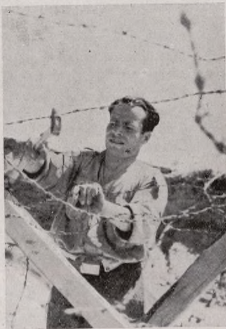
He aquí a nuestros valientes zapadores. Nuevas alambradas impedirán el paso a los fascistas. Ese es el camino. Obstáculos, muchos obstáculos a los ejércitos invasores.