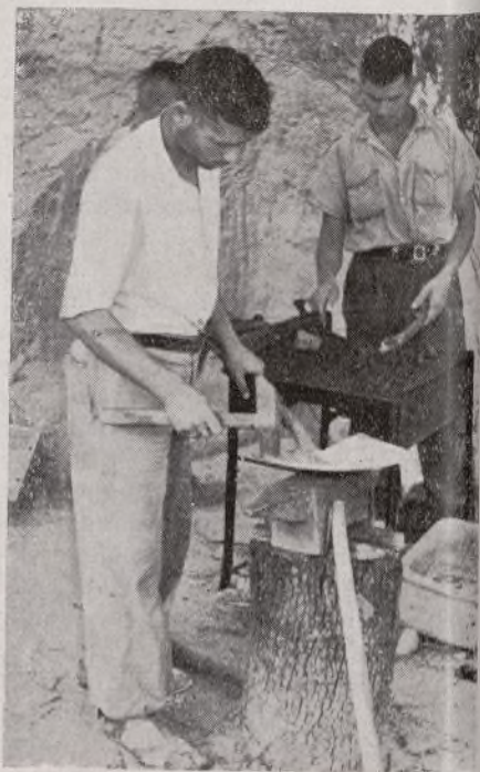
Una herrería instalada en campaña es otro arma más para combatir al enemigo, facilitando los materiales para construir los medios de defensa a nuestros soldados

Es necesario tener todo lo más posible para mejorar las fortificaciones. Uno de los medios que nos proporciona esto es la recuperación. Excelente ejemplo el del 444 Batallón. Ellos han montado una herrería modelo a unos metros de las líneas. Allí arreglan los picos y palas, preparan las vigas, reparan las armas, etcétera, etc. Así también tienen instalada por los mismos medios una carpintería. Ambas trabajan a pleno