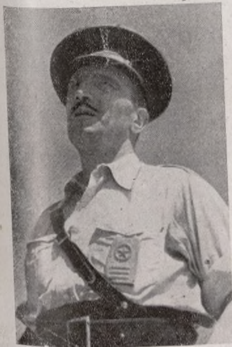
El comisario de la 111 Brigada, agitador infatigable que no conoce un solo momento de descanso en su tarea de mejorar política y culturalmente los soldados de su Unidad

Que las Brigadas de la Octava División sean las mejores unidades, no ya del Ejército del Centro, sino de todo el Ejército Popular, debe ser nuestro mayor anhelo.