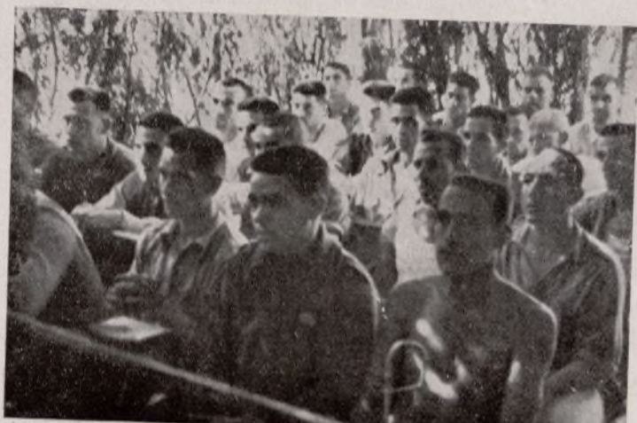
La Escuela de capacitación de delegados, clases y oficiales, instalada en las proximidades de las trincheras. Expresa el deseo de nuestro Ejército de superarse técnicamente

No hay necesidad de cambiar de objetivo para batir refuerzos que avanzan hacia sus guerrillas.