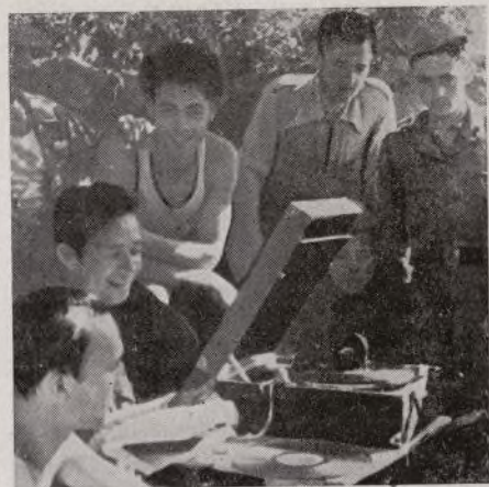
Los soldados en las horas de descanso se deleitan con canciones y músicas populares. Así esperan los bravos luchadores la orden de ataque.

guna misión de responsabilidad, etc. Fuera de ello, nosotros nos distraemos, cantamos canciones, aumentamos con ello nuestro deseo de combatir activamente al fascismo, pasamos de la monotonía del frente inactivo al alegre son de las canciones del gramófono.