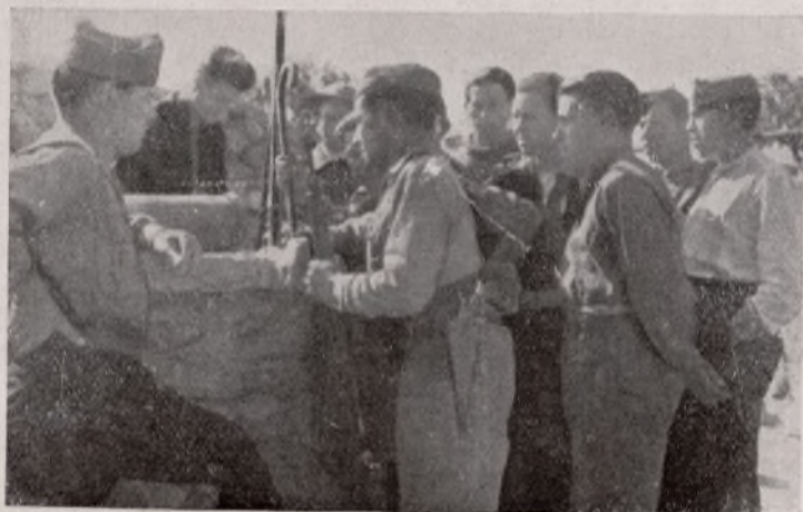
Un grupo de soldados, optimistas y sonrientes, demuestran una gran confianza en nuestra victoria