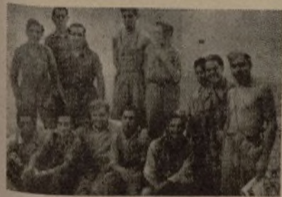
Camaradas de la 1.ª Compañía del 173 Batallón posando ante el fotógrafo de nuestro periódico.

Ante estos ejemplos, continuar manteniendo que el invierno próximo será de escasa importancia y movimiento militar, es un absurdo inadmisibles. El próximo invierno puede ser decisivo para la pelea que sostenemos. Nuestro deber es permanecer en guardia constante; fortificar todas nuestras líneas, construir refugios contra la aviación y la artillería del crimen. Preparándonos, en una palabra, para que el próximo invierno sea una nueva jornada de resistencia y de triunfo para las armas gloriosas del pueblo en lucha.