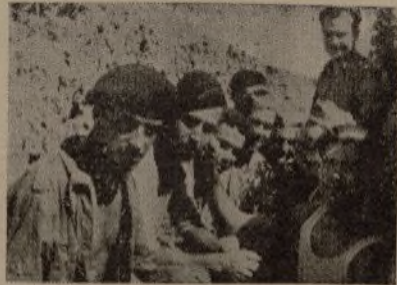
Soldados de la 3.ª Compañía del 175 Batallón sorprendidos en una trinchera por la cámara de Sanz.