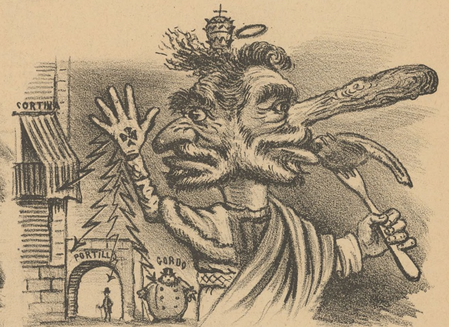
En la Oposición soy Papa y en el Poder una lapa