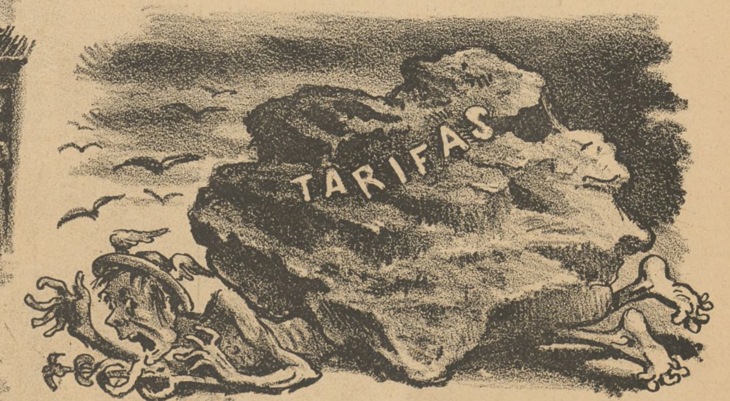
Si tarifas, tarifas.