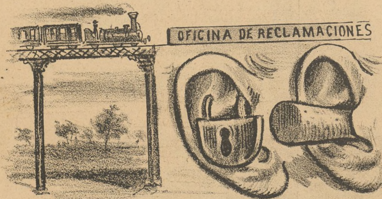
A reclamos gordos oídos sordos.