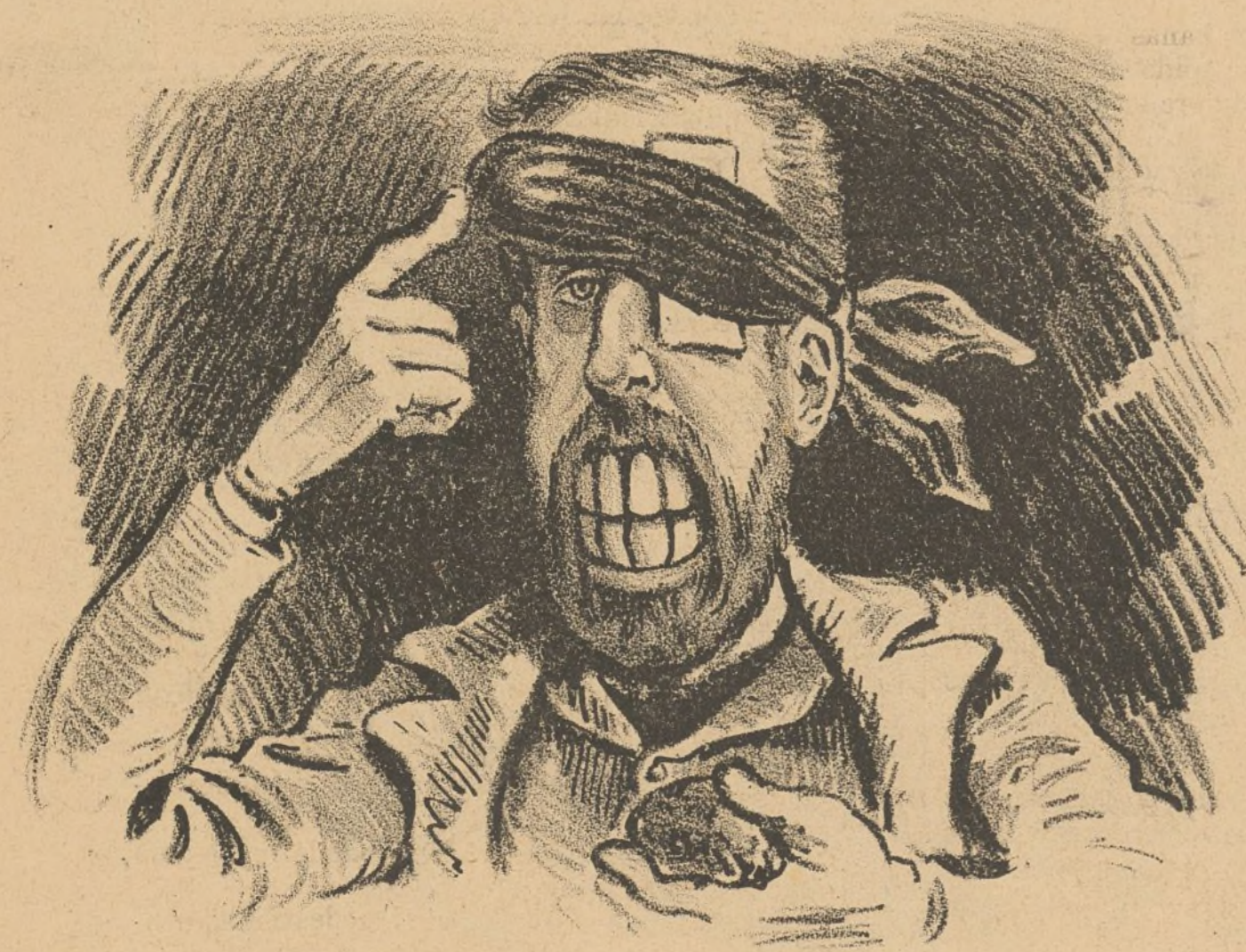
Efectos del discurso de su jefe.