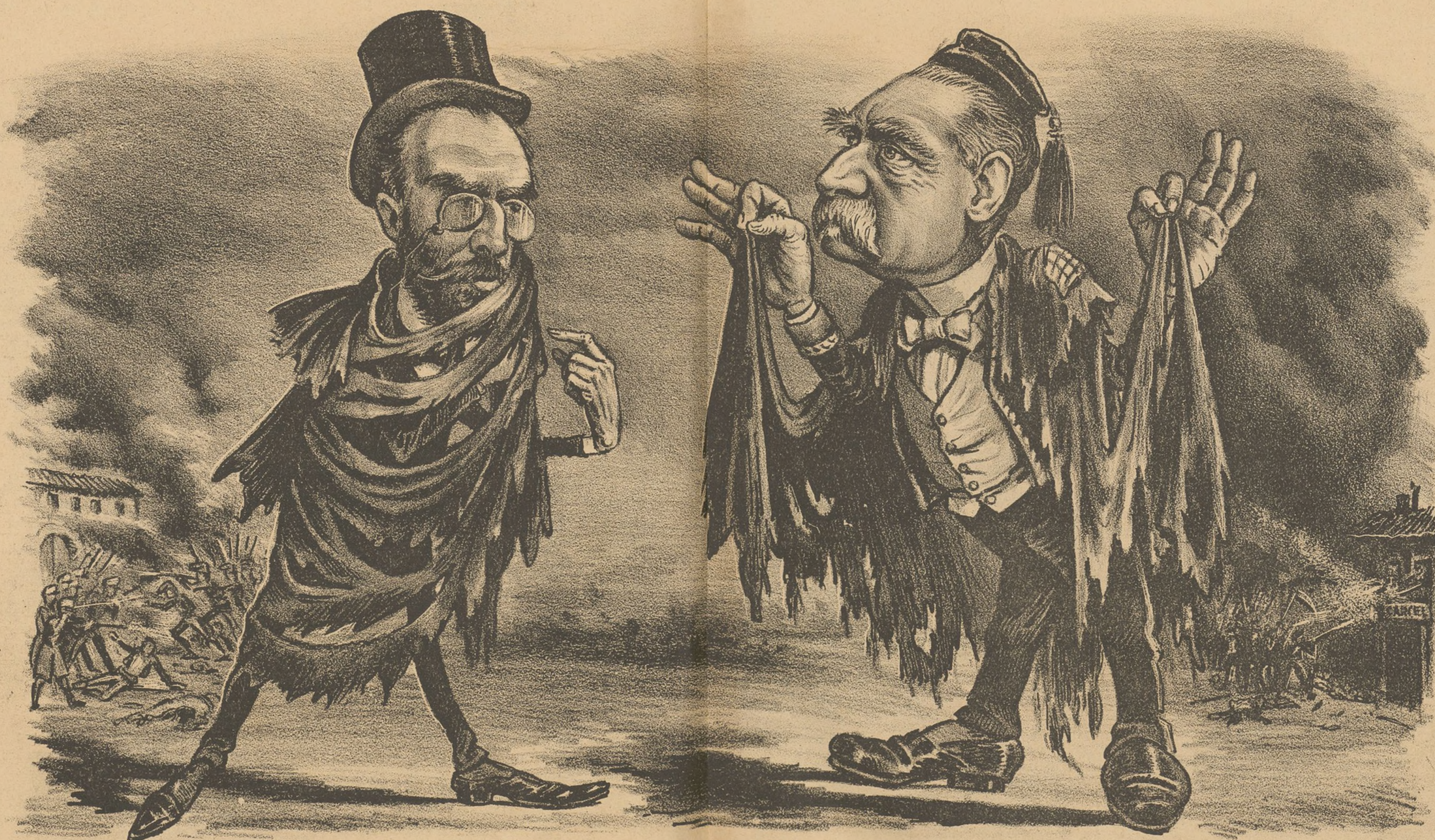
MODAS DEL DÍA—Últimas capas sociales. ¿Que tal voy con mi capa catalana?—Como yo; con mi capa jerezana.