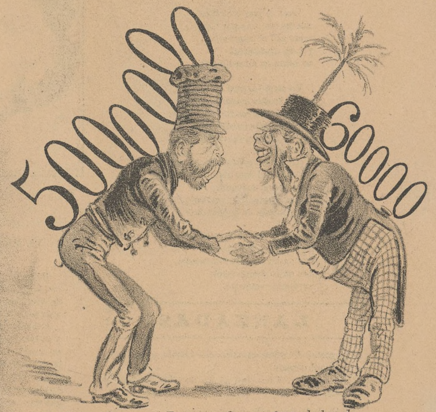
Amigo. Gracias á Dios á las huelgas y jarana Con ninguno de los dos Se meten esta semana.