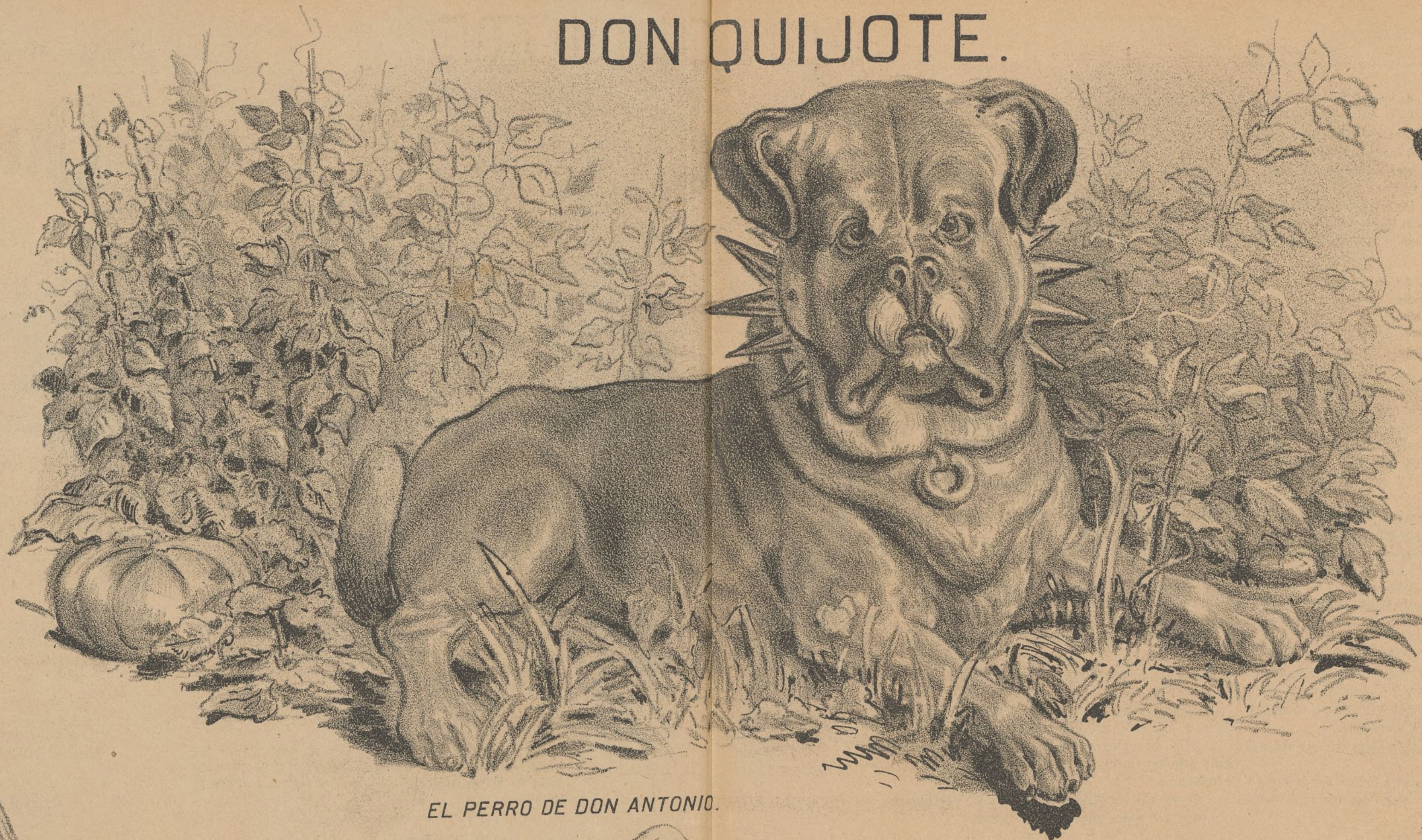
EL PERRO DE DON ANTONIO.