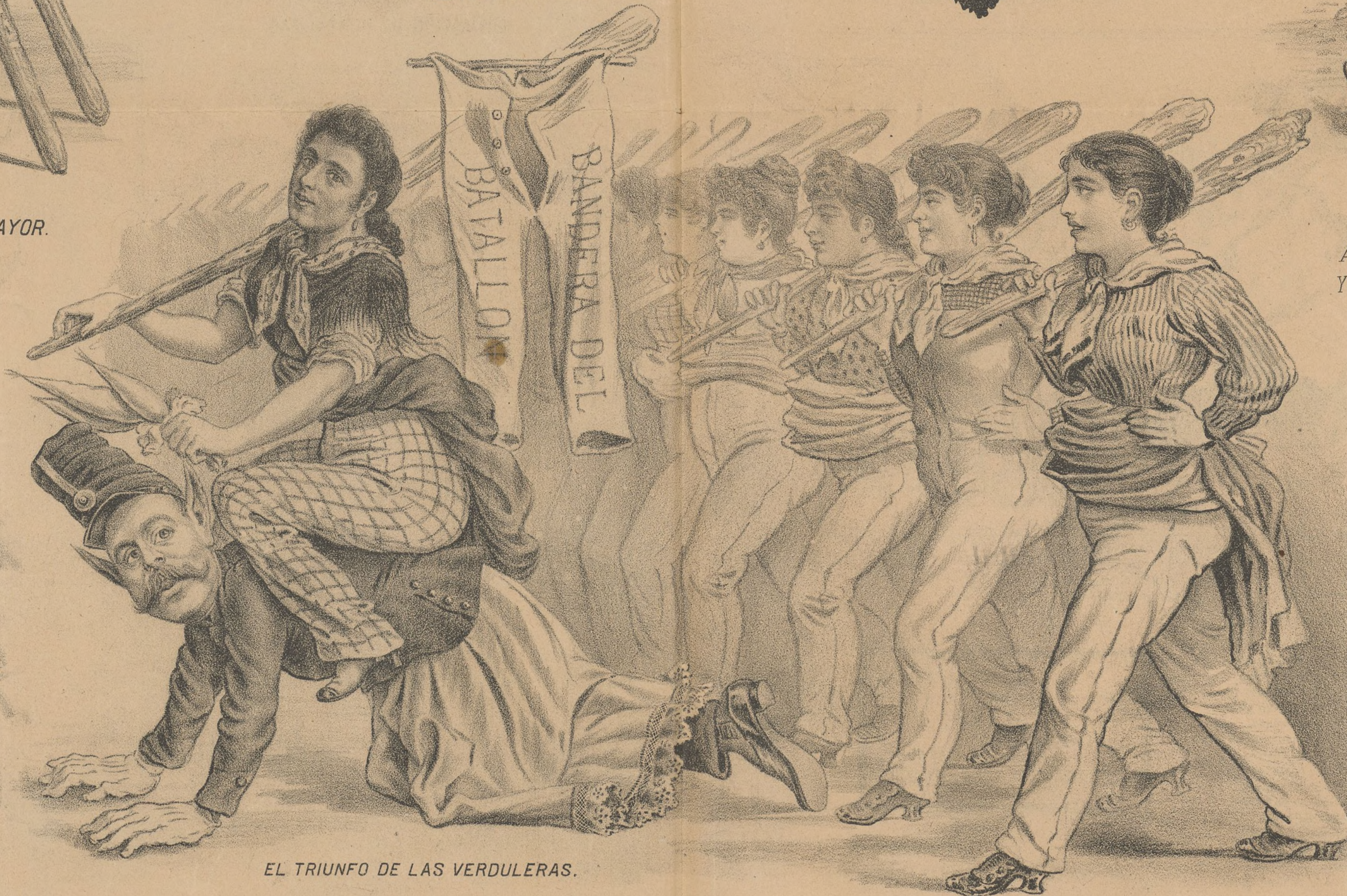
EL TRIUNFO DE LAS VERDULERAS.