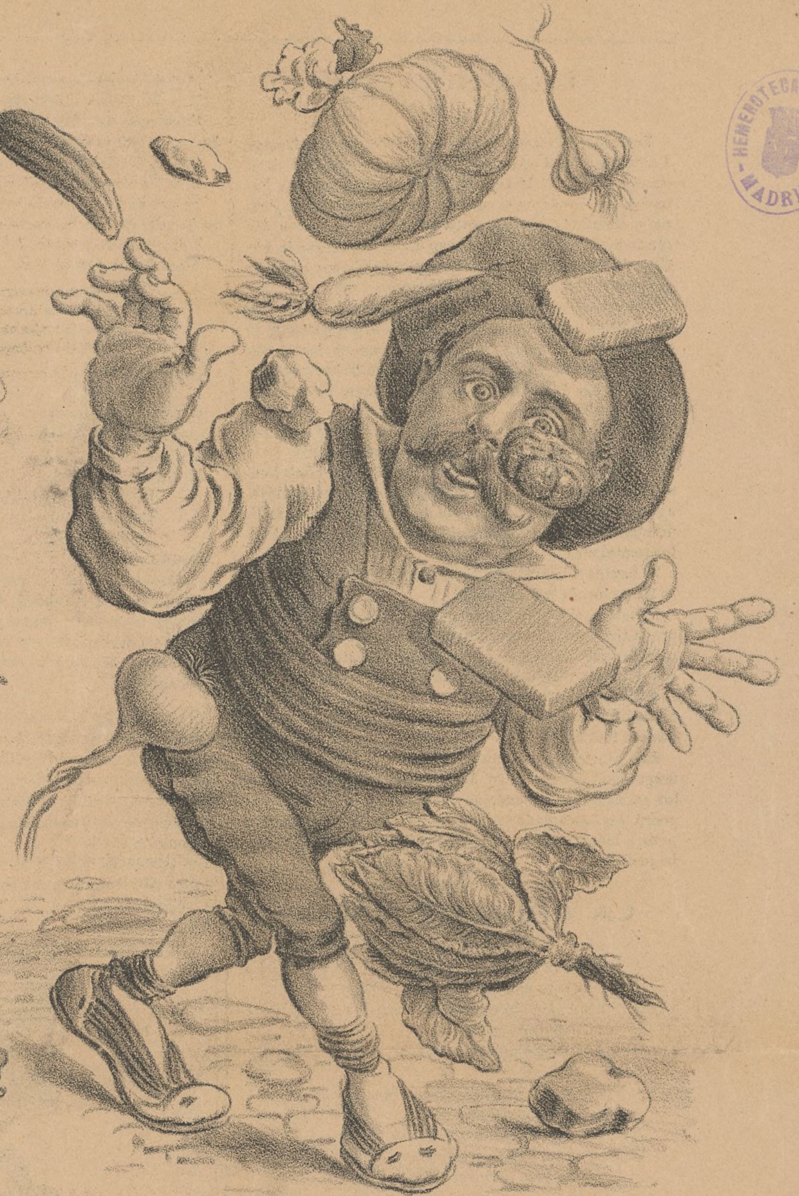
Aunque le tiren tomates y cebollas y pimientos, este alcalde no dimite. Habrá que soltarle el PERRO.