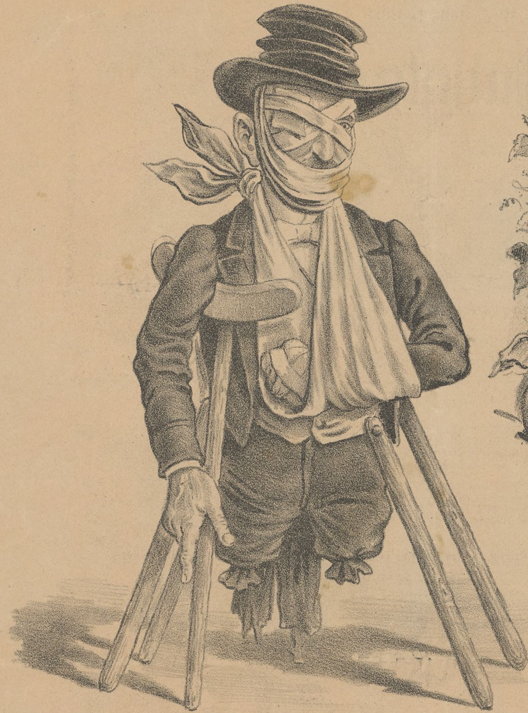
Restos de un Gobernador que recibió en la asonada la paliza preparada para el ALCALDE MAYOR.