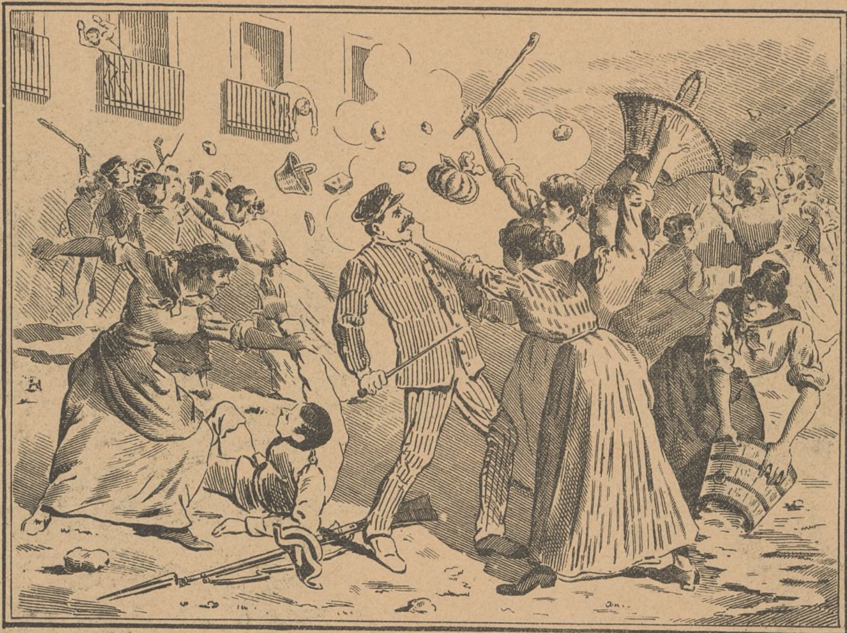
Es copia aqueste motín del que ocurrió en Pontevedra ¡Si Cánovas no se arredra, es porque tiene un mastín!