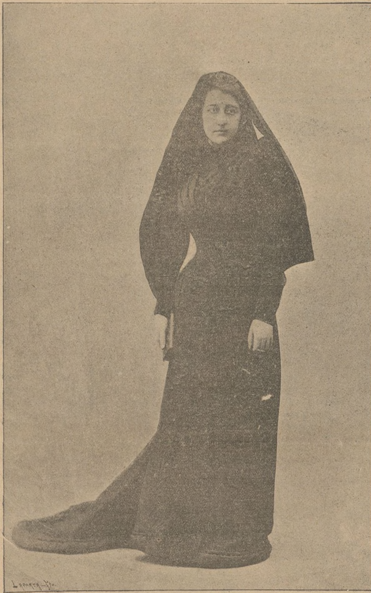
DUQUESA VIUDA DEL DURCAL

¡Buena ración para la sima de Igúzquiza!