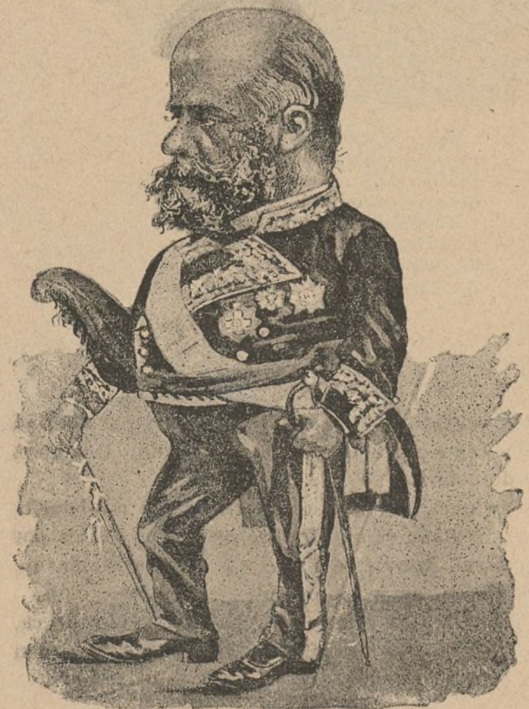
ALBERTO AGUILERA (Música del Himno de Riego.)

La Compañía Trasatlántica ha devuelto ya los cinco millones de pesetas que le anticipó el Tesoro de Ultramar. Don Quijote ha hecho una obstinada campaña en favor de esa devolución. No hay uno solo de nuestros números en que no hayamos hablado de ese asunto. Ninguno de nuestros colegas, ¿por qué no decirlo? nos ha ayudado en esta enojosa empresa. Hemos estado solos y hemos obtenido la victoria, porque la causa que defendíamos era buena y era justa. Repitámoslo: la Compañía Trasatlántica ha devuelto ya los cinco millones de pesetas que le anticipó el Tesoro de Ultramar. ¡La moralidad ha triunfado por esta vez!