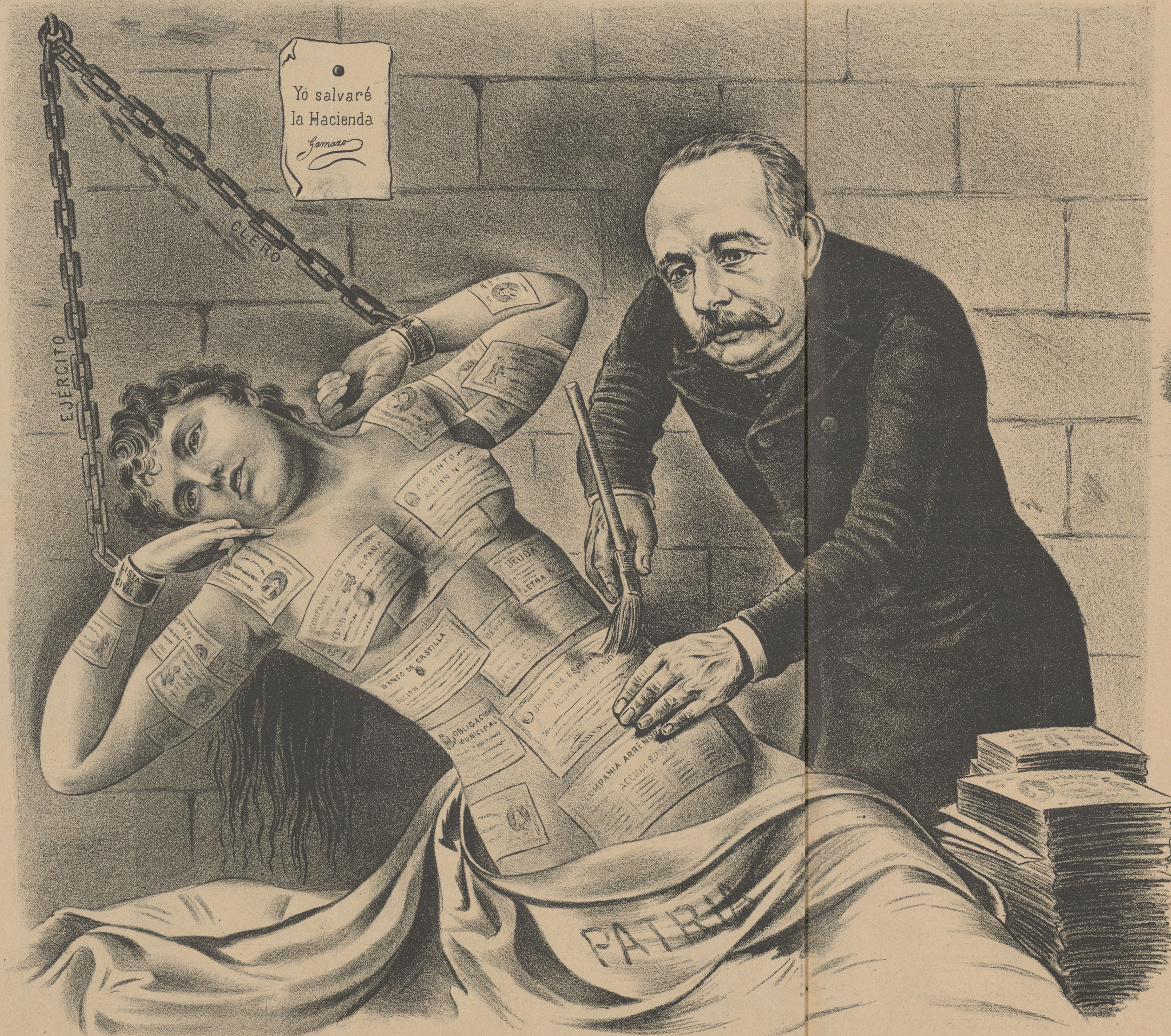
LA PATRIA EMPAPELADA.