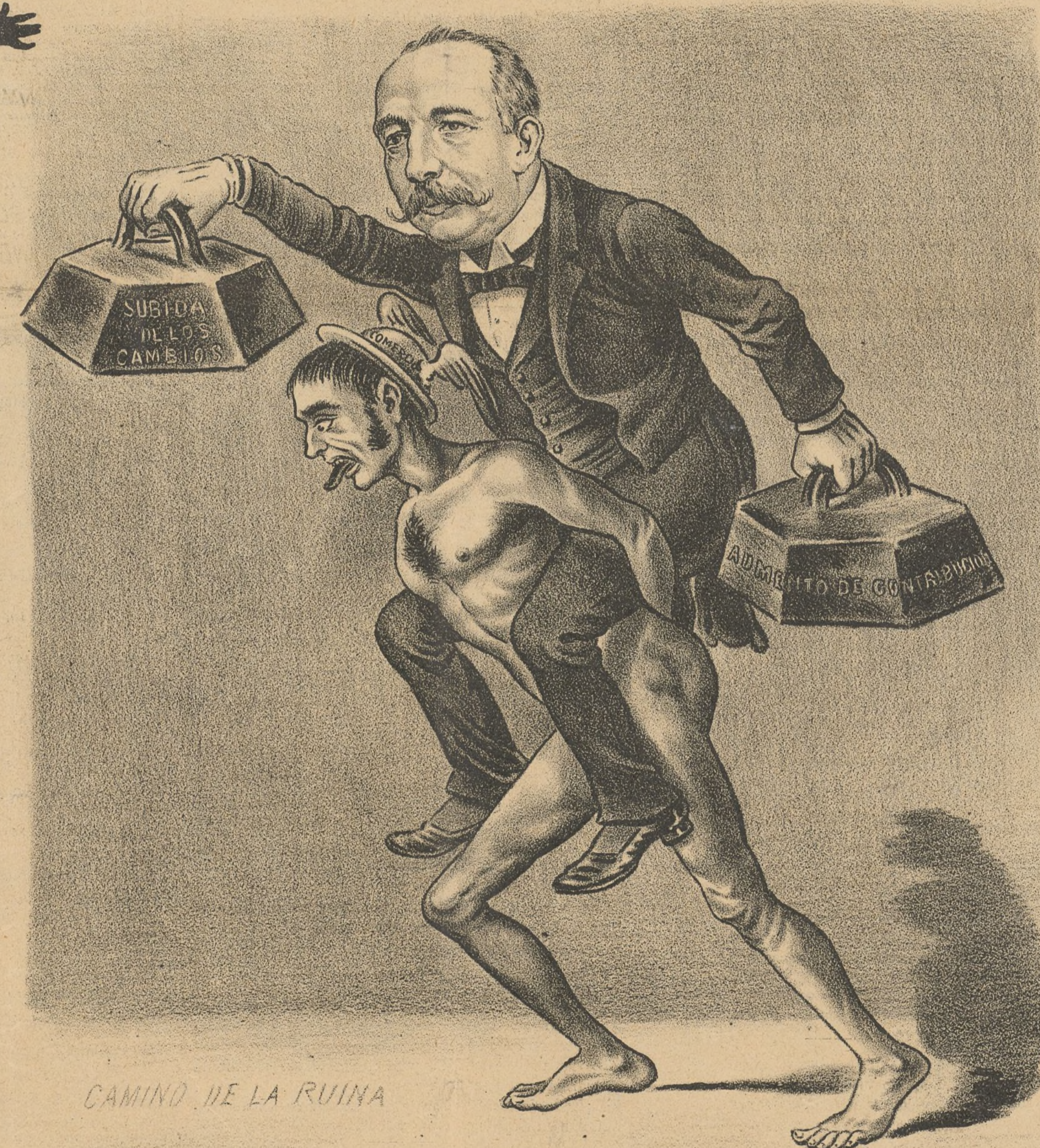
CAMINO DE LA RUINA