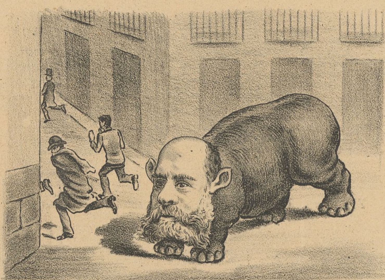
¡Sávese el que pueda - que viene Aguilera.