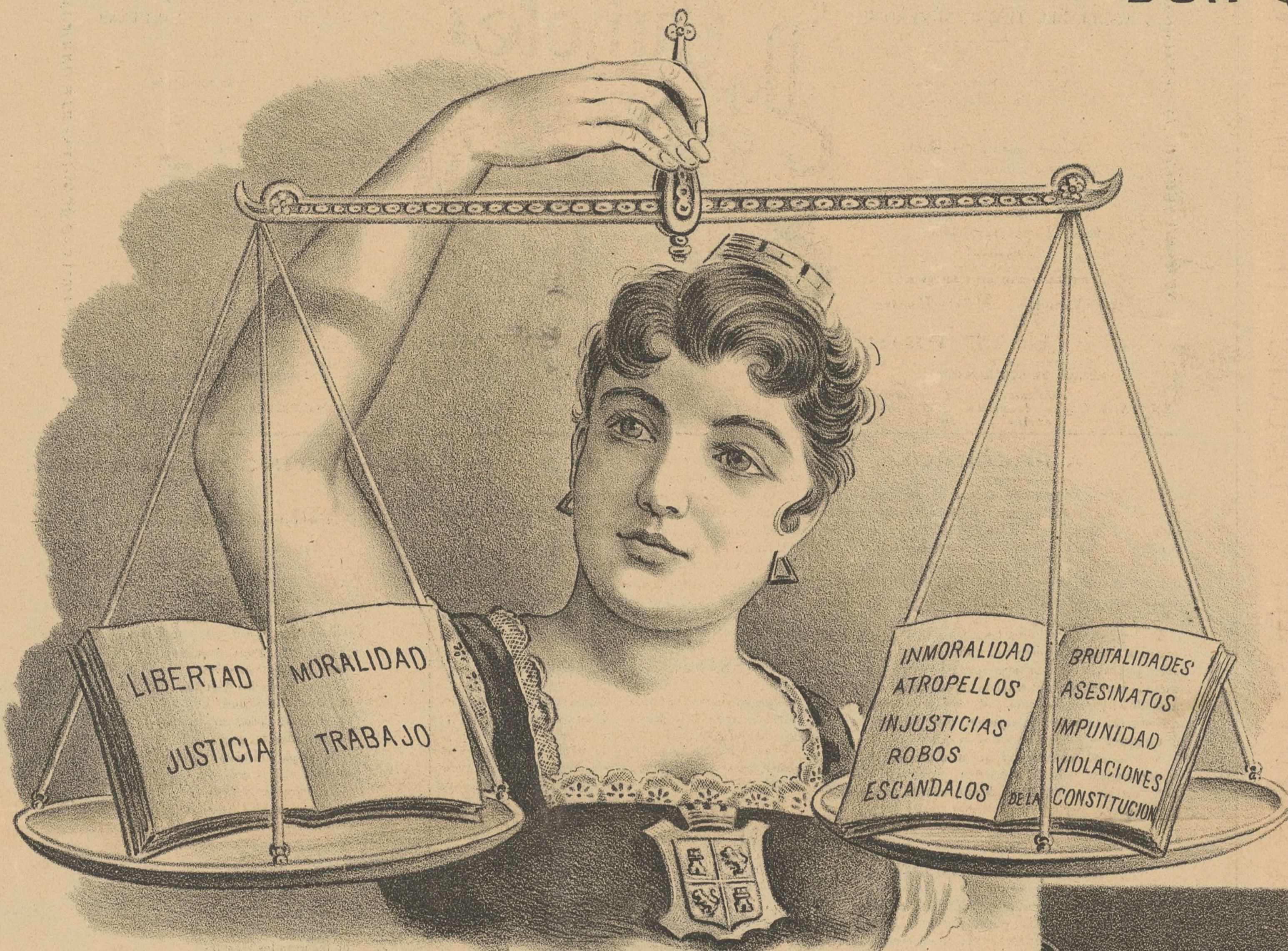
Si no se desnivela la balanza - de salvar la NACIÓN hay esperanza.