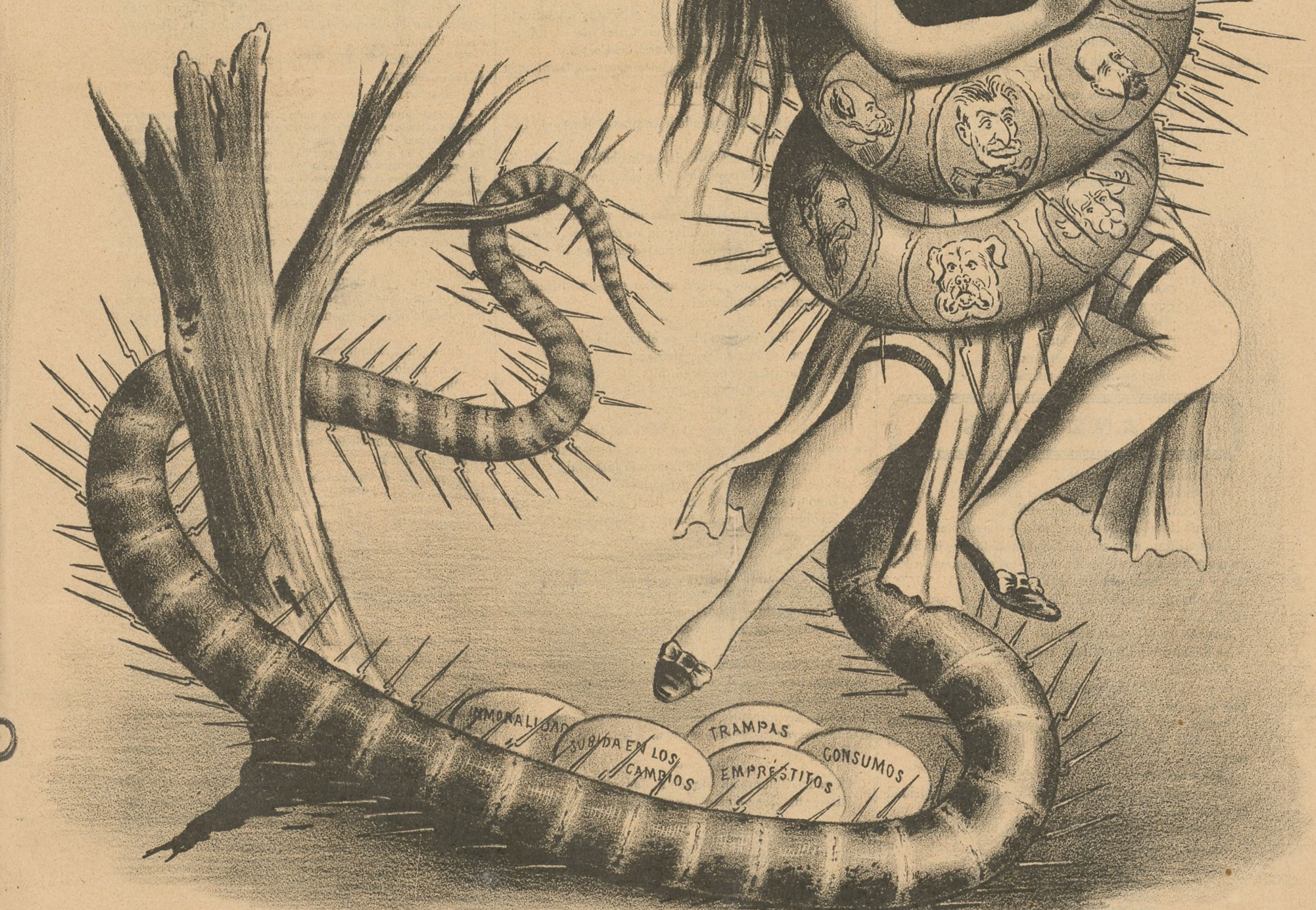
EL SERPENTÓN REACCIONARIO.