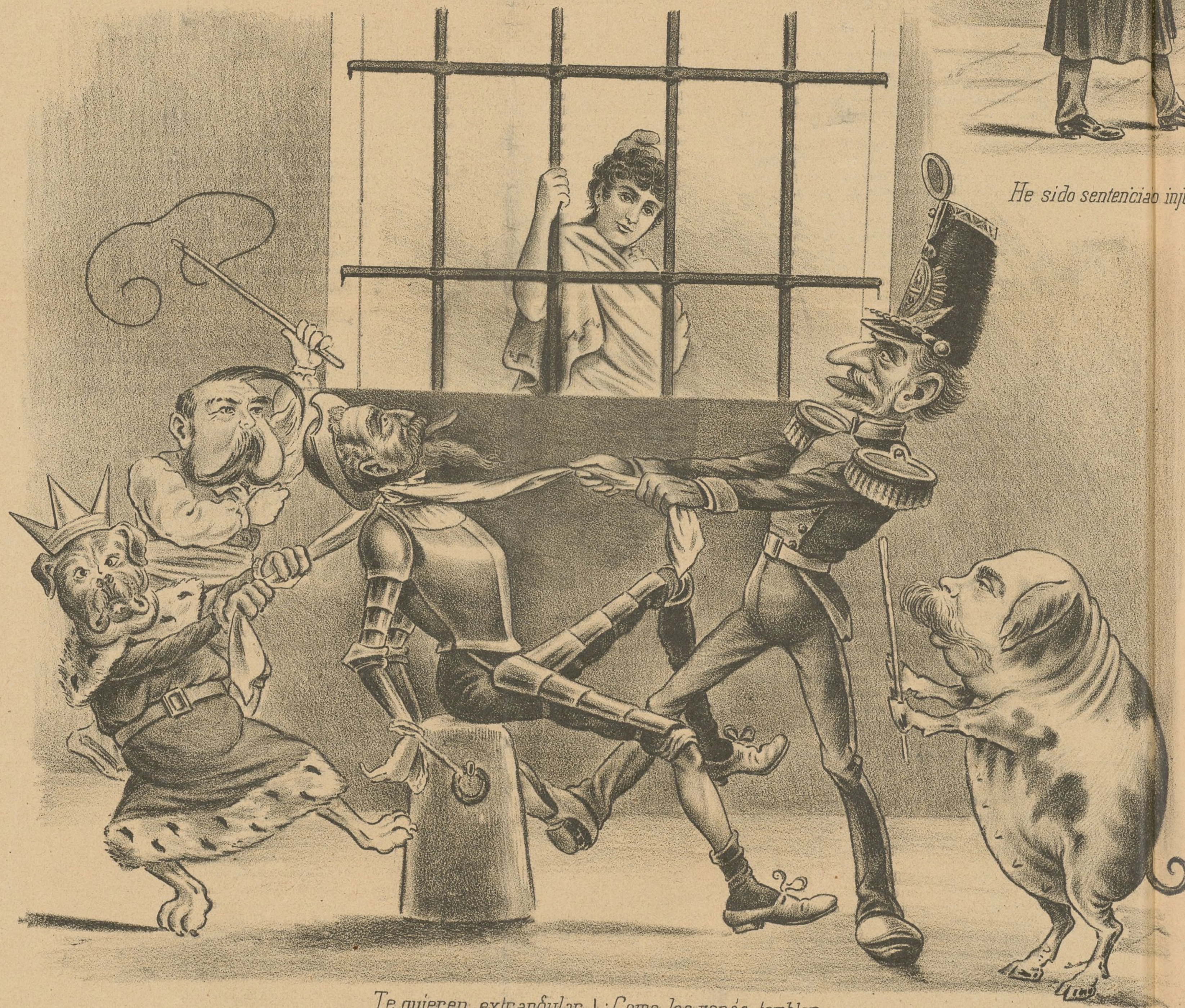
Te quieren extranquilar mas no lo consiguen, nó. ¡ Como los verás temblar en cuanto aparezca yo!