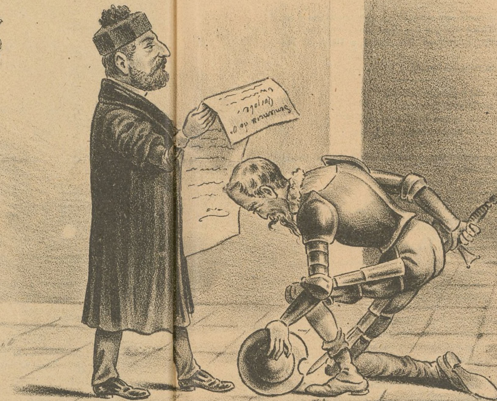
He sido sentenciado injustamente — porque nunca he aludido á la regente.