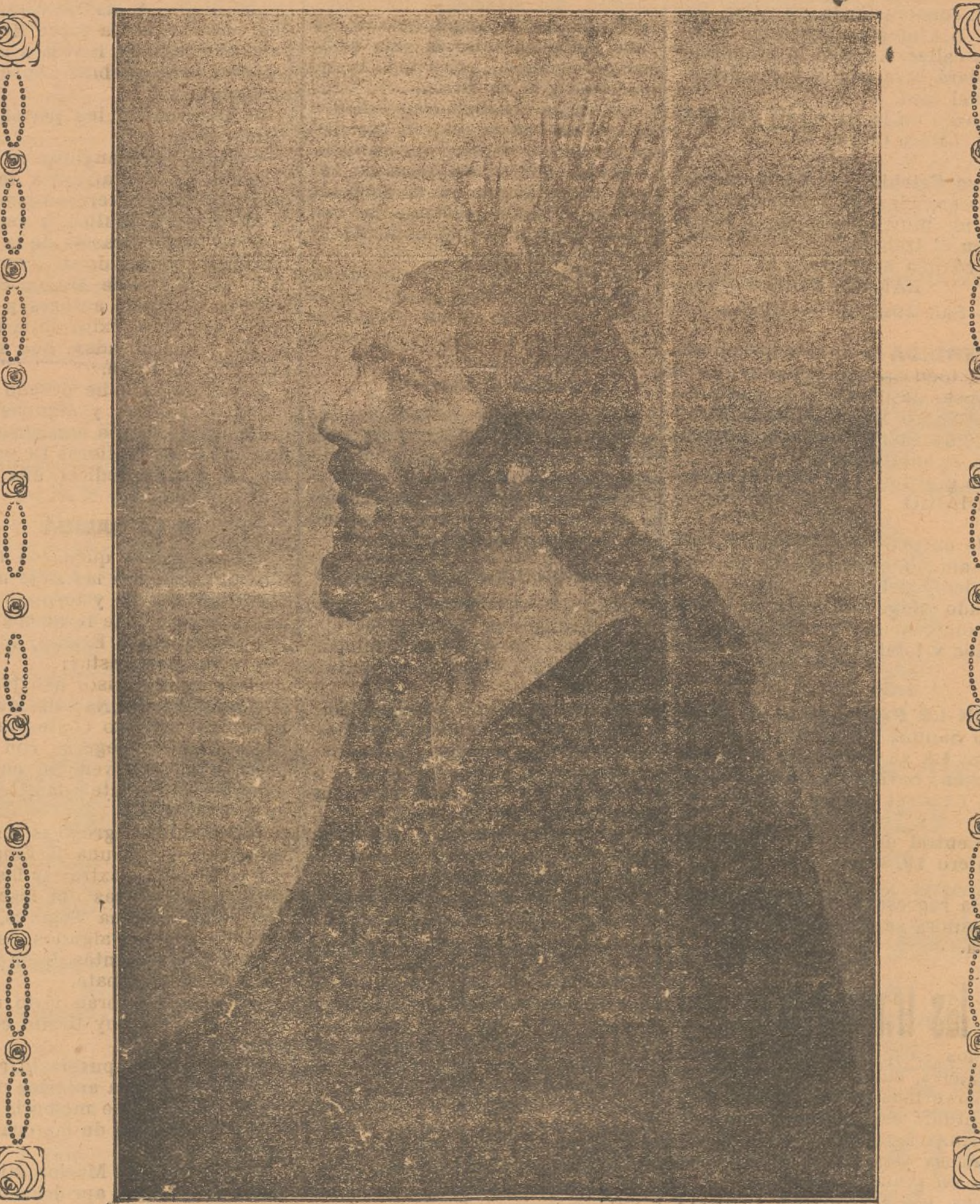
Maravillosa escultura del Señor de la Oración del Huerto, que hace estación esta tarde a las siete, de la Iglesia de la Merced

Hoy domingo de Ramos, comienzan las fiestas religiosas de la Semana Santa, que cada año revisten mayor brillantez.