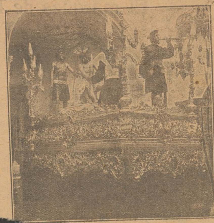
Paso de "Los Judios" que hace estación esta tarde, de la iglesia de la Merced