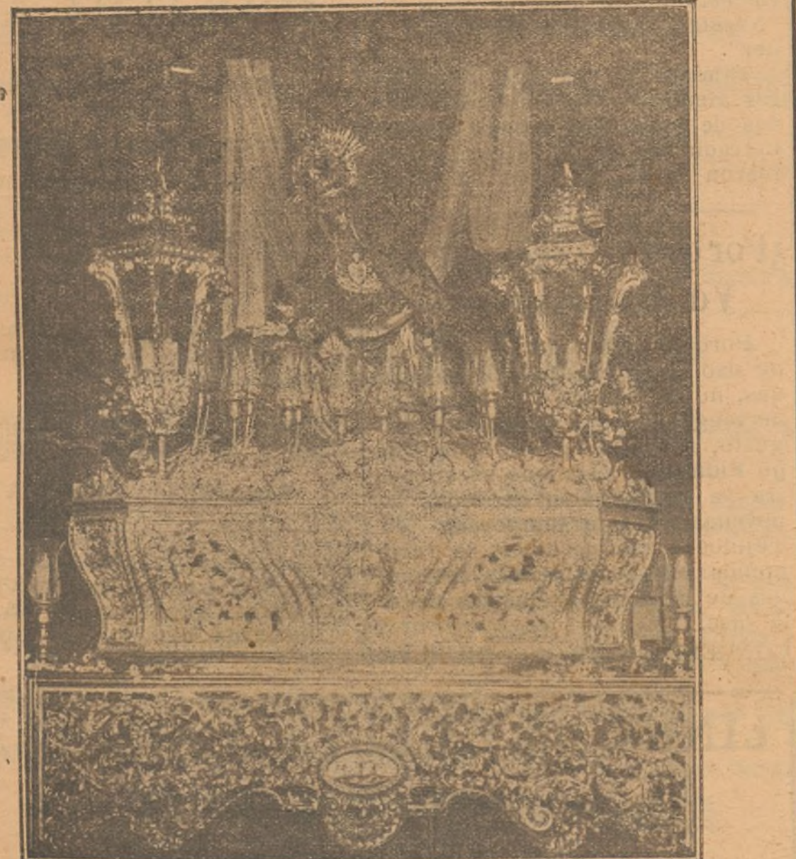
Artístico «paso» de la Virgen de las Angustias que hace estación esta tarde, de San Pedro

SIENDO UNA TRADICIONAL COSTUMBRE, HOY, CON MOTIVO DE LA SOLEMNE FESTIVIDAD DEL DIA, DESCANSARA NUESTRO PERSONAL, Y, POR LO TANTO, MAÑANA NO SE PUBLICARA «DIARIO DE HUELVA»