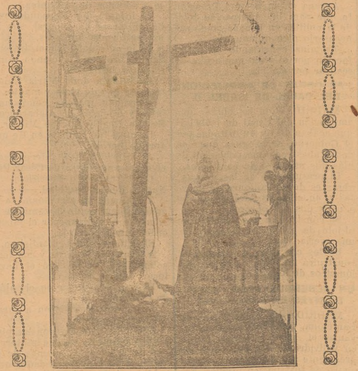
Nuestra Señora de la Consolación en sus Dolores, que sale esta tarde de las Monjas

Por los Santos Varones, acompañados de las Marias. El tercer «paso», presenta a la Santísima Virgen de la Soledad vestida con saya y manto de terciopelo morado con bordados en oro. Los nazarenos visten túnica y capirote negro y capa morada. Asistirá la Banda municipal de