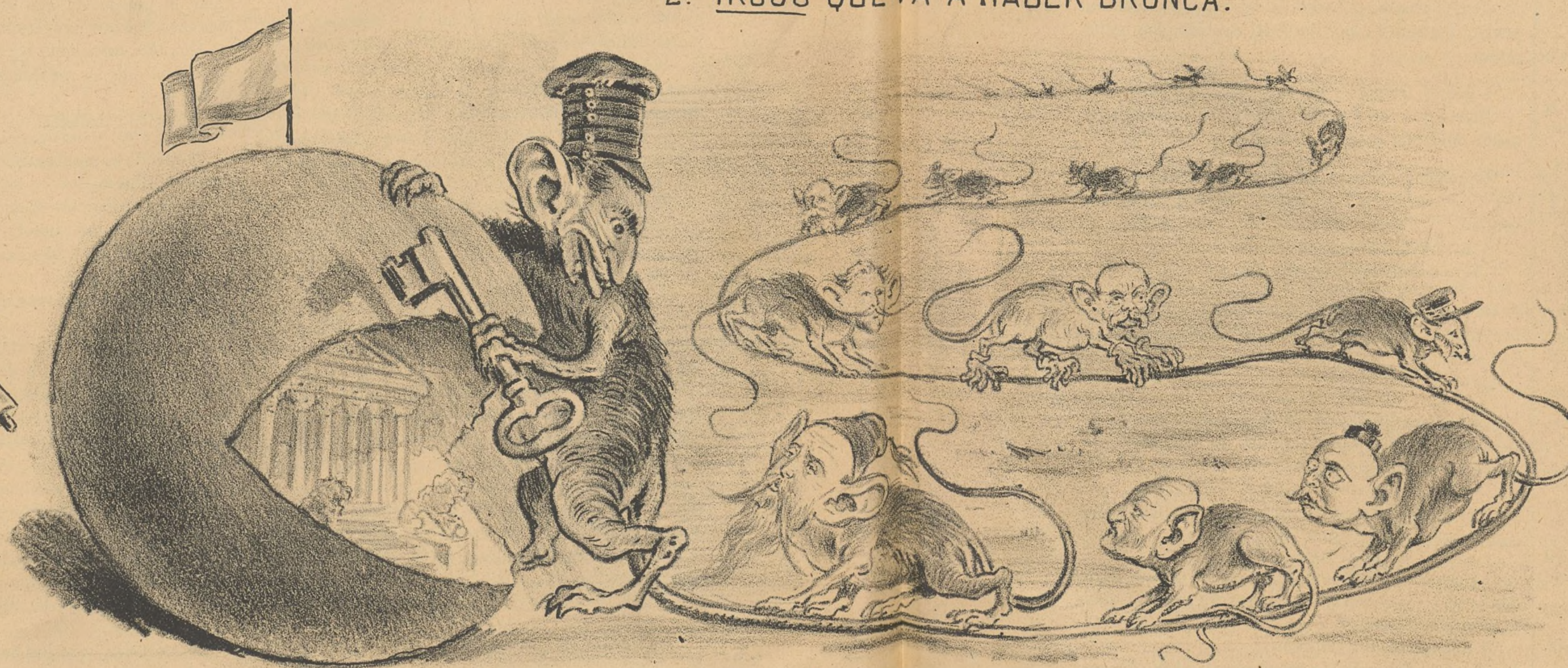
Apertura del queso.