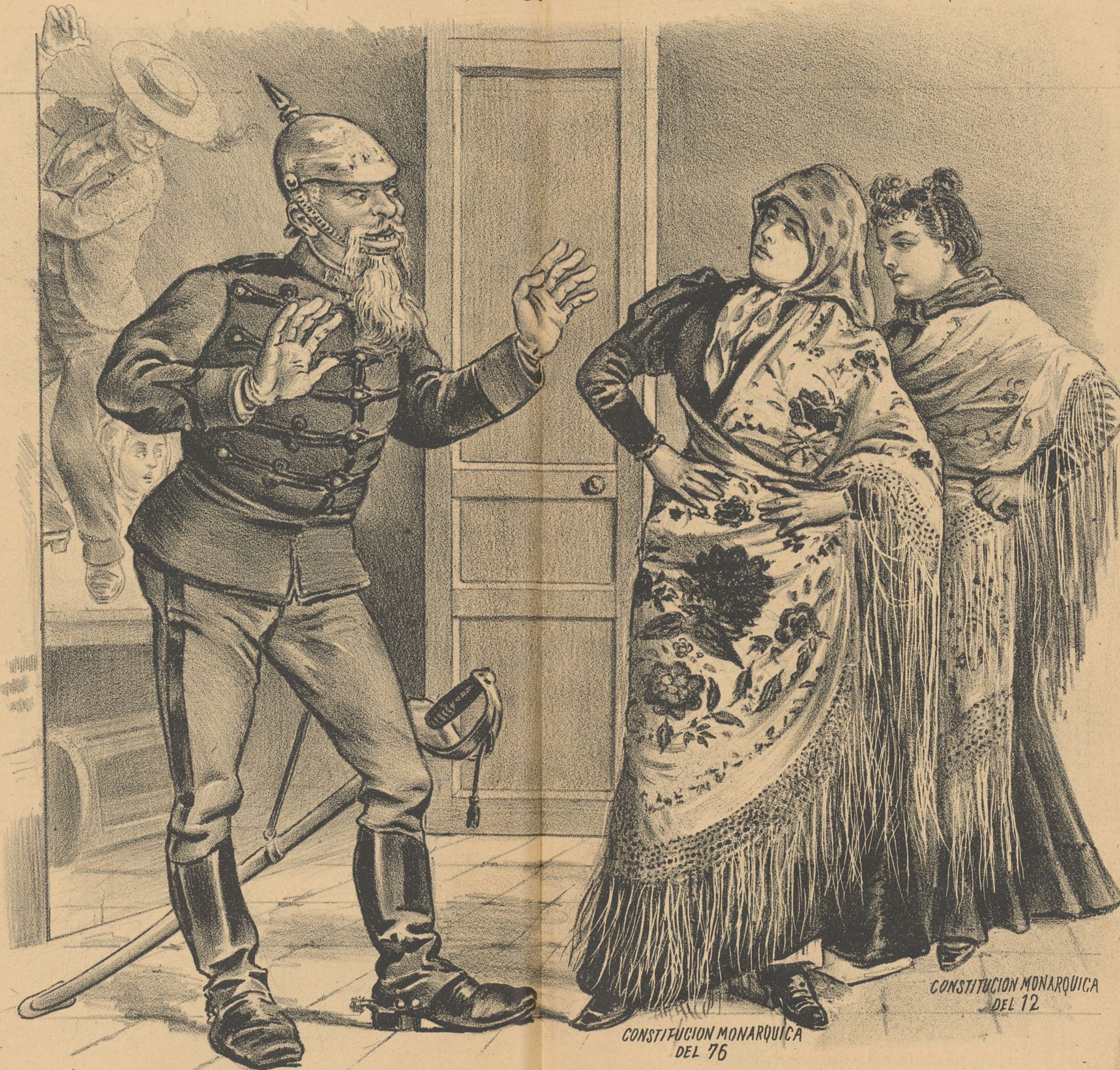
2.-IRSUS QUEVA A HABER BRONCA.