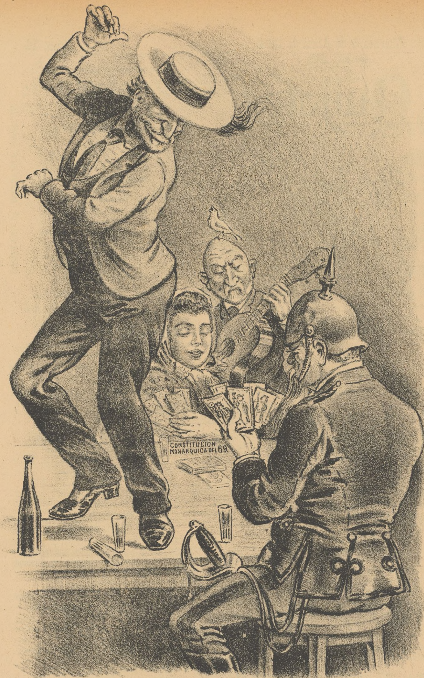
1.-LA JUERGA EN LA TAURINA-