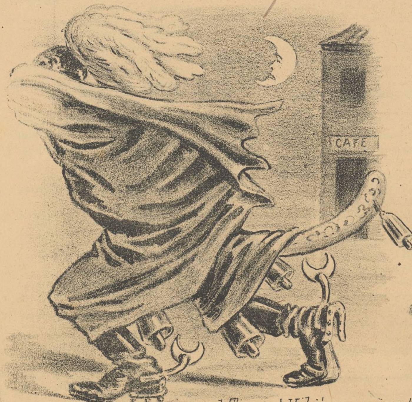
Despues de obsequiar al Tuerto y en la Mamunia al Garnich. Volvió a cencerros tapados el General Maniqui.