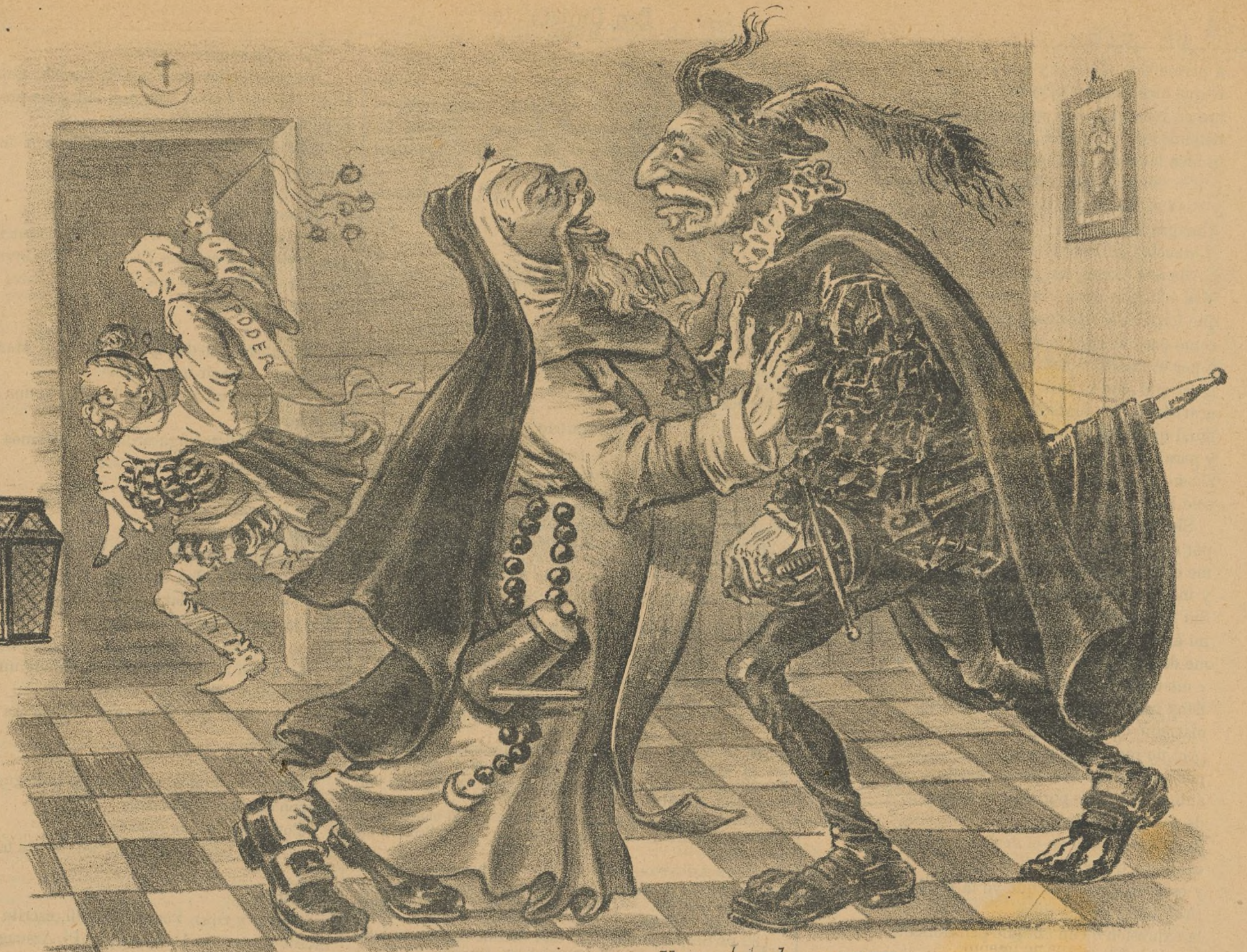
- ¿Donde vas? comendador. | que lleva á todo correr - ¡Inbécil...! Tras el PODER | el monstruo conservador