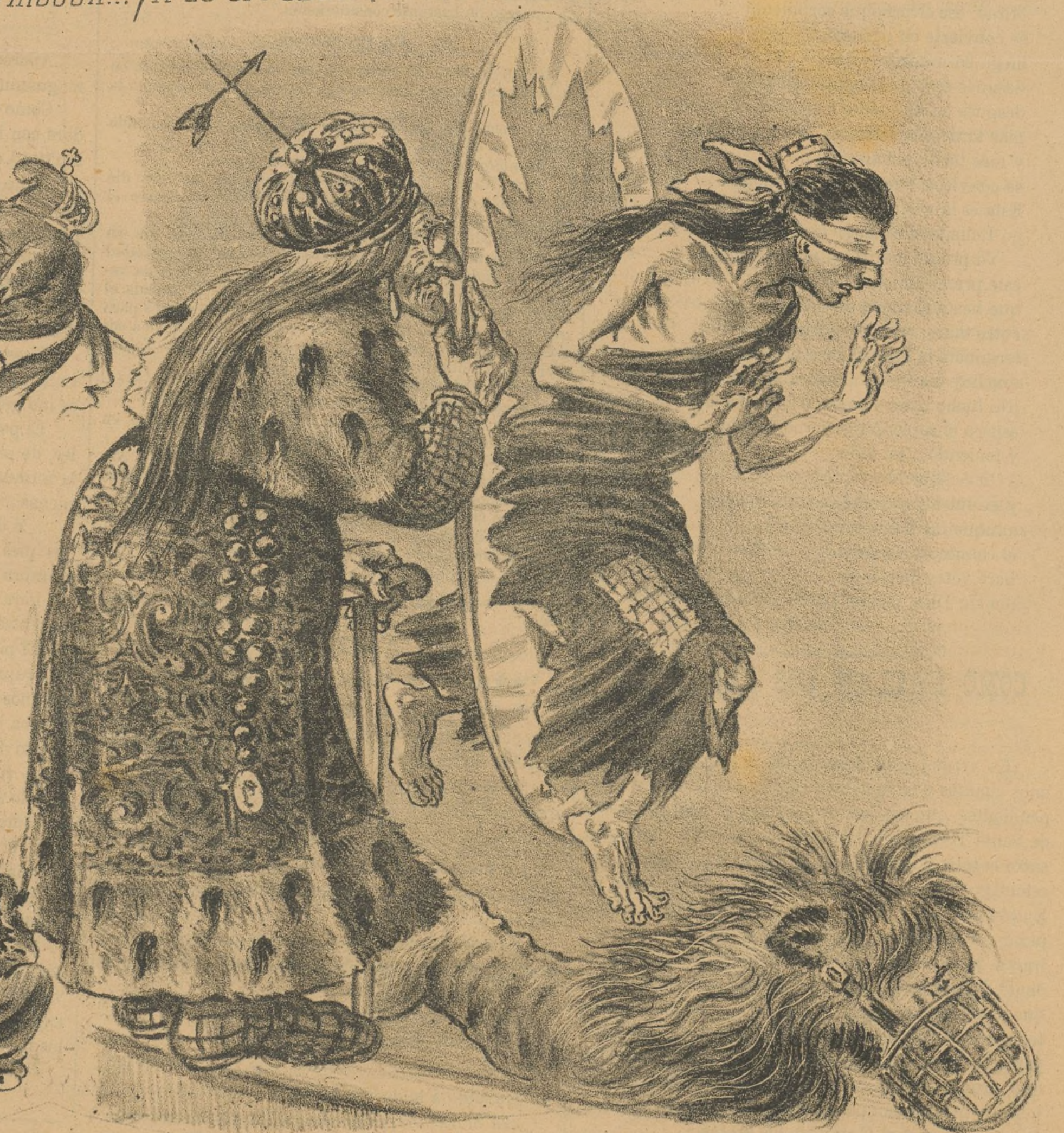
El salto... del ridiculo.