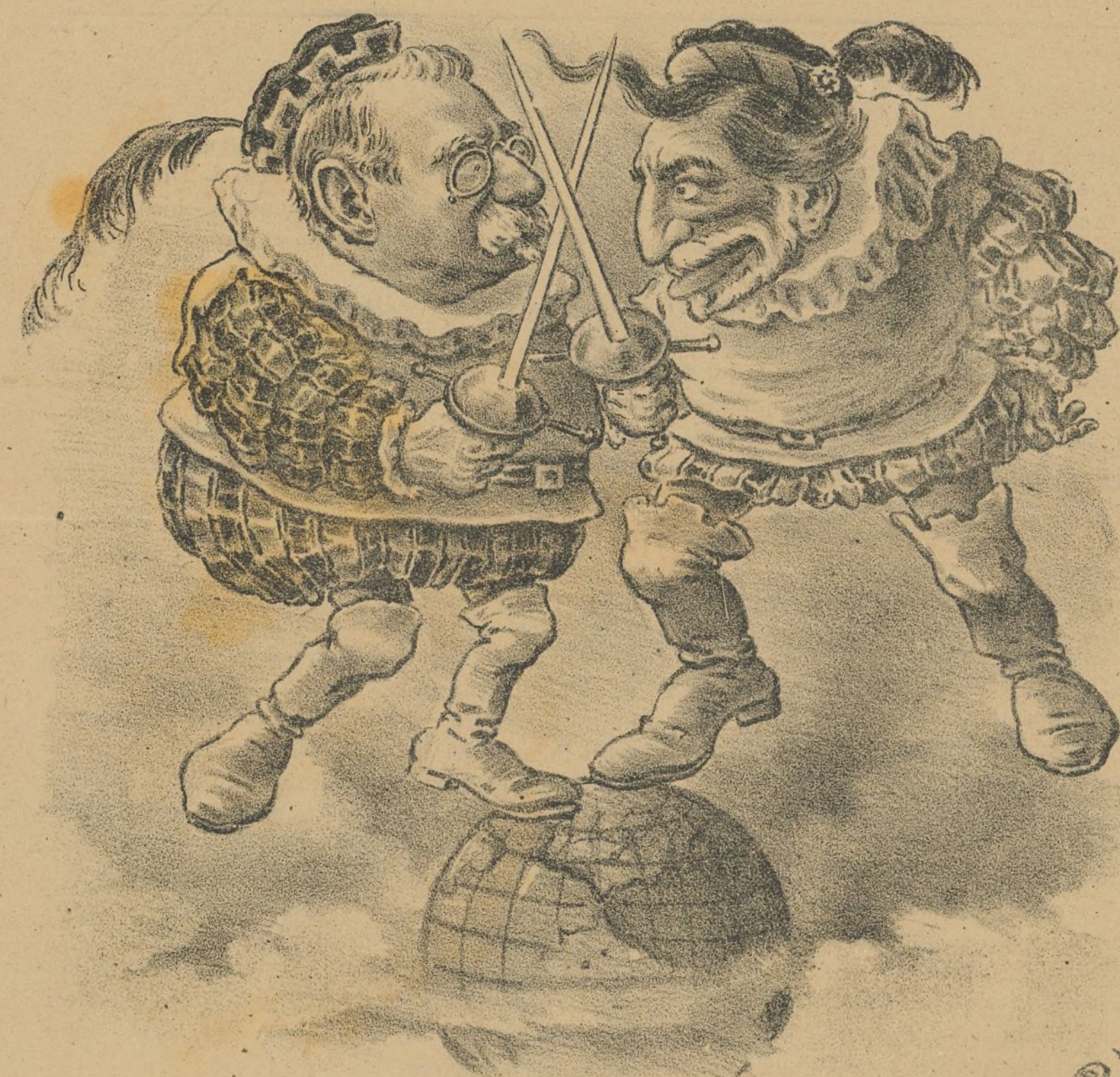
- Los dos no cabemos ya en la tierra.