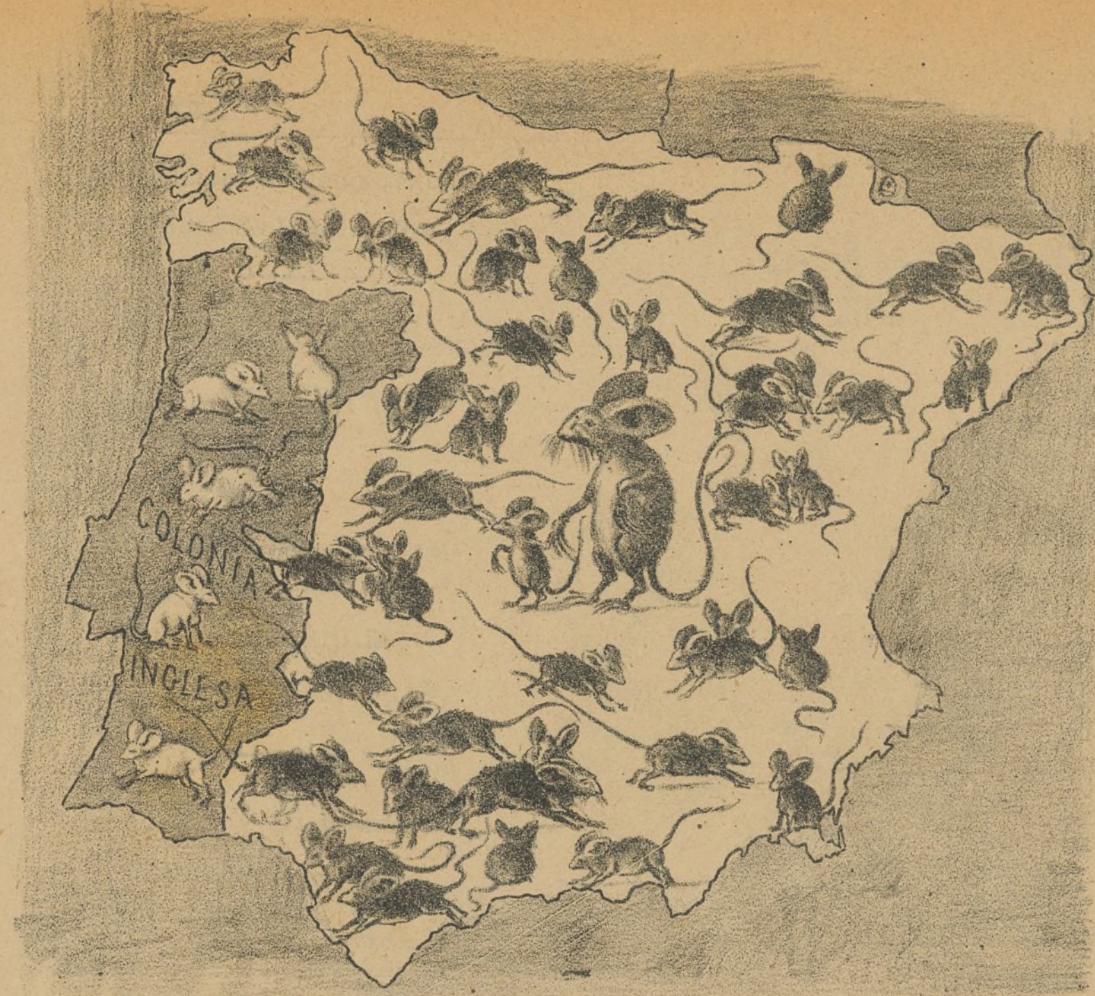
Un nido de ratas.