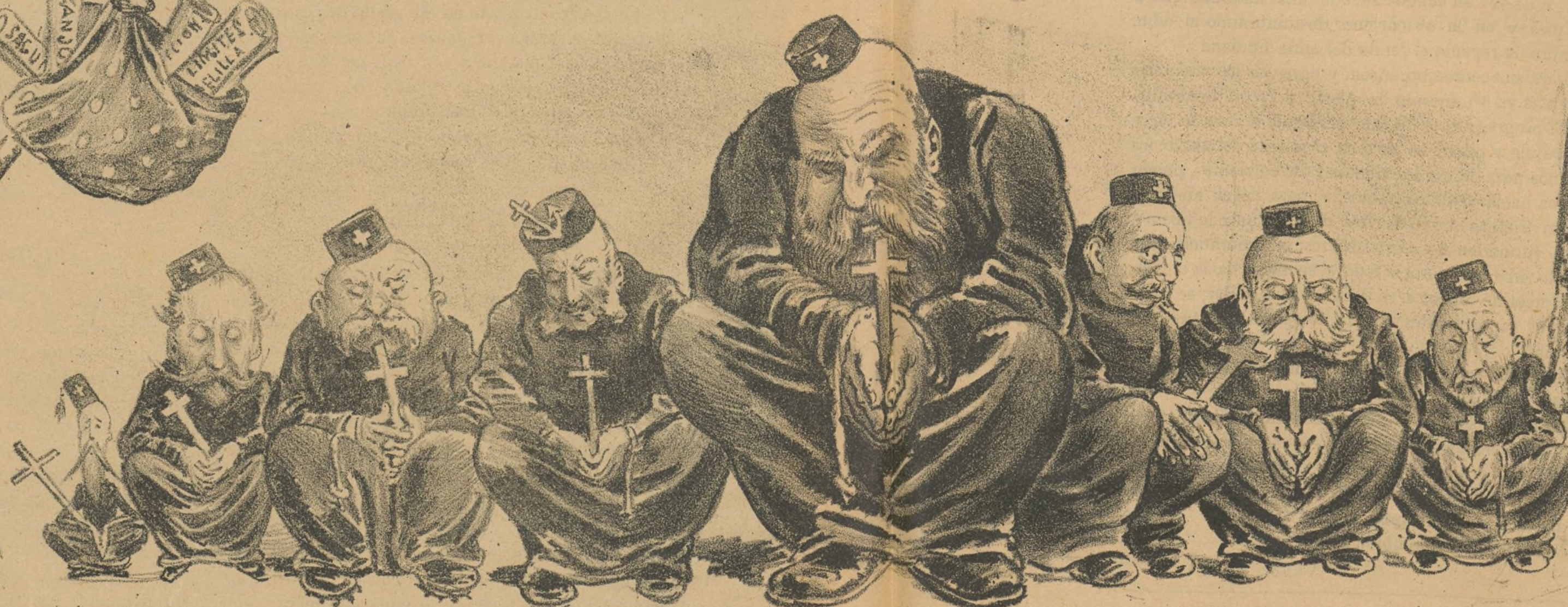
Una salve por los reos que están en capilla.