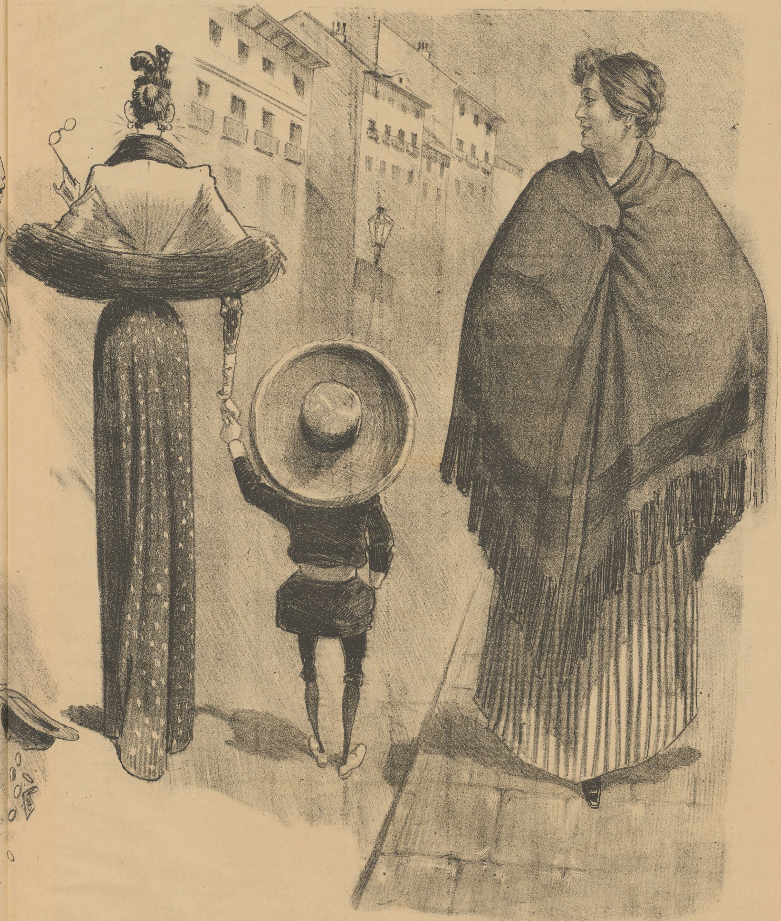
¡A cualquier cosa llaman pan de Viena en esta tierra!