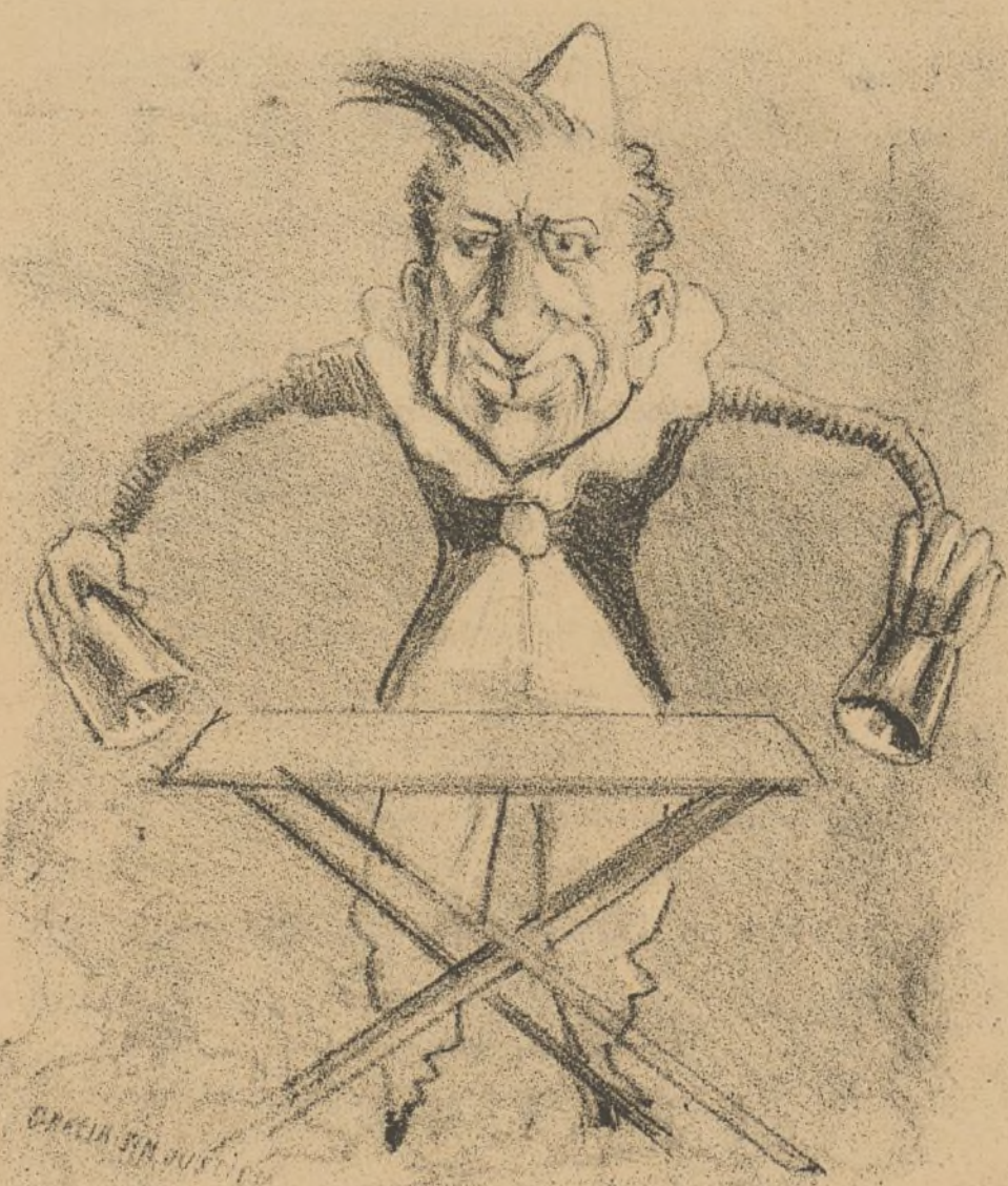
¿Han visto ustedes la Cámara única? ¡Pues ya no la ven!