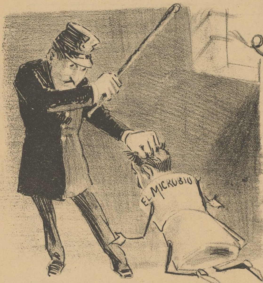
Como tratan en las de provincias.