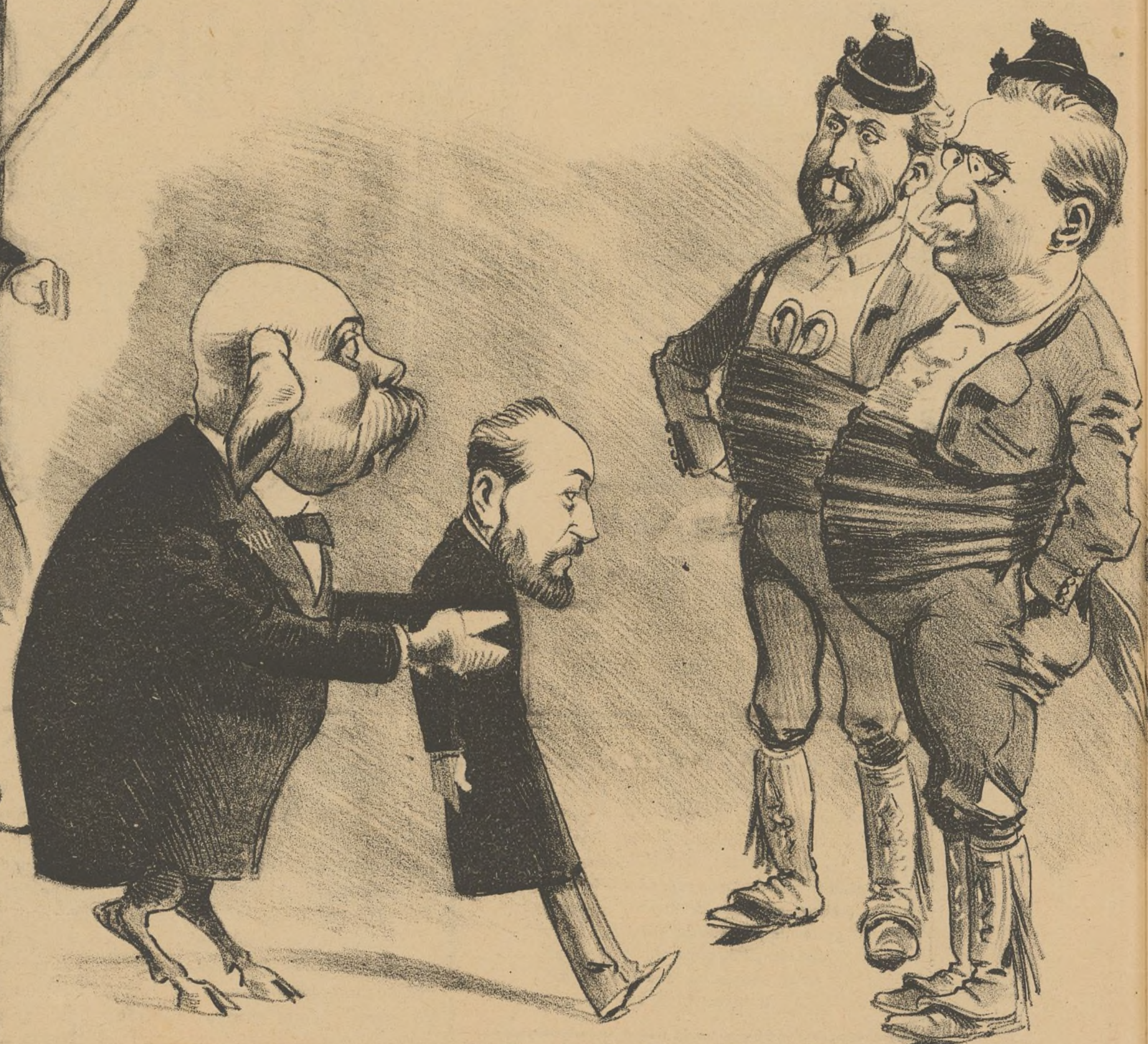
Ahi lo teneis. Es sangre de mi sangre. El hará lo que vosotros querais..... ¡Pero no lo maltrateis!