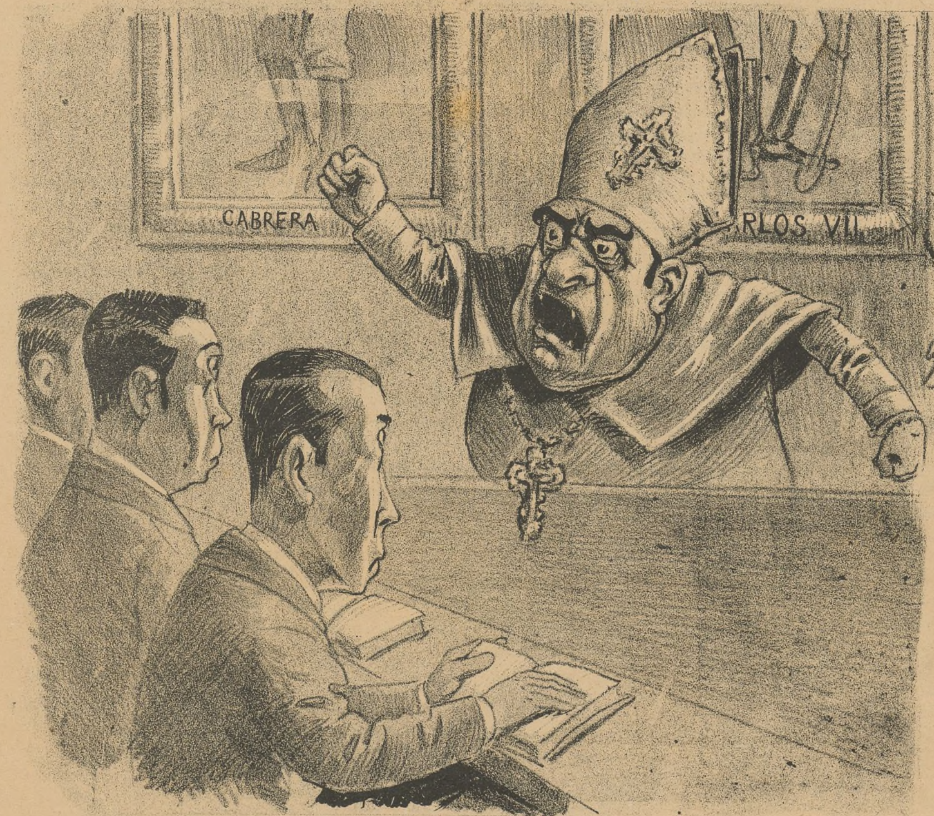
Cátedra de religion en los institutos. Mueran los perros liberales! VIVA CARLOS CHAPA!