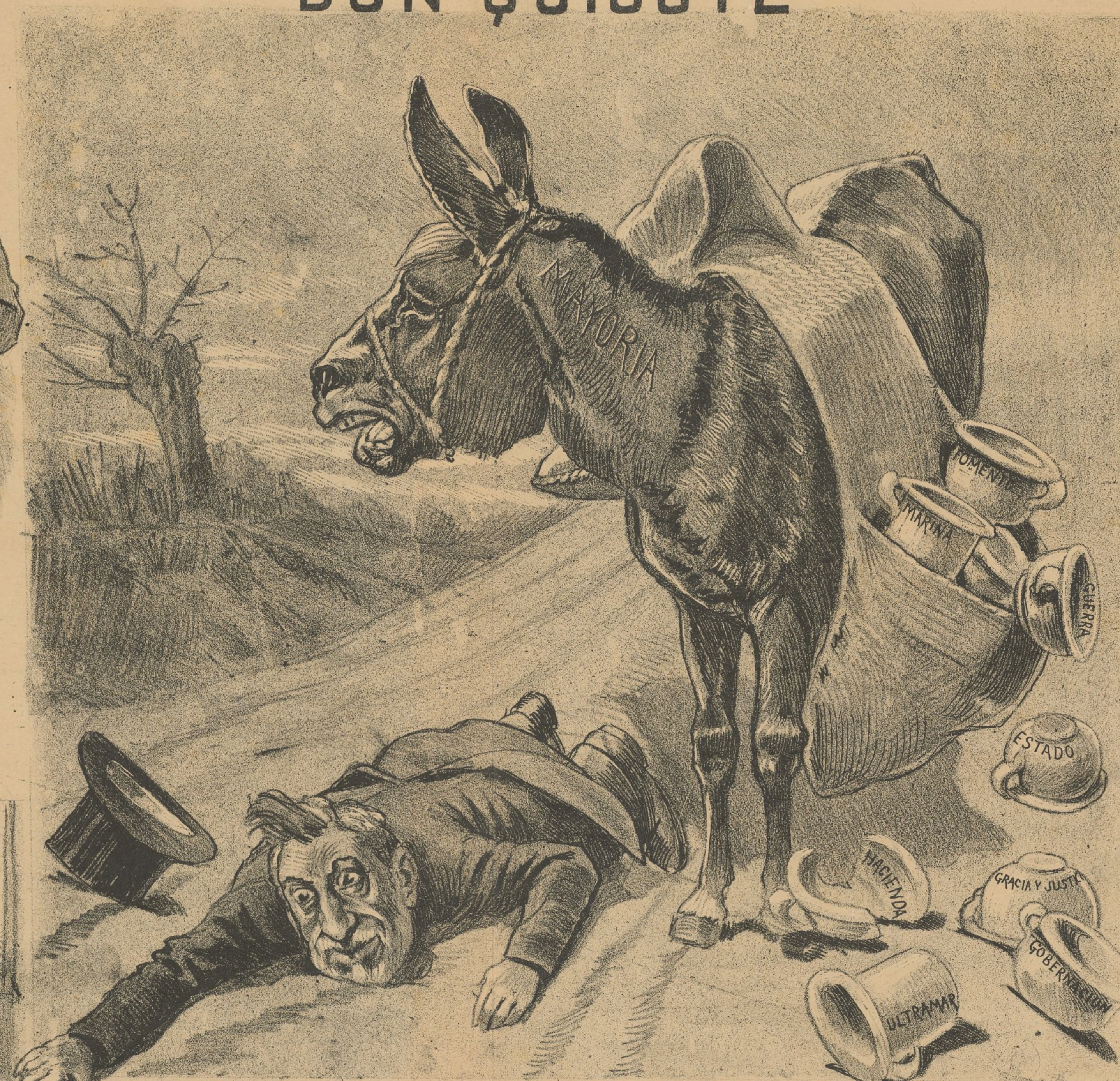
Pero señor; Que cada vez que rebuzna me ha de costar una caída y una vasija.!