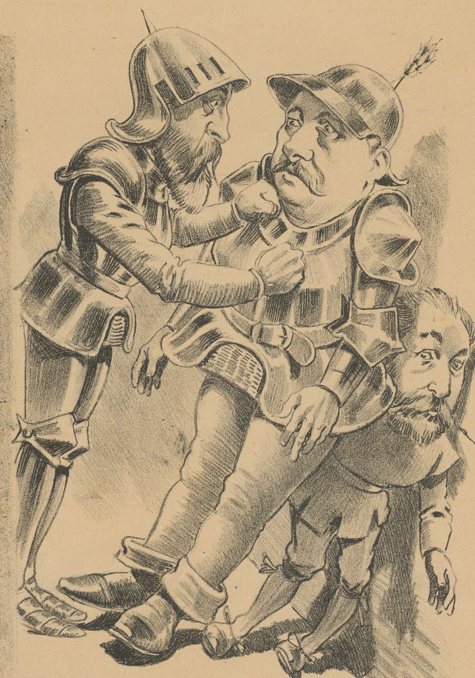
Ello fue un achuchon á Gamazo. Y resultó aplastado Amos.