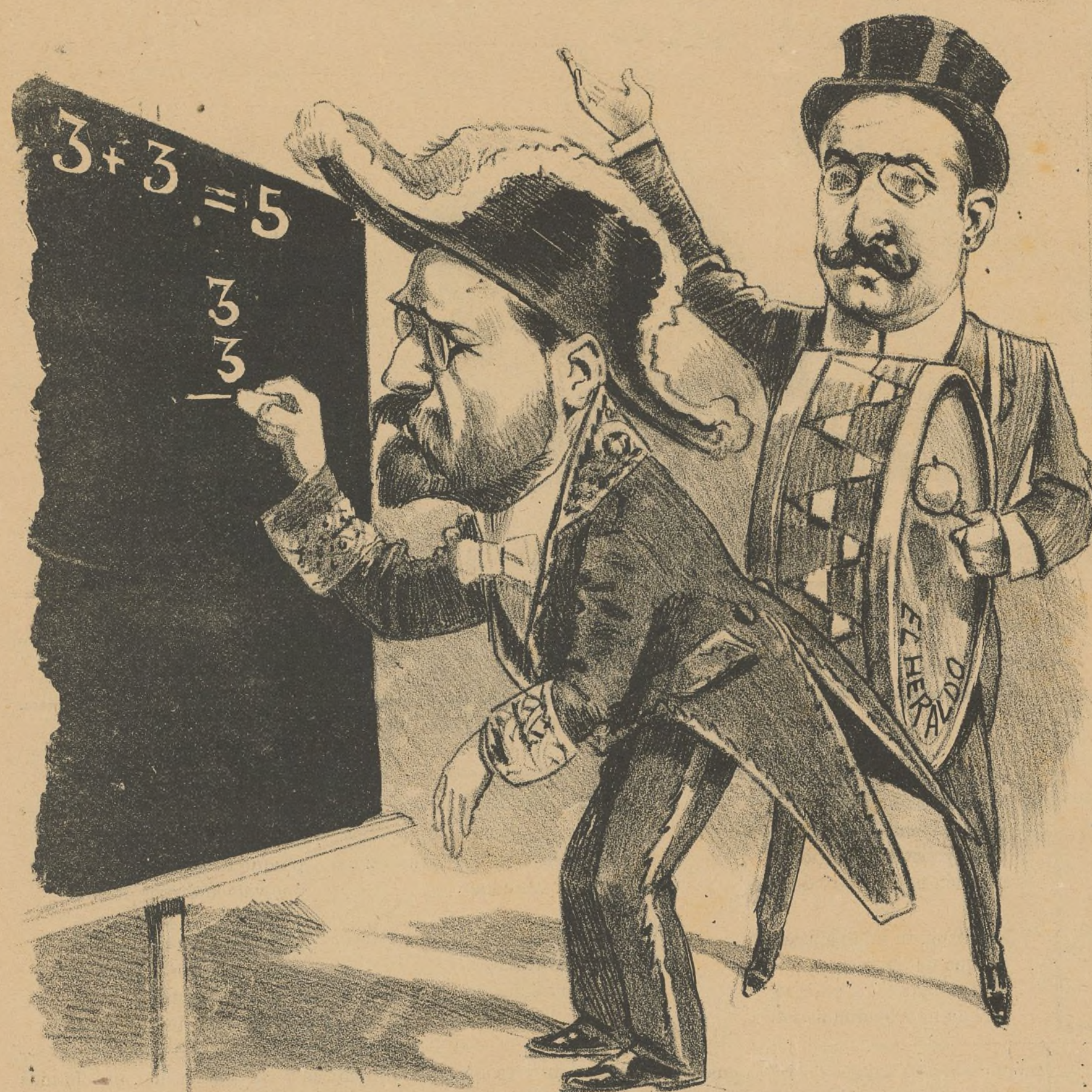
Adelante, caballeros. Vean el ministro fenomeno. Lo mismo hace una suma que una resta que un pastel.