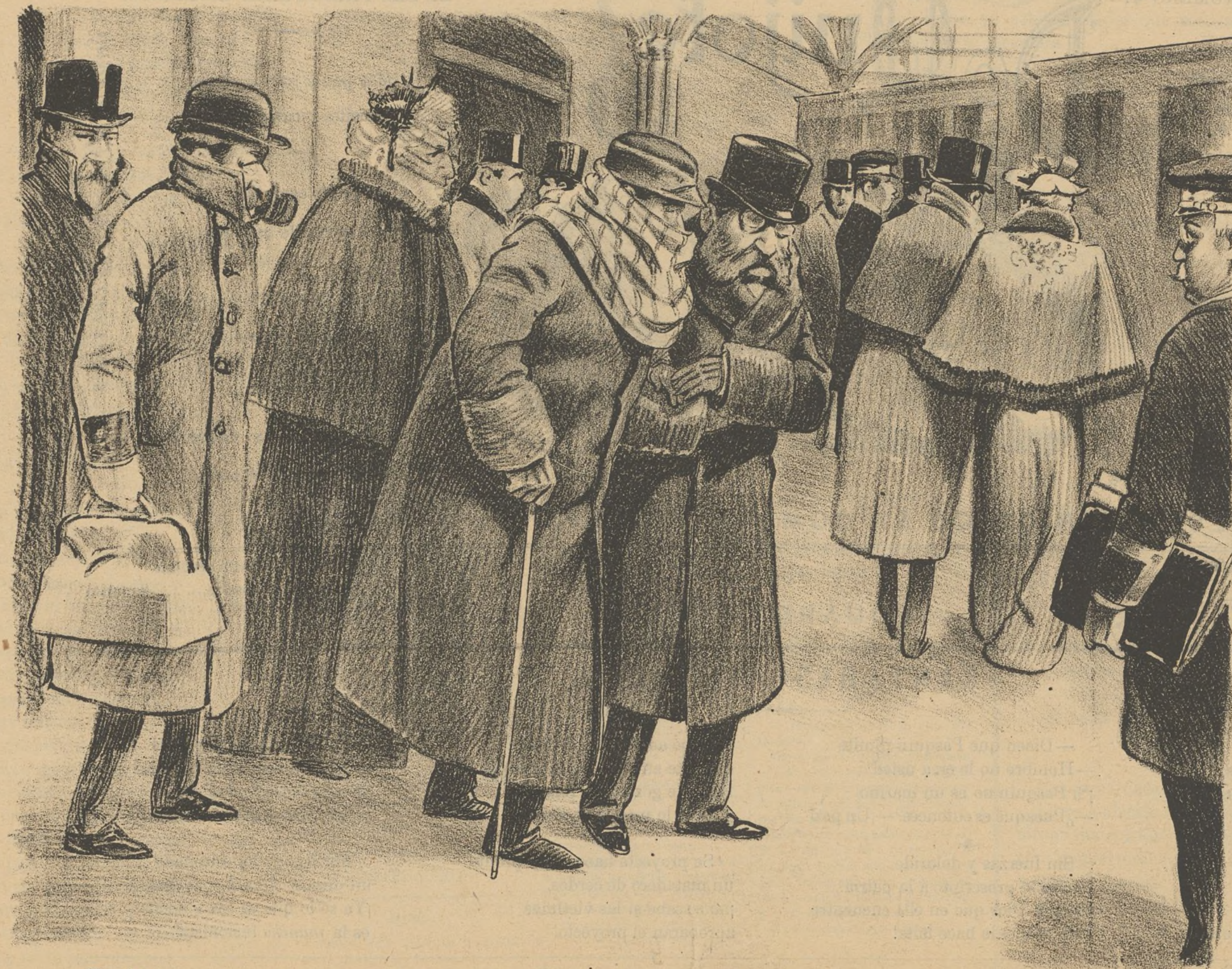
Salida de Paris del Sr. RUIZ ZORILLA.