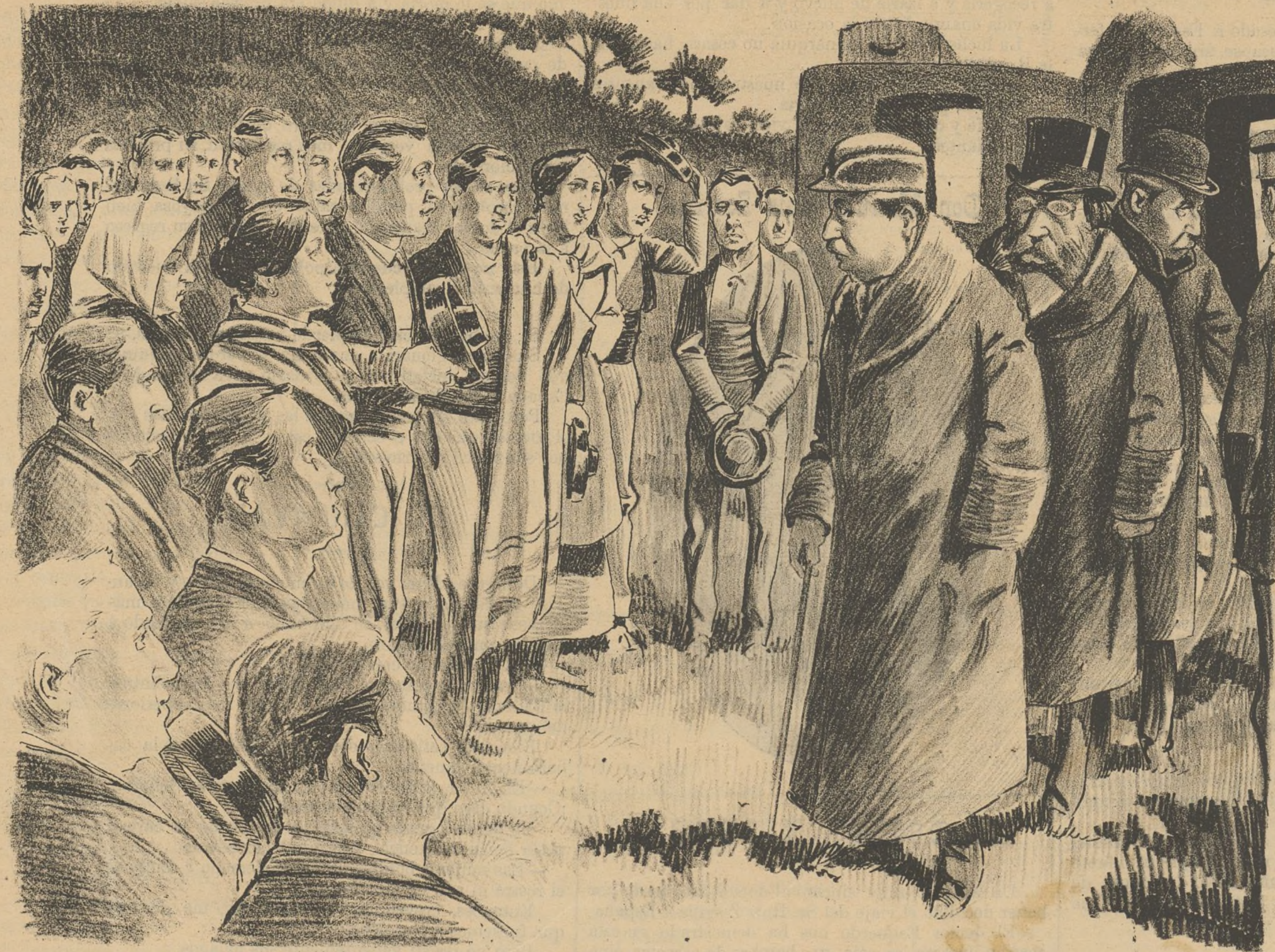
Llegada del Sr. RUIZ ZORILLA a Villajoyosa.