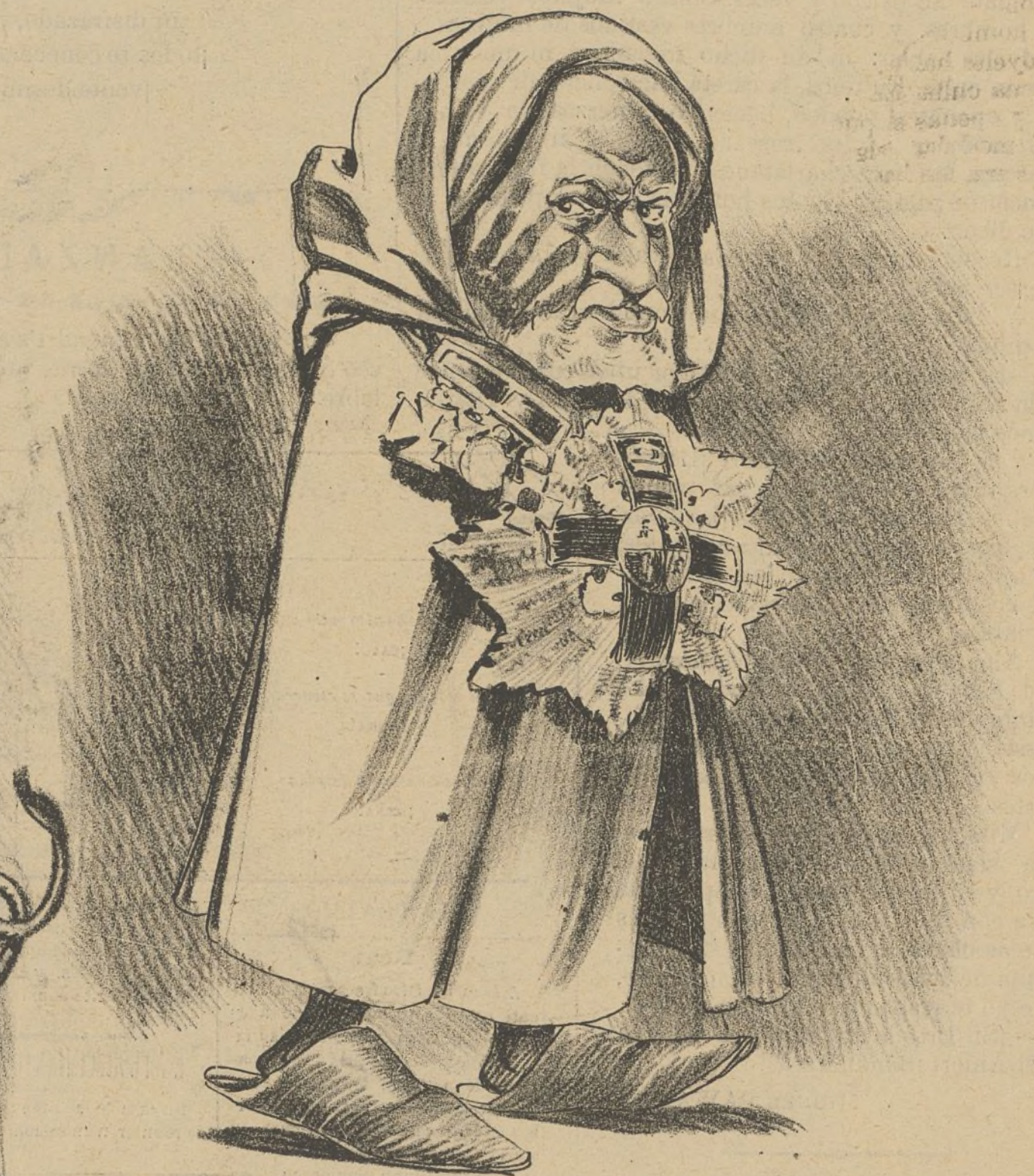
MÁSCARA DE ACTUALIDAD género especial para la exportación.