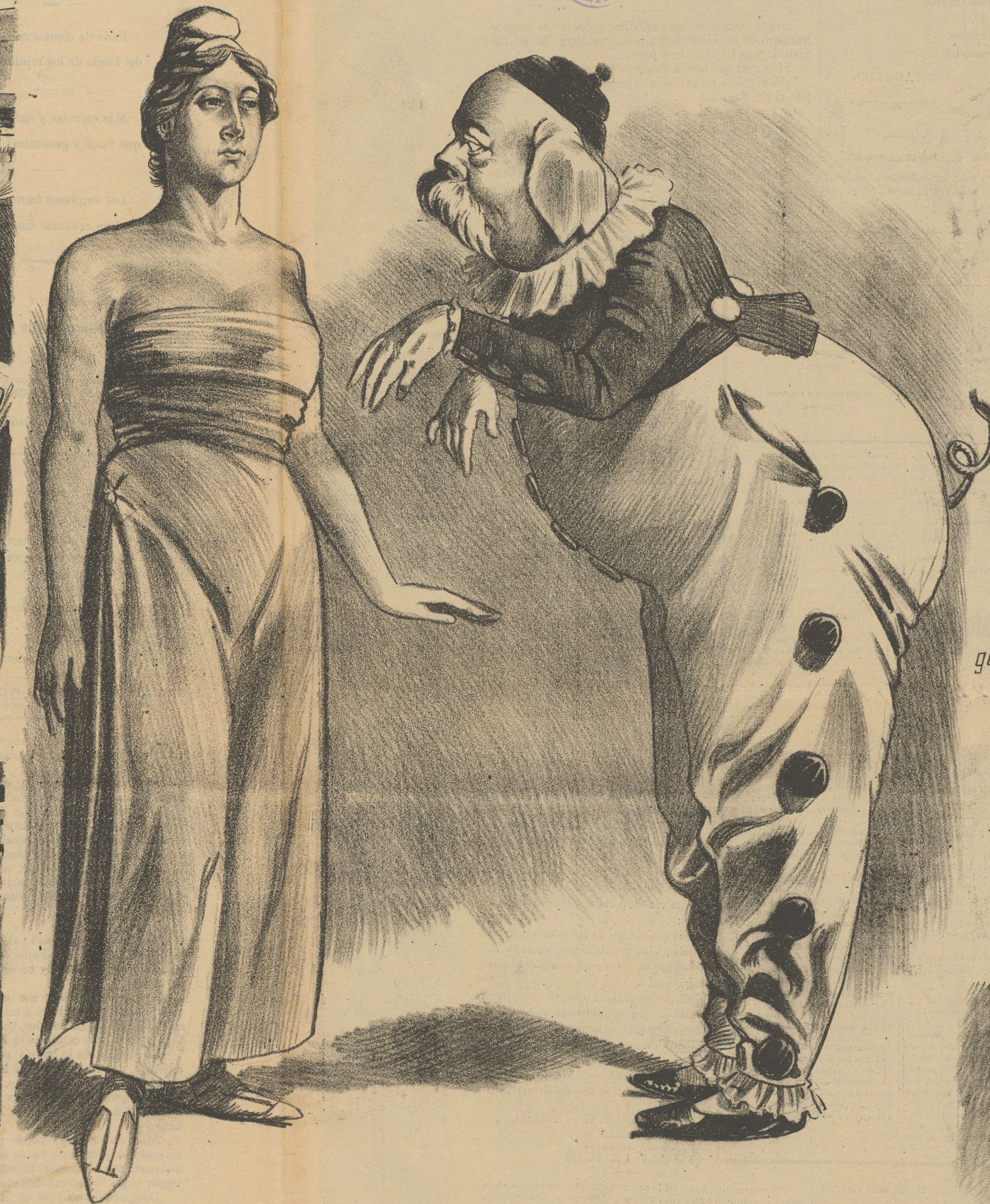
LA MÁSCARA MAMARRACHO Ò EL ILUSTRE TRÁNSFUGA Adios, mujer; ya no me conoces! Demasiado. Mas quisiera no haberte conocido nunca.