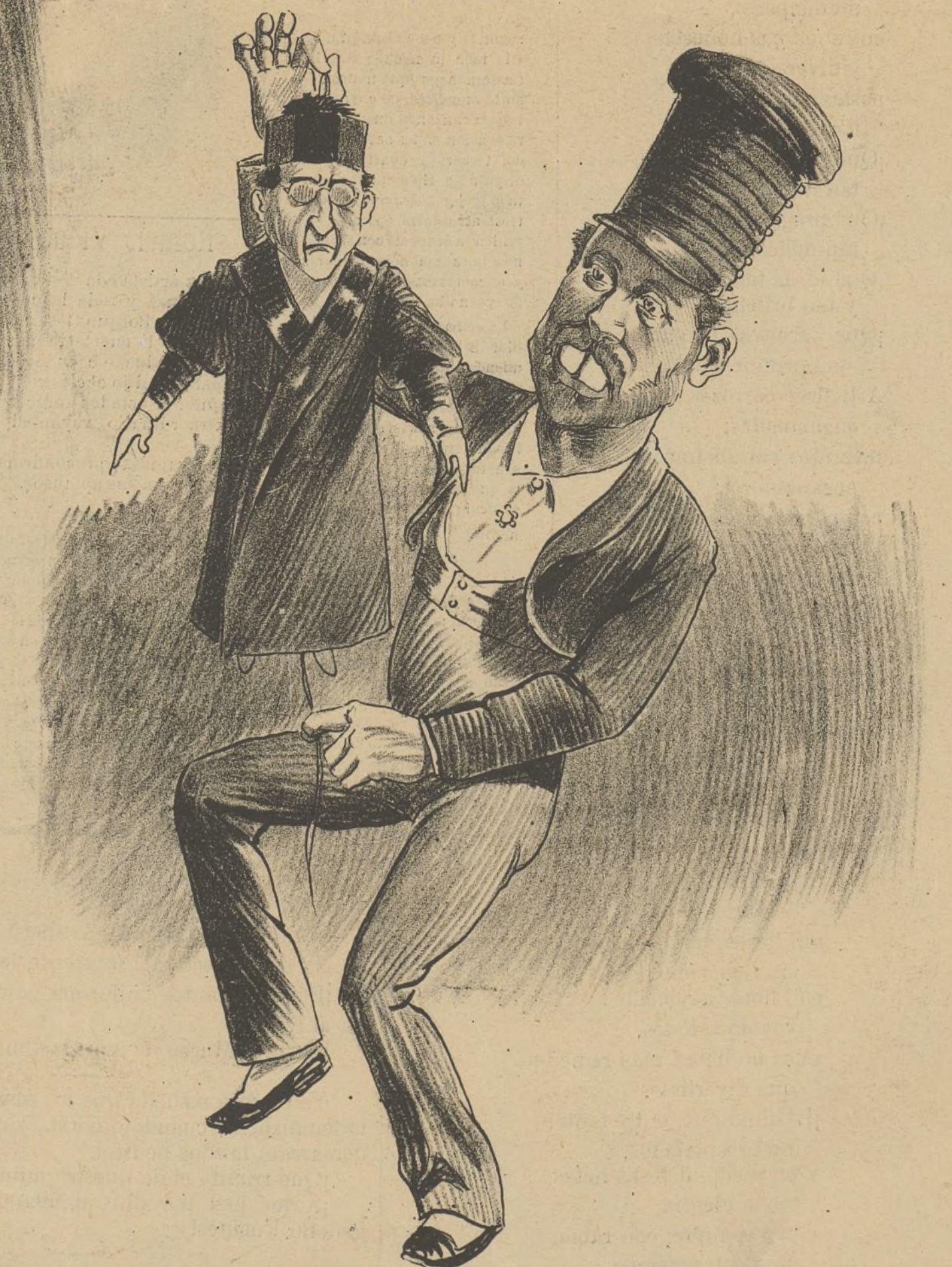
El colmo de las bromas. Un rata jugando con un juez