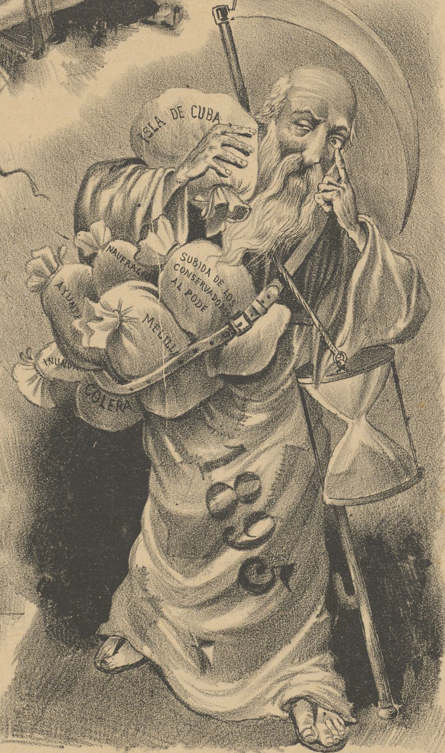
¡Vaya V. con Dios, amigo!