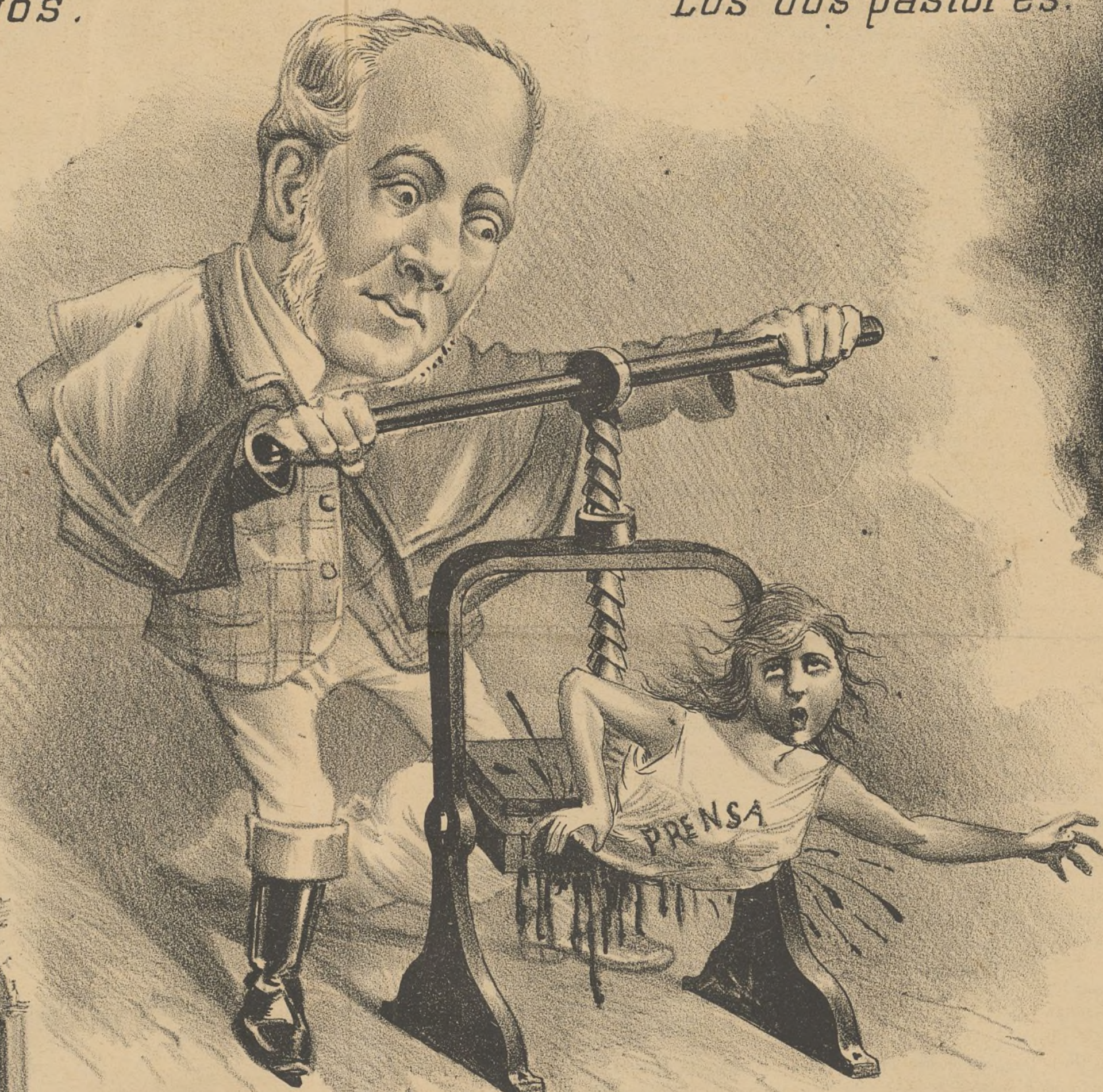
Hay que apretar un poco los tornillos.