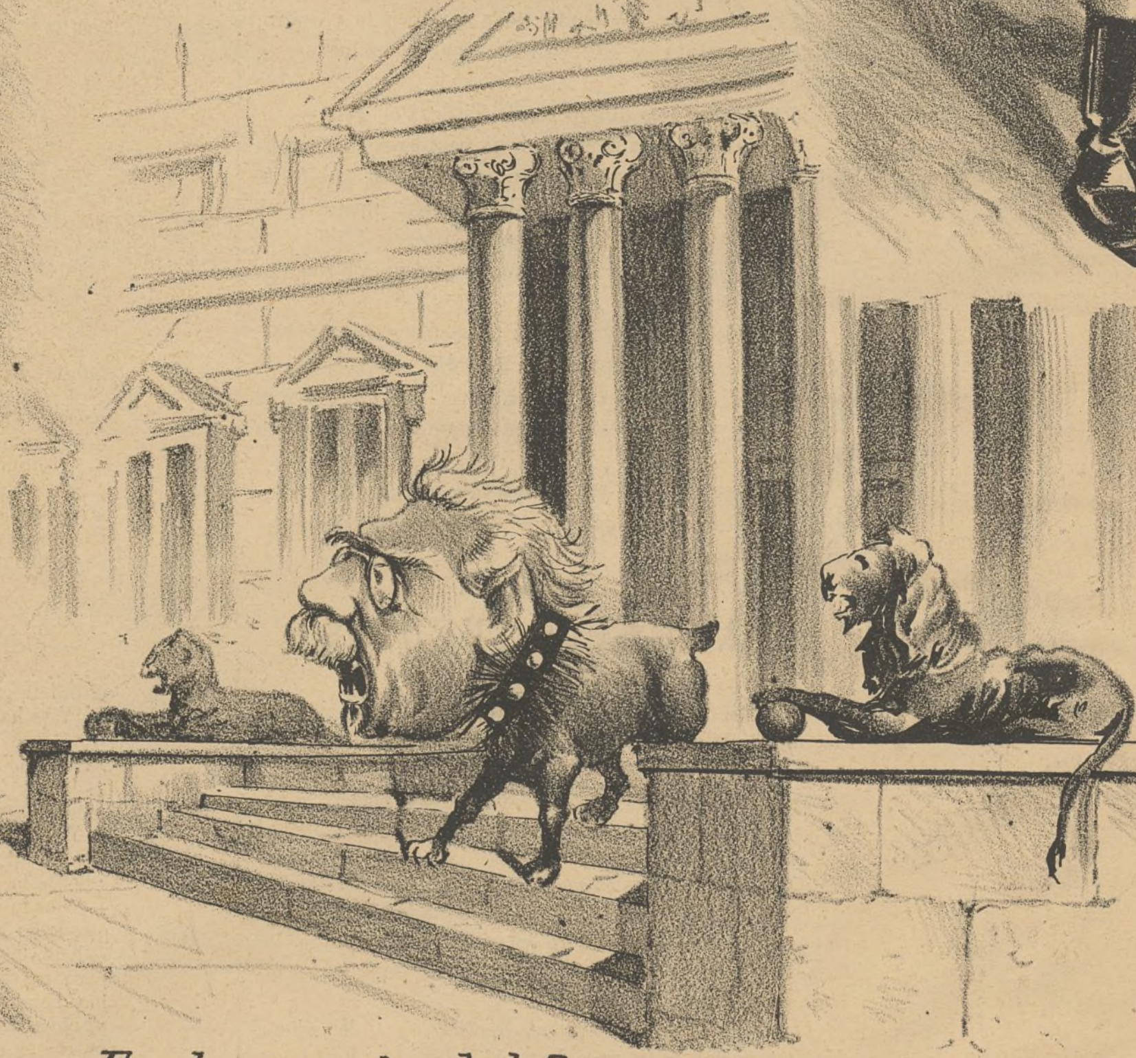
En la puerta del Congreso.