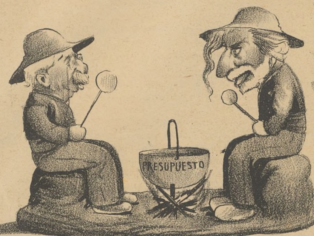
Los dos pastores.