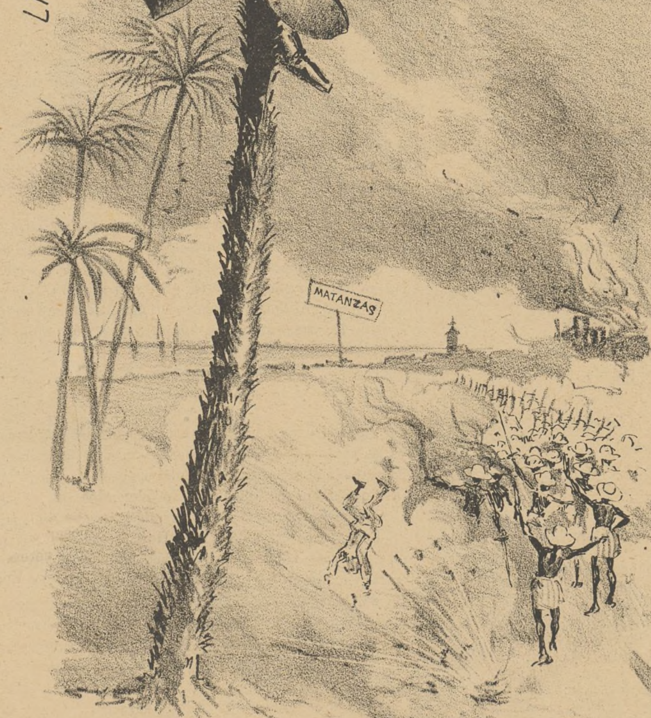
Continuan recibendose buenas noticias de Cuba.