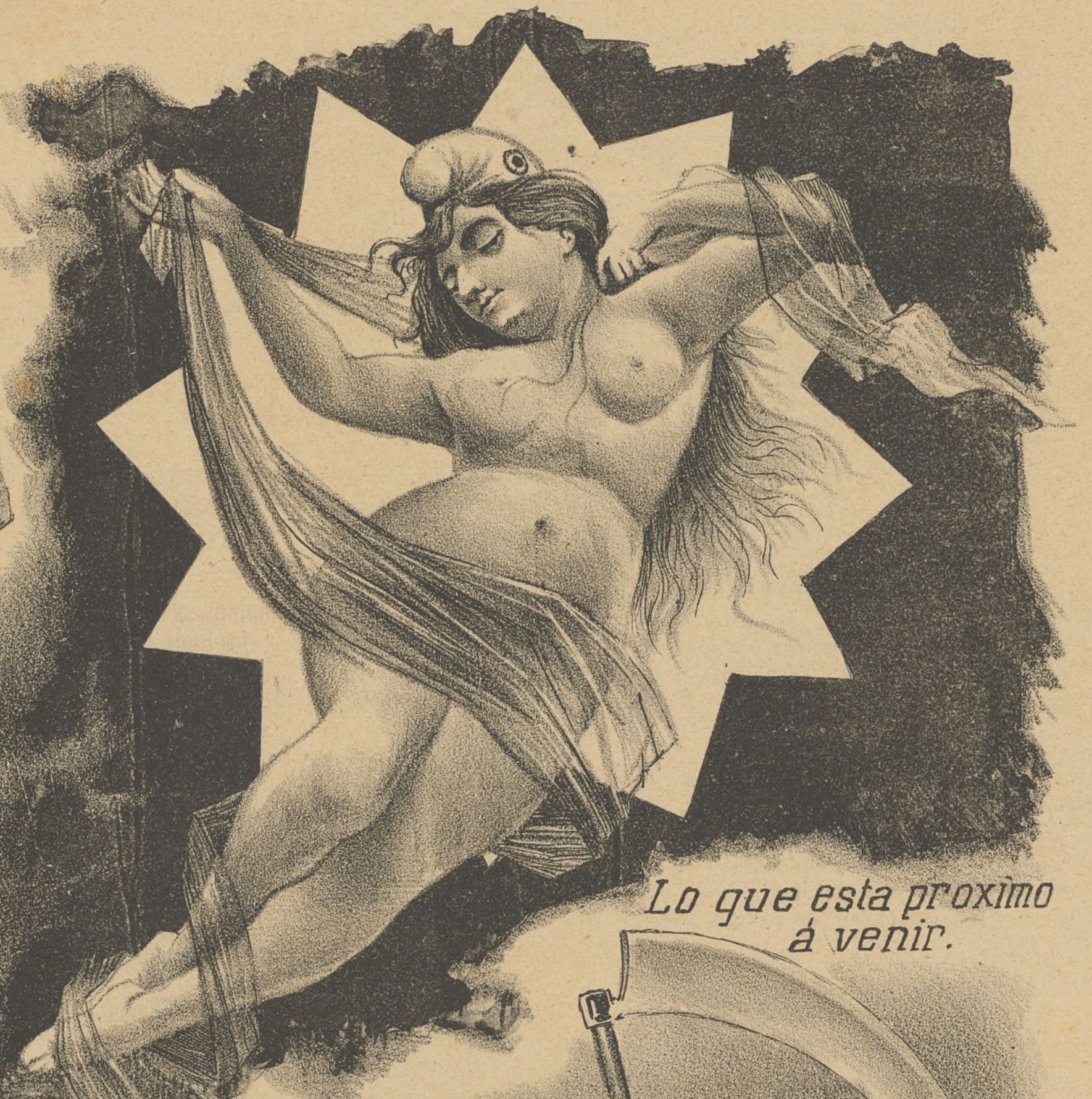
Lo que esta proximo a venir.