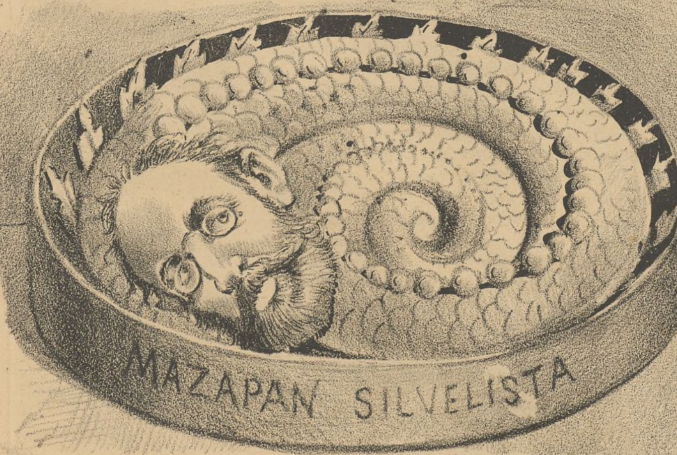
Regalo de Pascua.