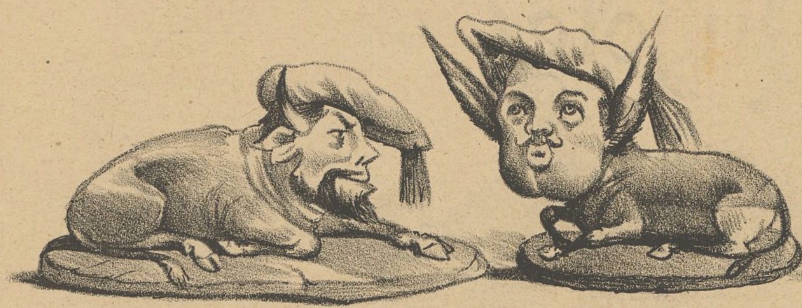
El buey y la Mula.