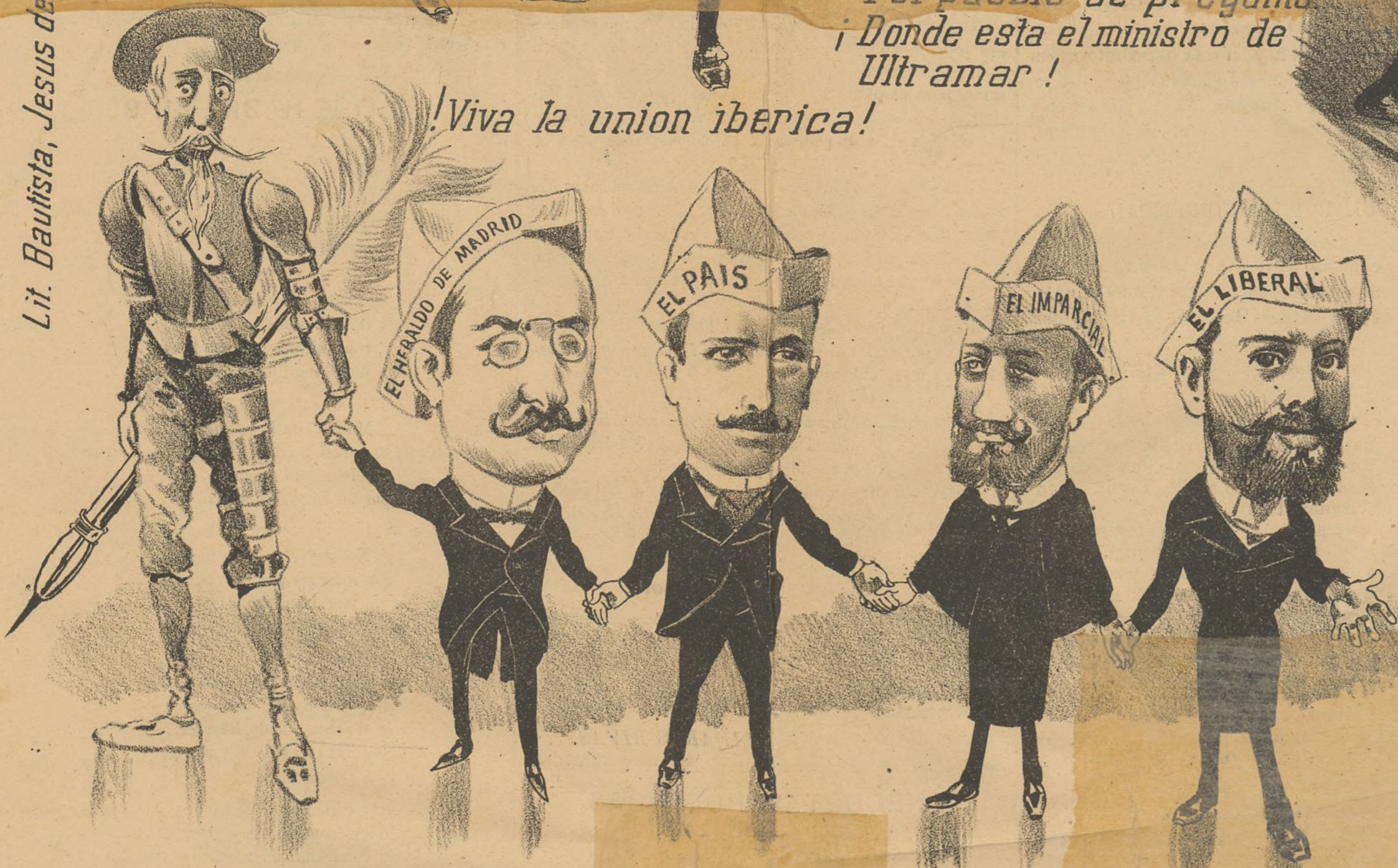
¡Viva la union iberica!