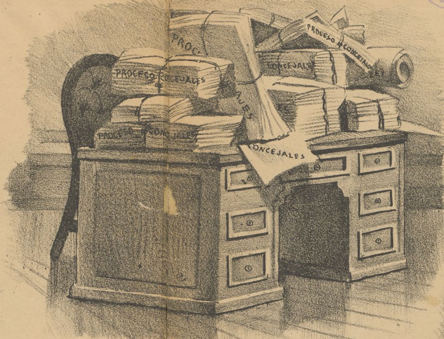
A lo que ha quedado reducido el proceso de los Concejales.