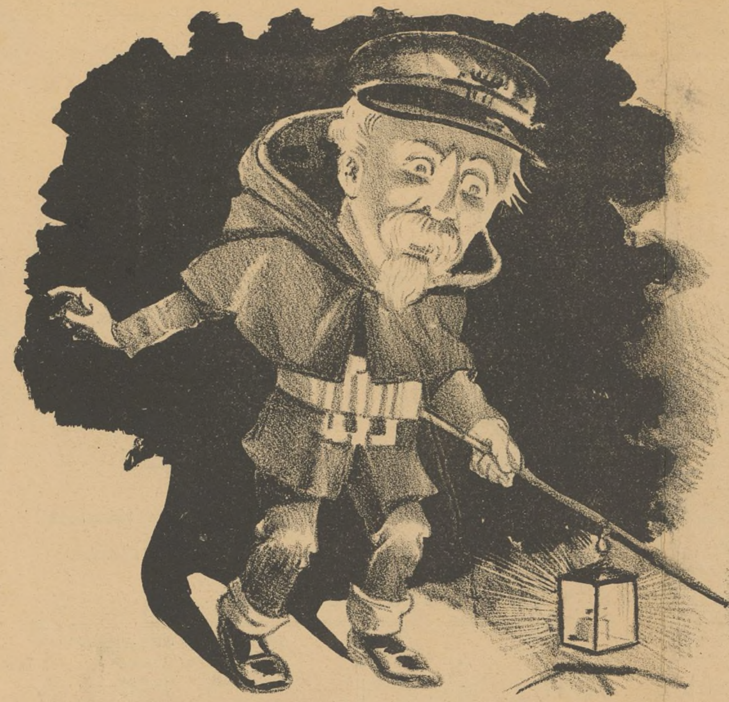
En busca de un alcalde.