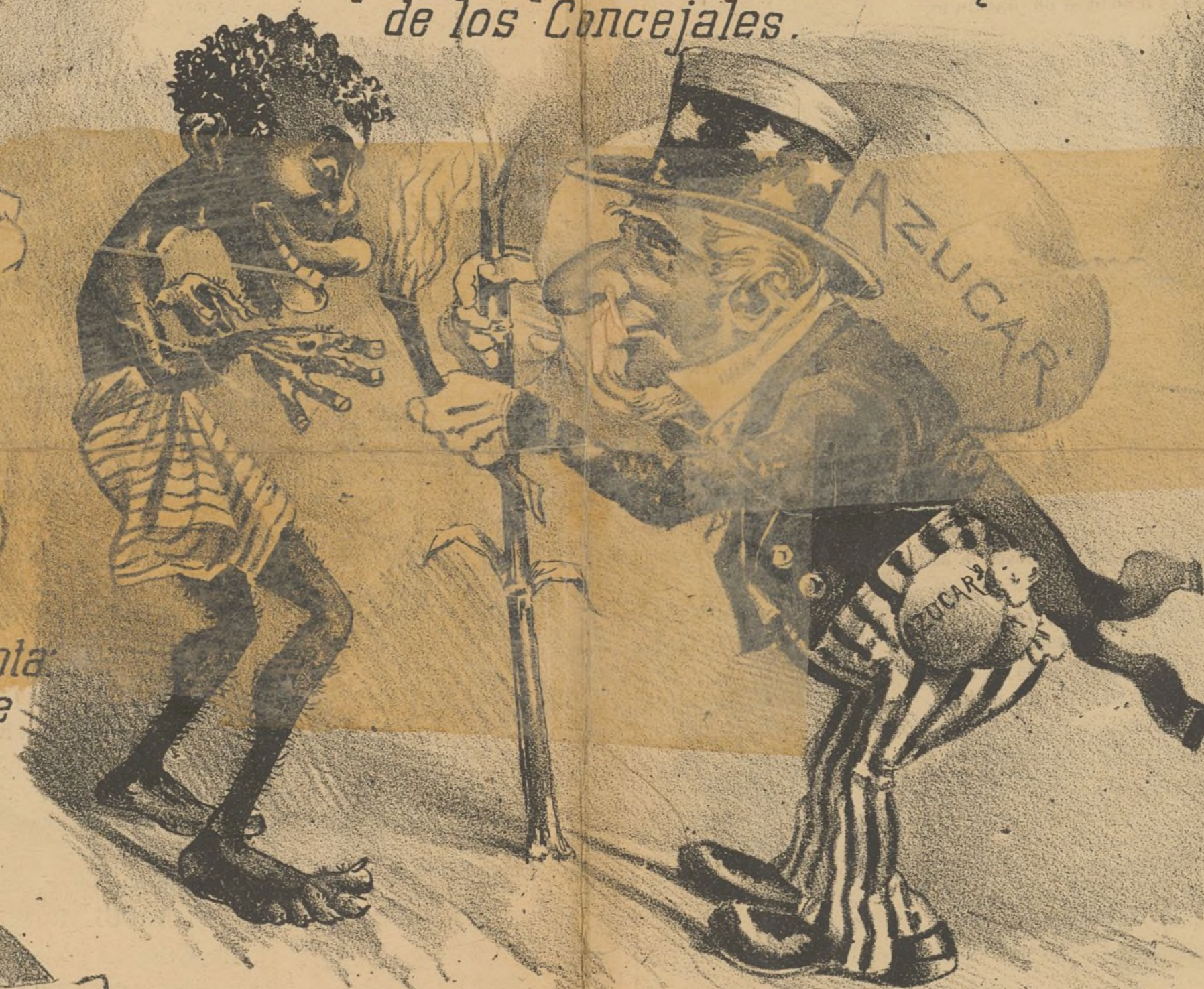
La union hace la fuerza