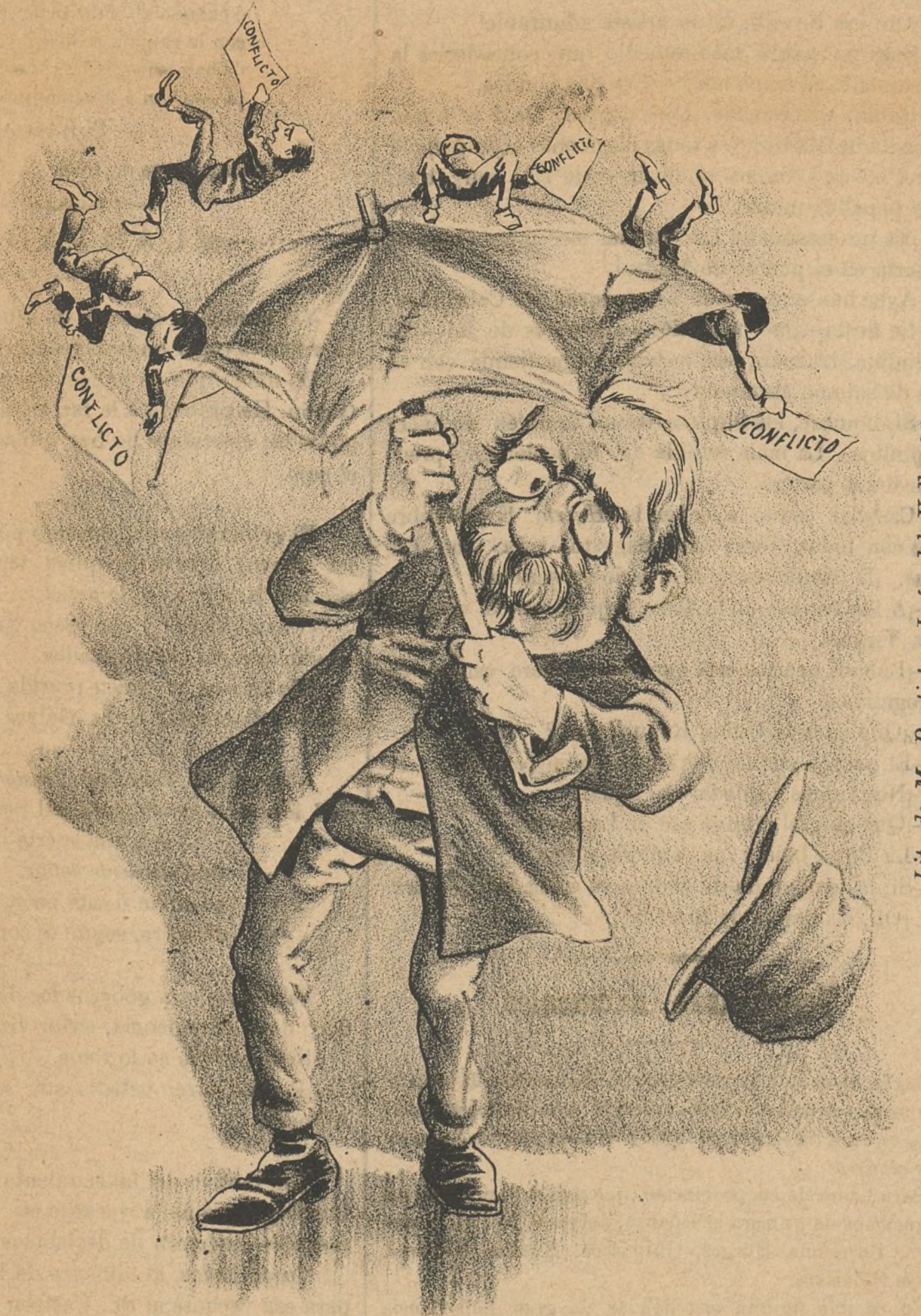
¡Y DICEN QUE HACE FALTA AGUA!

Lit. de M. Bantista, Jesús del Valle, 36.