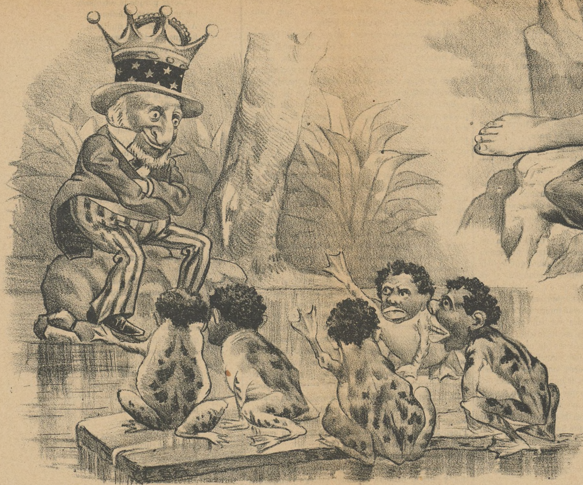
LAS RANAS PIDIENDO REY