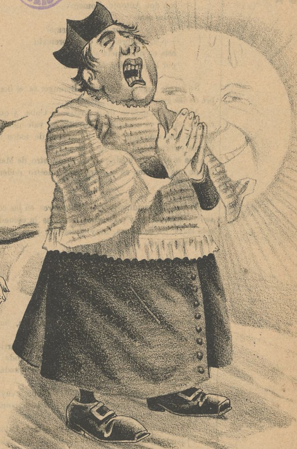
LA ELECCION DE SENADORES