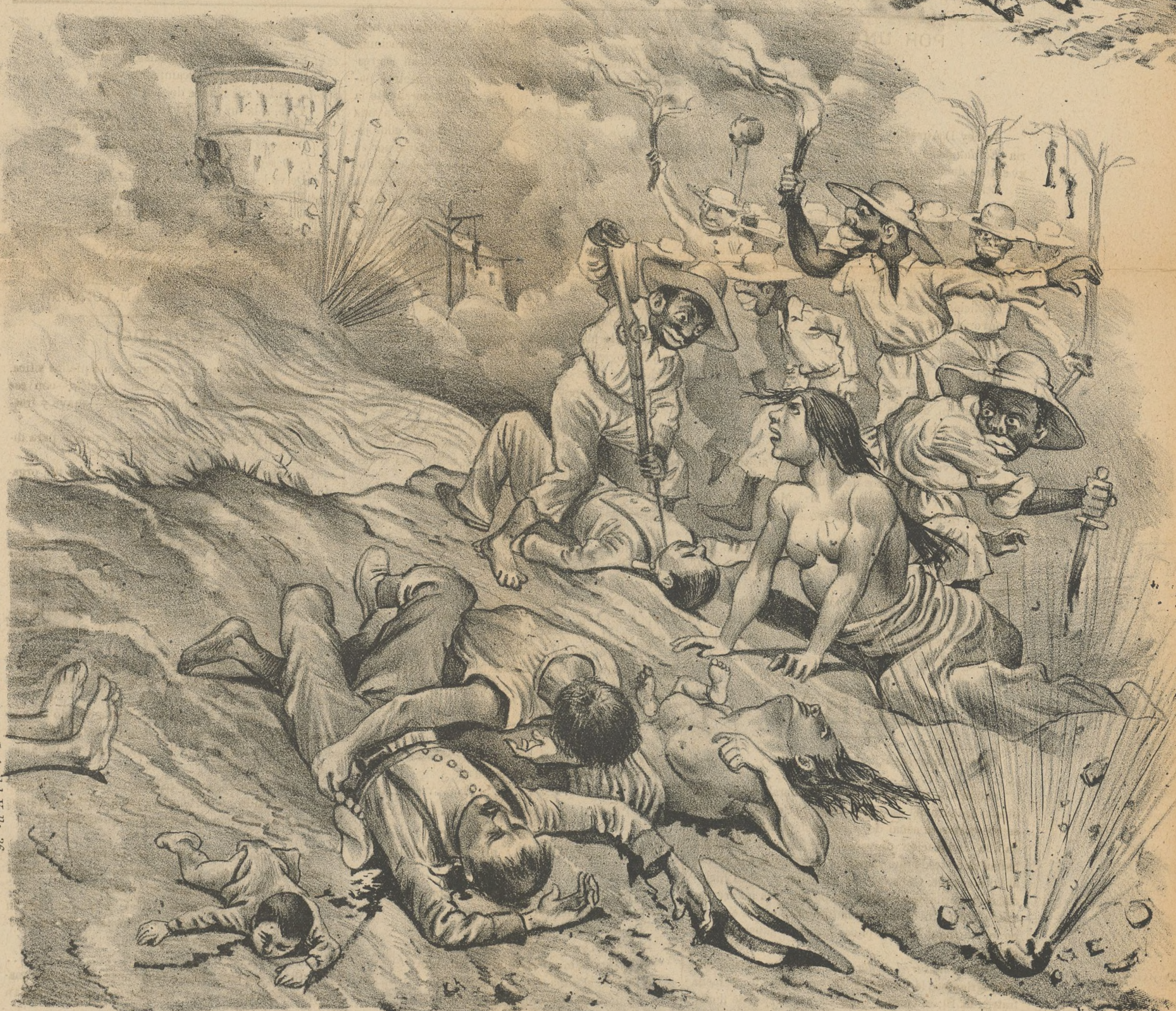
En vista de su comportamiento, habrá que concederles la autonomía.