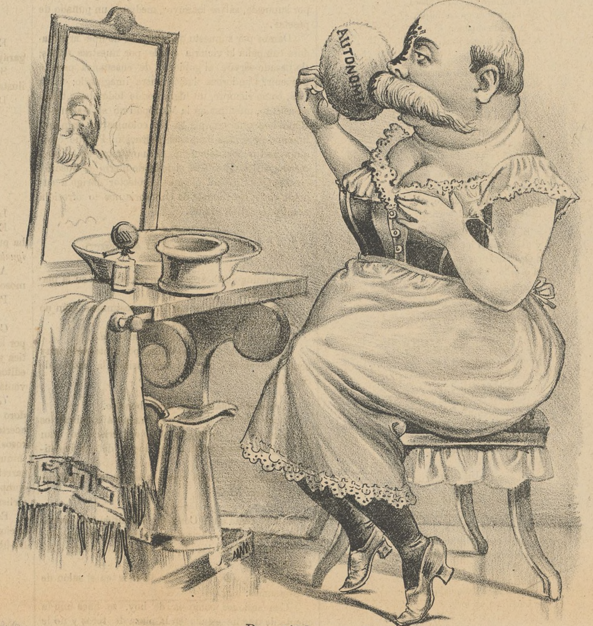
Preparándose para las tareas parlamentarias.