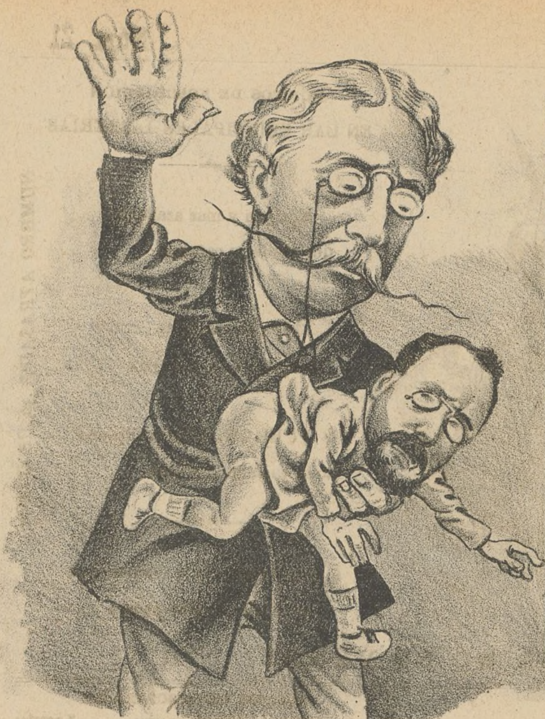
¡Toma, por embustero!