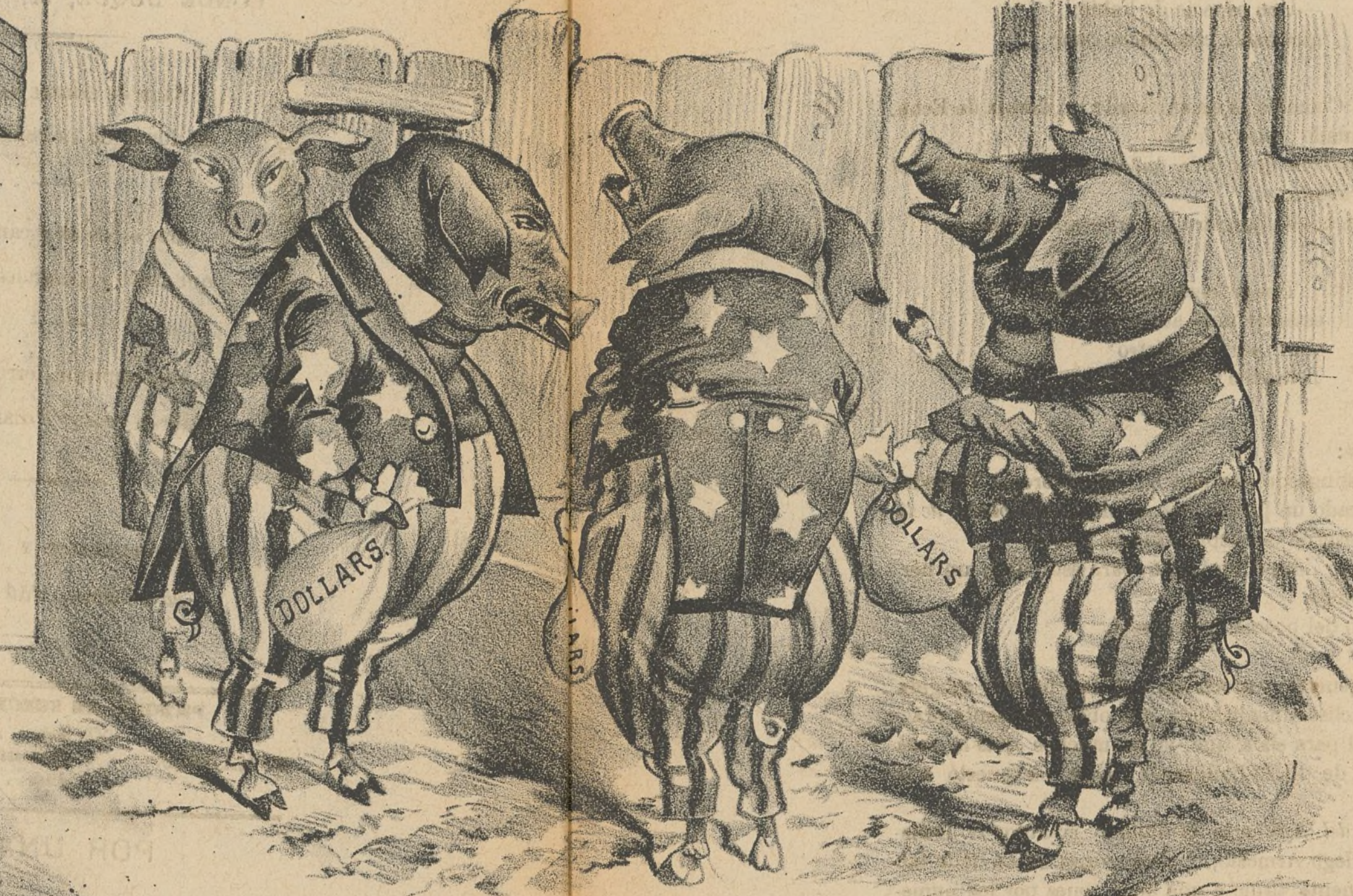
El Senado norteamericano.